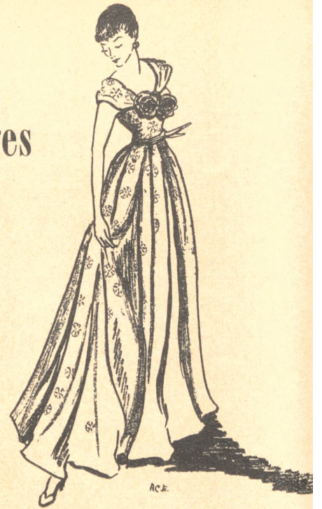
Traje de noche de encaje inglés blanco con guarnición de rosas de mismo material.

Este mismo modisto ha creado otro vestido de noche en encaje de guipur negro, con un escote muy ancho y bajo y con falda en grosgrén rebordeada con encaje.