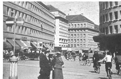
Le quartier moderne de la « City » construit sur l'emplacement d'anciennes propriétés patriciennes. On y trouve encore beaucoup de maisons de soieries. The modern quarter of the « city » section, built on the site of old patrician estates. Many silk weavers still have their headquarters here. El moderno barrio de la « City » construído sobre el emplazamiento de antiguas propiedades patricias. Se encuentran todavía muchas casas sederas. Das moderne « City » Viertel, das an Stelle der alten Patrizierbesitzungen aufgebaut wurde. Sehr viele Seidenfirmen haben noch immer dort ihren Sitz.

Trotz aller Grösse ist Zürich, ist das ganze saubere, offene Stadtbild noch recht schweizerisch, manchmal ein wenig kalt und steif — mehr durch Bemühung will uns scheinen, als von Natur. Auf alle Fälle bietet diese Stadt dem Neugierigen, der zwischen zwei Geschäftsreisen Zeit findet in der Morgensonne einen Bummel über die Schipfe zu machen oder in der Abenddämmerung in den Gassen zu Füssen des Grossmünster vor den Auslagen der Trödeläden herumzuschlendern, eine Fülle des Interessanten. Er wird Entdeckerfreuden geniessen, sich an längst Vergangenes erinnern und viele flüchtige Eindrücke haben, die manchmal die dauerndsten sind, weil sie nicht so sehr im Gedächtnis haften — als im menschlichen Herzen lebendig bleiben.