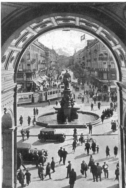
La Bahnhofstrasse (rue de la Gare) vue du hall de la gare centrale.

The « Bahnhofstrasse », seen from the Central Station, La Bahnhofstrasse (Avenida de la Estación), vista tomada desde el pórtico de la estación central.