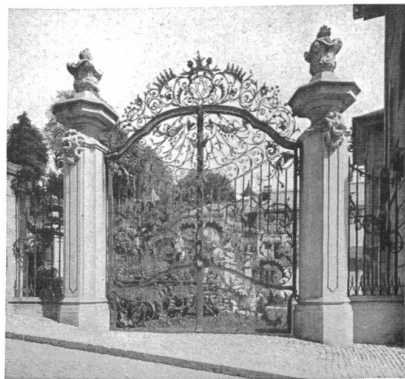
Schmiedeeisernes Barockportal ; Eingang zu dem Patrizierhaus « Zum Reehberg », das lange Zeit hindurch Mittelpunkt des gesellschaftlichen Lebens und Treffpunkt der Diplomatie war.