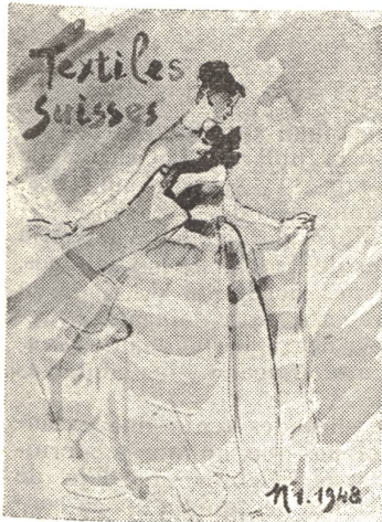
Modelo de ropas hechas manufacturadas en Zurich, confeccionado en un tejido de algodón procedente de St-Gall.