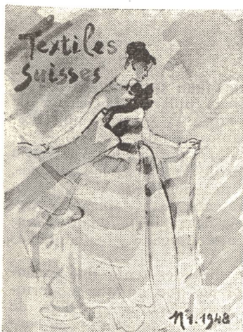
Modelo de ropas hechas manufacturadas en Zurich, confeccionado en un tejido de algodón procedente de St-Gall.