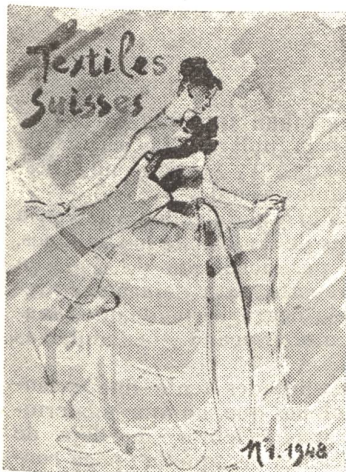
Modelo de ropas hechas manufacturadas en Zurich, confeccionado en un tejido de algodón procedente de St-Gall.