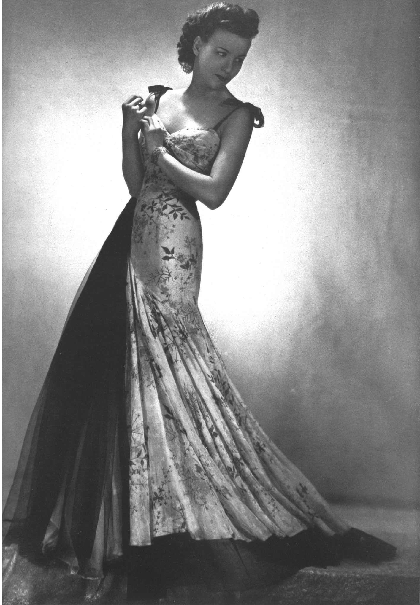
MAGGY ROUFF Stoffel & Cie, St-Gall