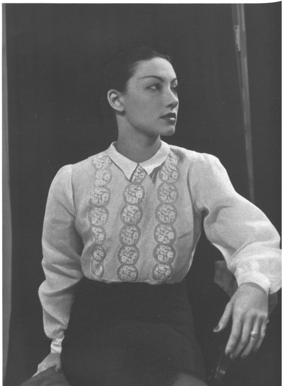
JEANNE LANVIN Union S.A., St-Gall