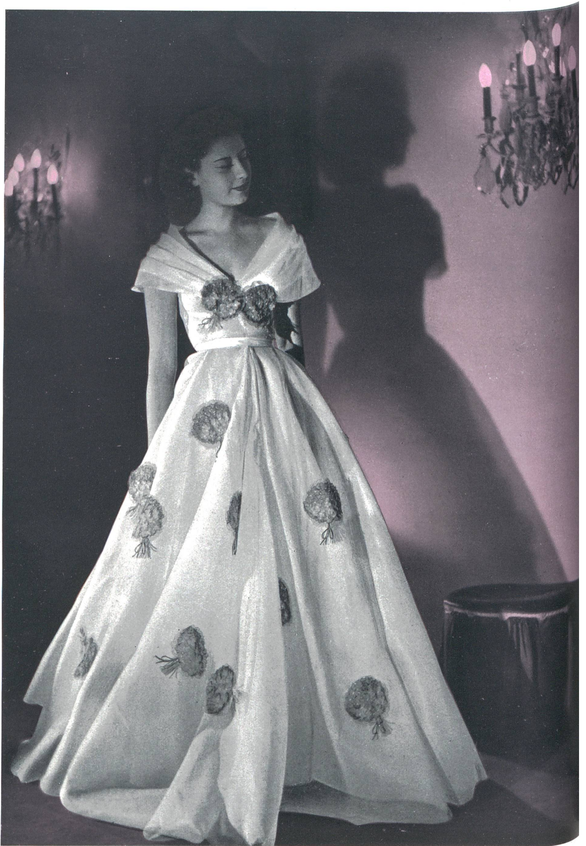
NINA RICCI Forster Willi & Cie, St-Gall