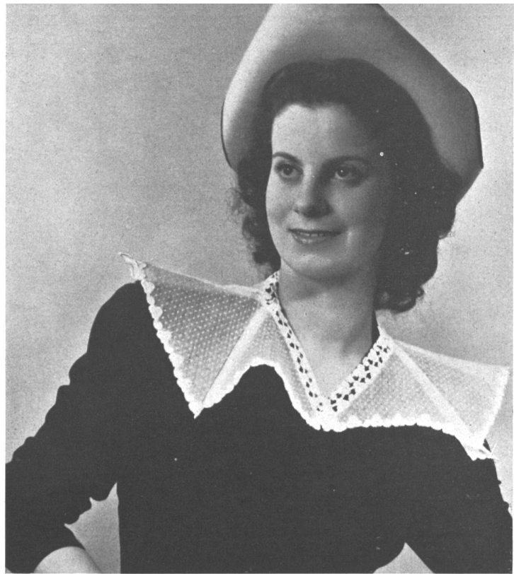
KROUPINE Union & Cie, St-Gall Aug. Giger & Cie, St-Gall