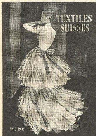
CHRISTIAN DIOR Forster Willi & C ie , St-Gall. Stoffel & C ie , St-Gall.