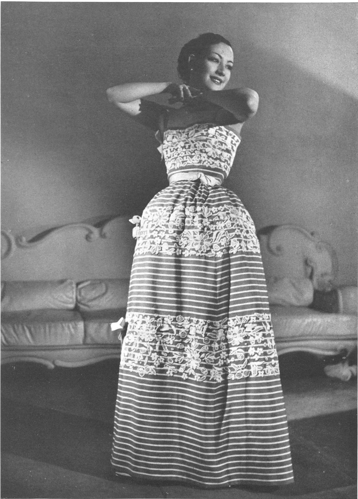
BALENCIAGA Walter Schrank & Cie, St-Gall