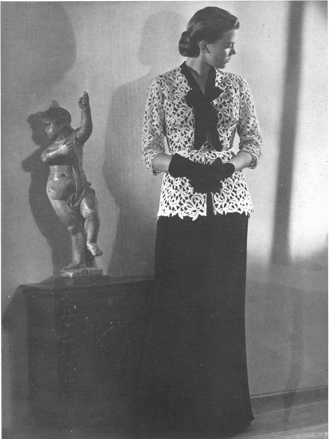
JEAN DESSES Forster Willi & Cie, St-Gall