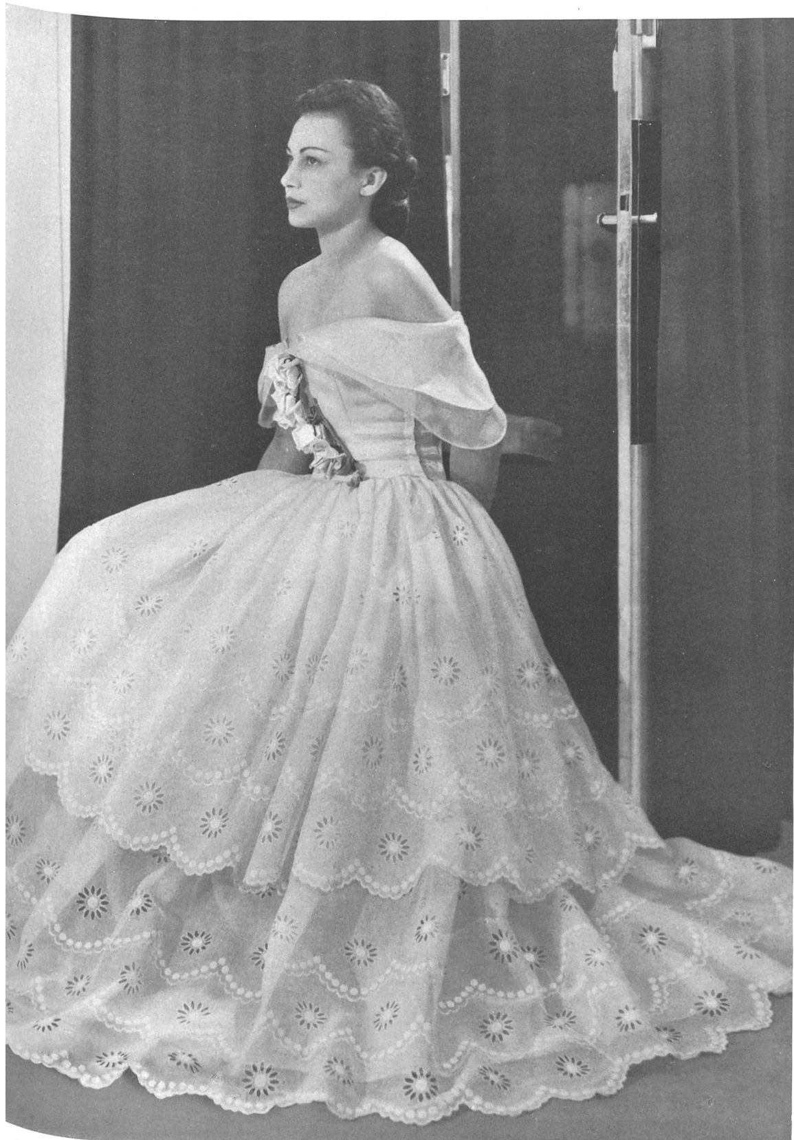
JEANNE LANVIN J. G. Nef & Cie, Hérissau