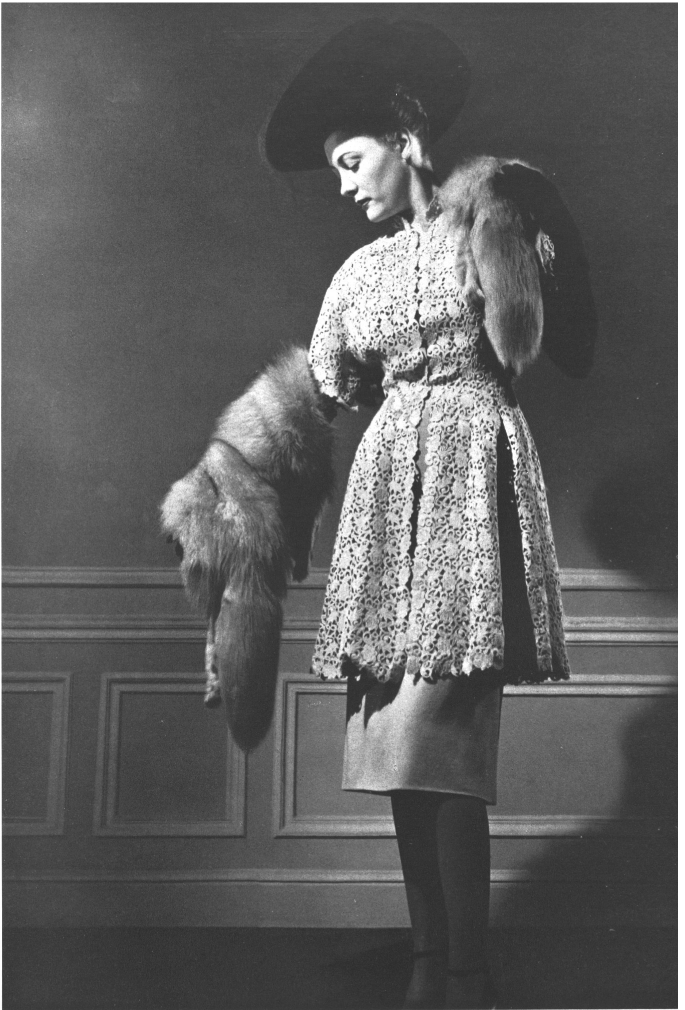
PIERRE BALMAIN Union S.A., St-Gall