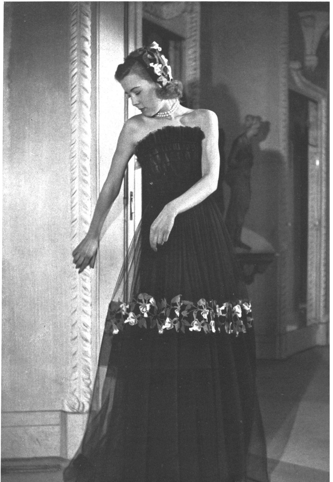
BRUYÈRE Forster Willi & Cie, St-Gall