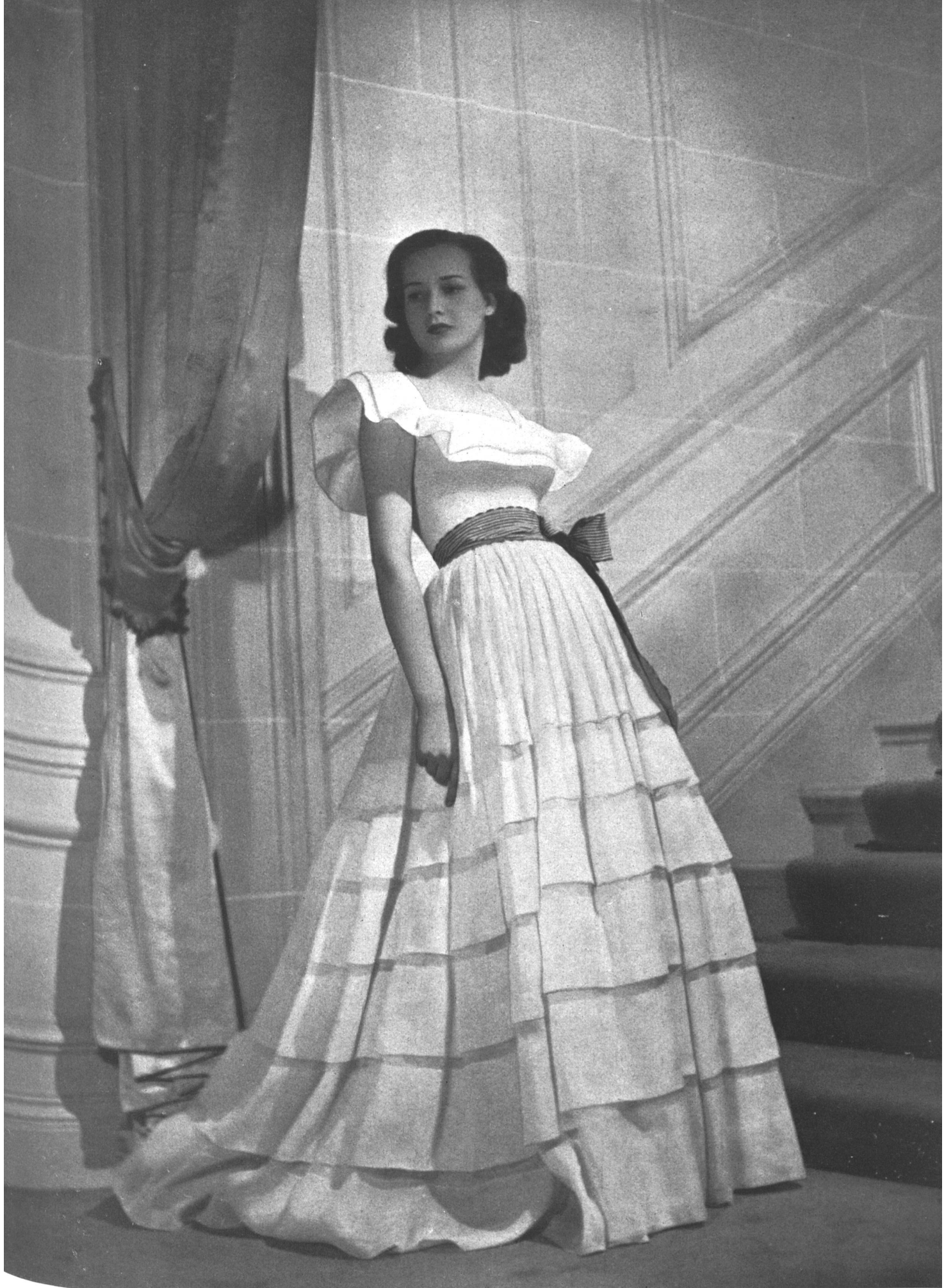
CHRISTIAN DIOR Organdi blanc de St-Gall