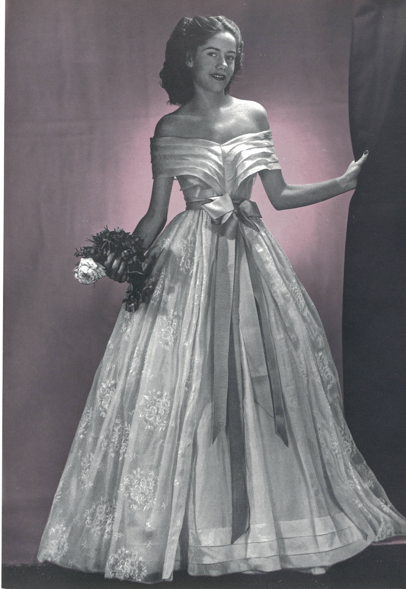
MAGGY ROUFF Forster Willi & Cie, St-Gall