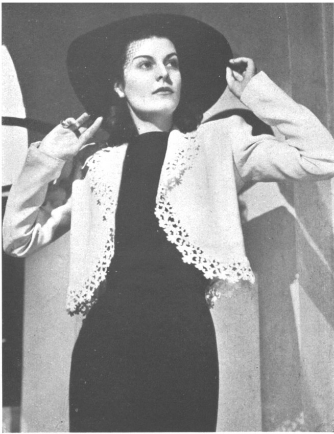
JEANNE LANVIN Aug. Giger & Cie, St-Gall