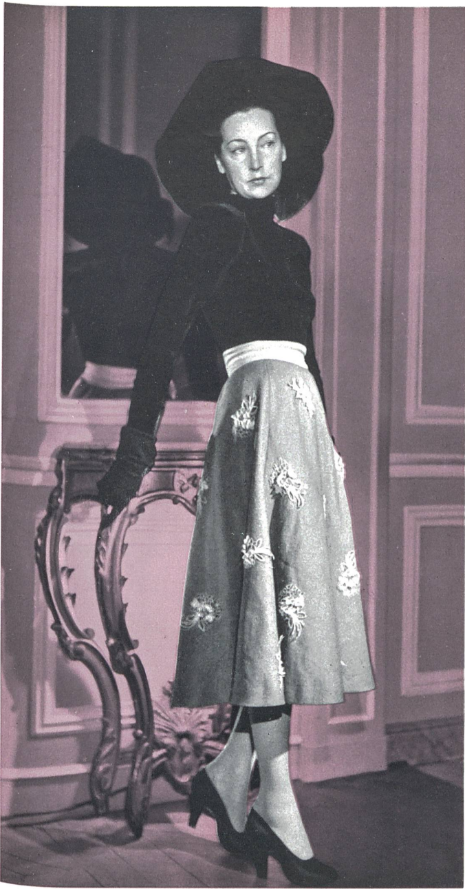
JACQUES FATH Forster Willi & Cie, St-Gall