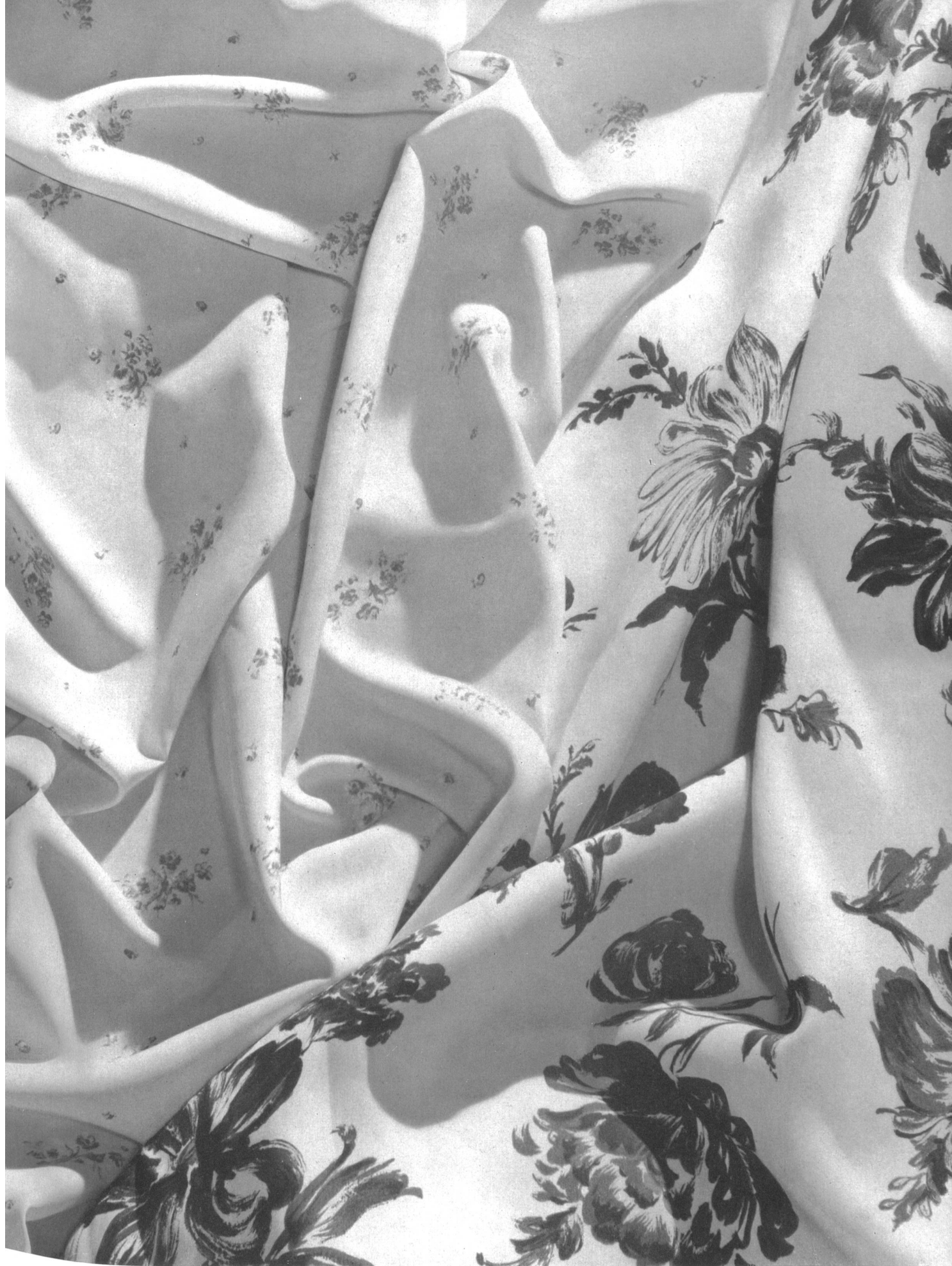
Hausamann & Cie, Winterthour Algunos géneros de la nueva colección de telas para vestidos y lencería