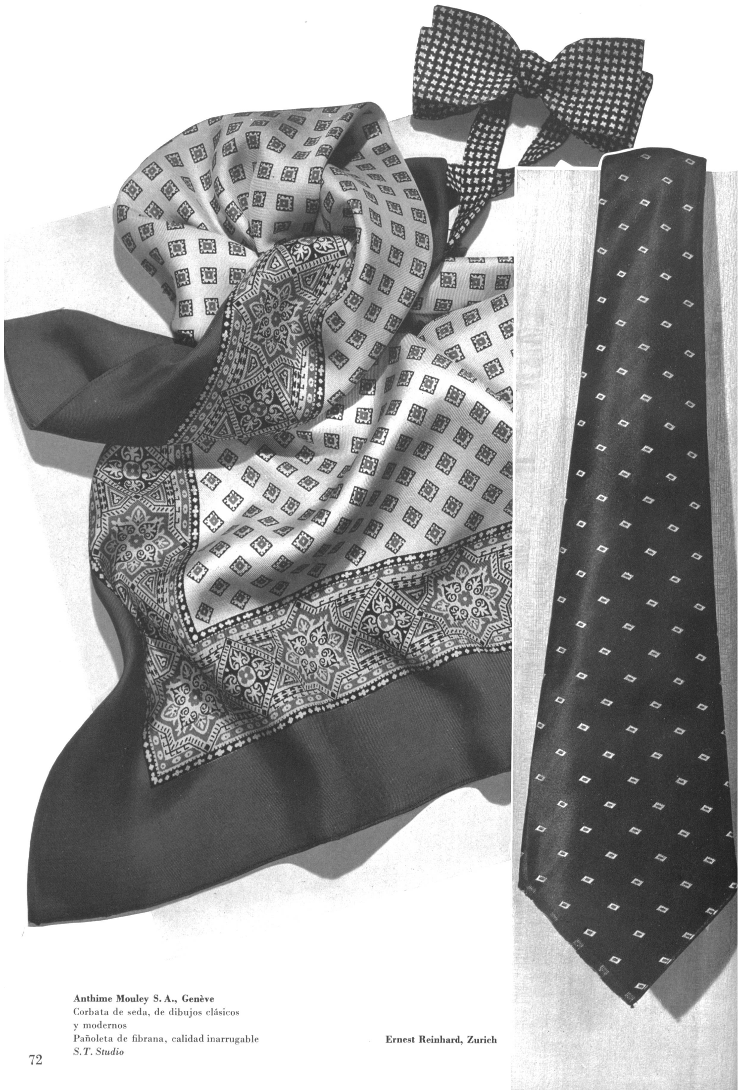
Anthime Mouley S. A., Genève Corbata de seda, de dibujos clásicos y modernos Pañoleta de fibrana, calidad inarrugable S.T. Studio