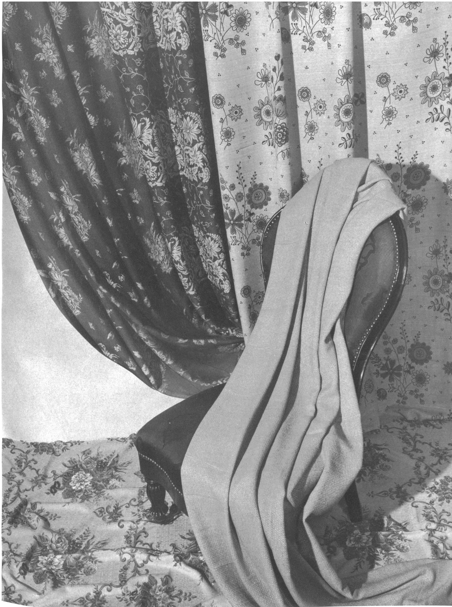
Société Anonyme A. & R. Moos, Weiblingen / Zeh. Telas para decoración: estampadas, Jacquard, tejidas en color, lisas. Telas para mueblaje. Chintz S.T. Studio