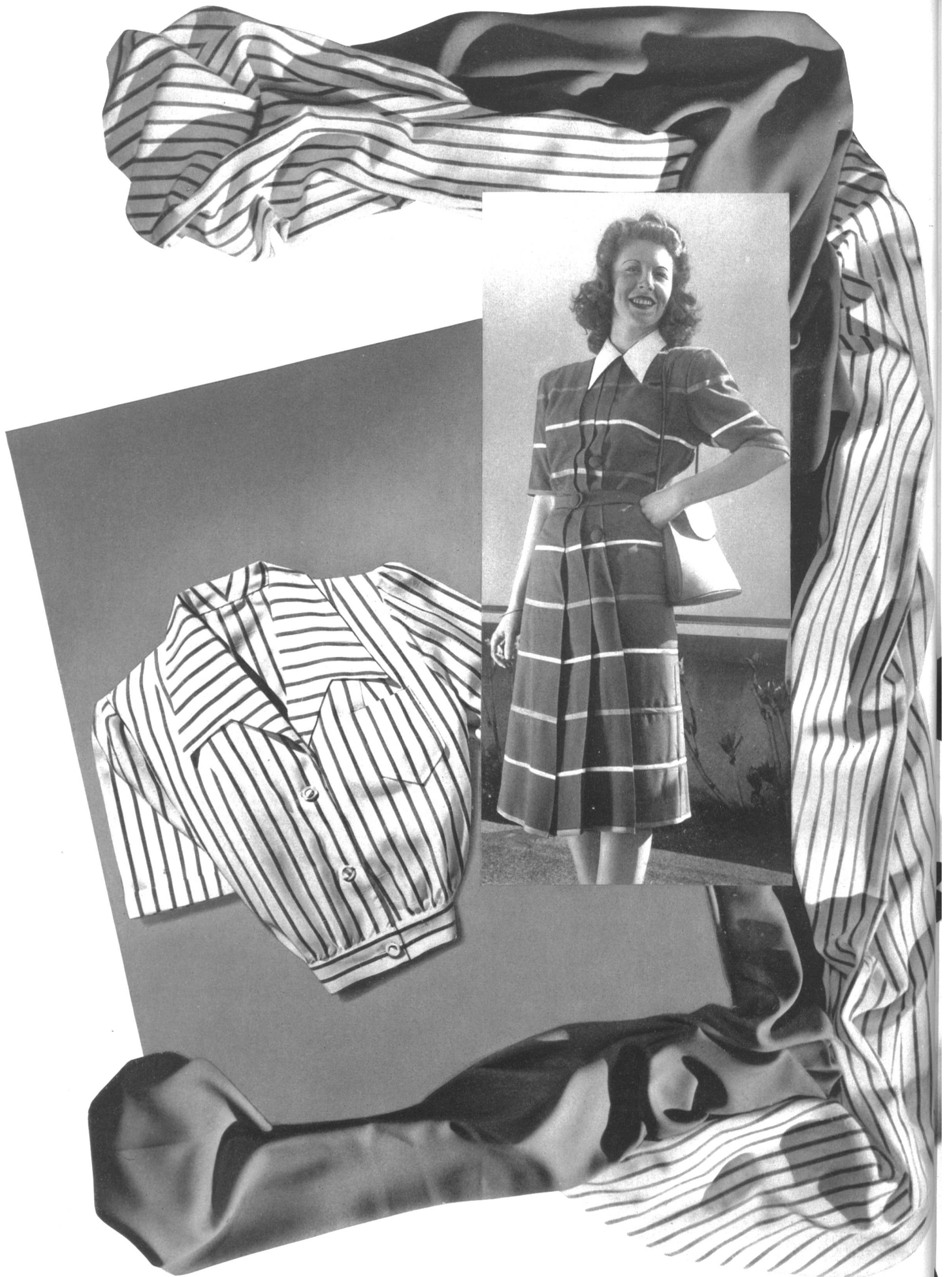
Christian Fischbacher Co., St-Gall Eolienne y Diagonal de fibrana Atelier Honegger-Lavater