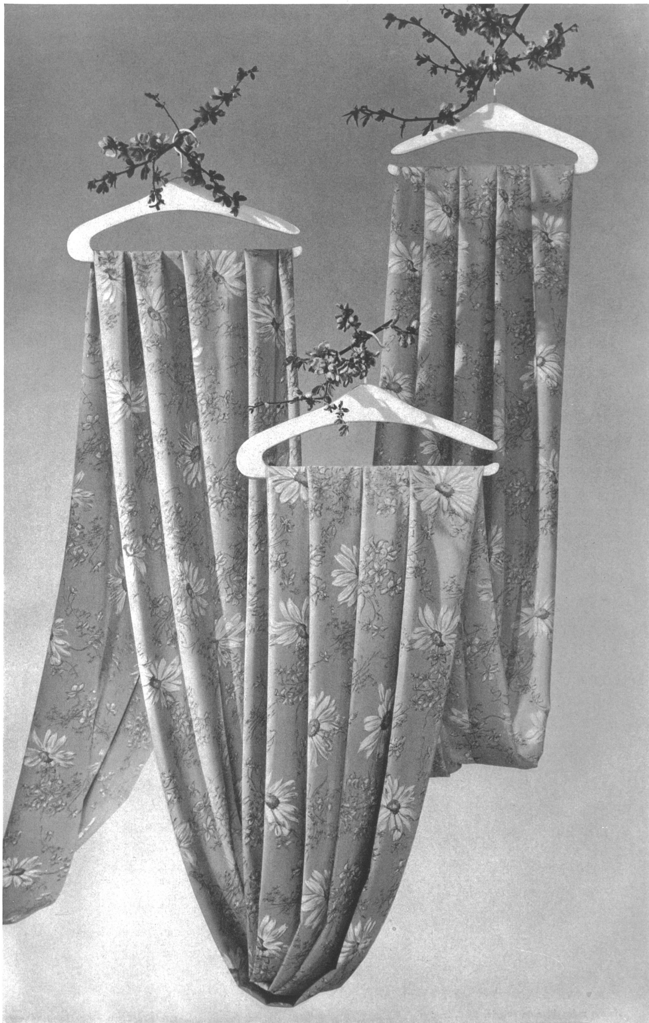
Reichenbach & Cie, St-Gall Colección de novedades estampadas para vestidos de primavera y verano en crepe rayón lavable. Artículo «RECOVILA»