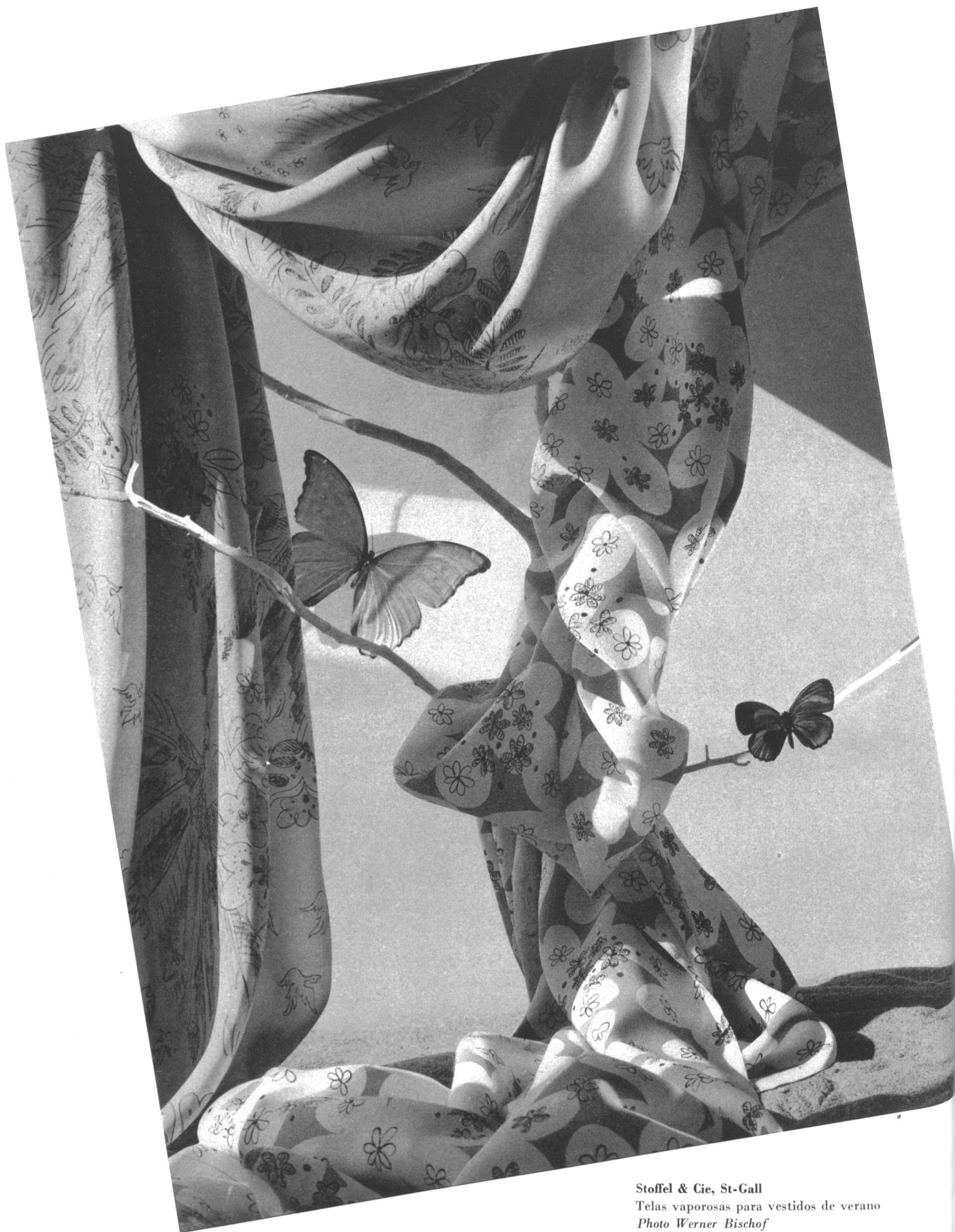
Stoffel & Cie, St-Gall Telas vaporosas para vestidos de verano