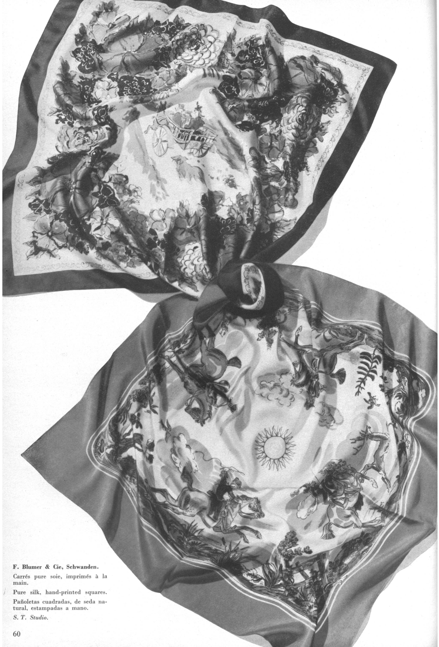
F. Blumer & Cie, Schwanden. Carrés pure soie, imprimés à la main. Pure silk, hand-printed squares. Pañoletas cuadradas, de seda natural, estampadas a mano. S. T. Studio.