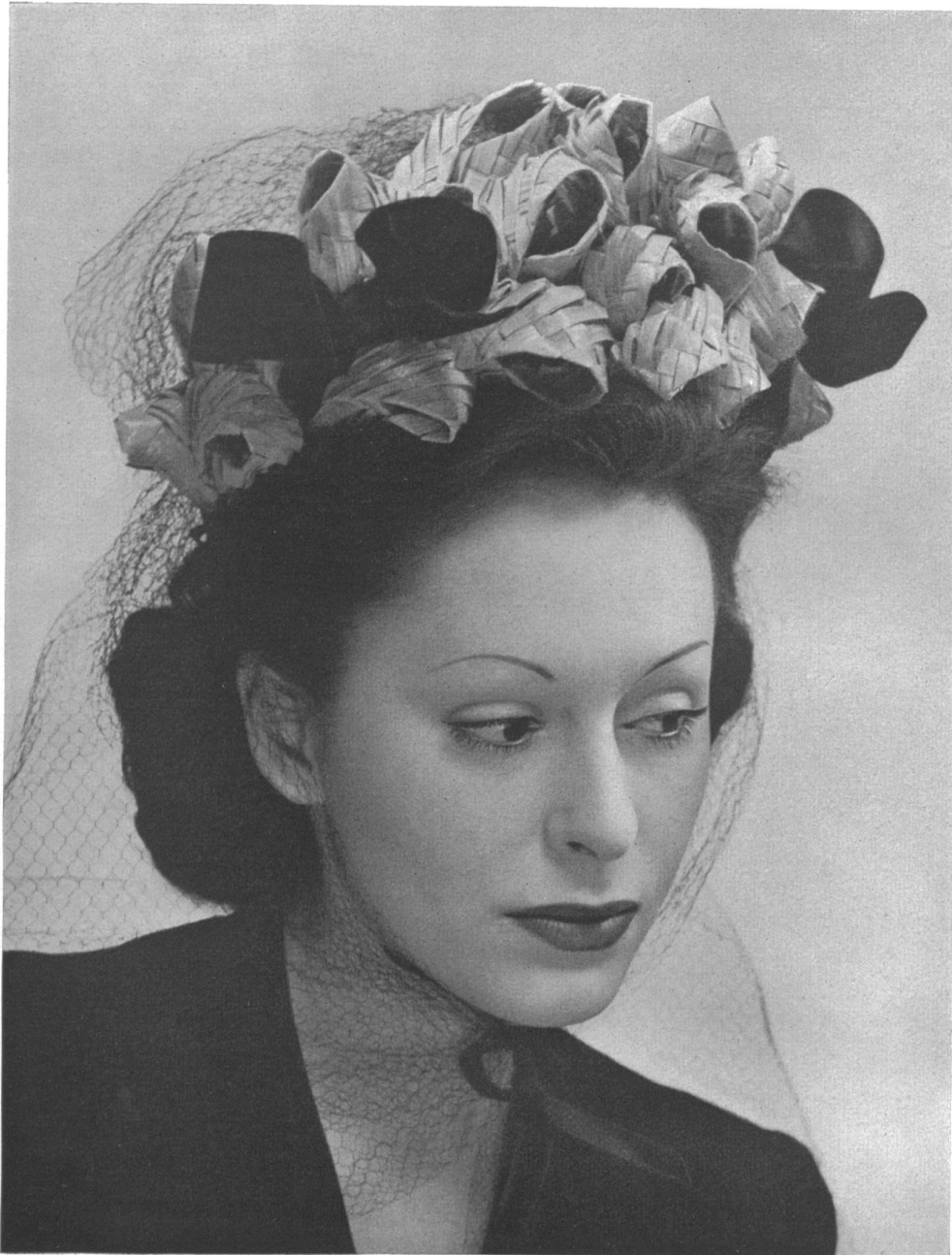
Otto Steinmann & Cie S. A., Wohlen. Trenza No 4680 en « OSCOLINA ». Modelo Muller, Zurich.