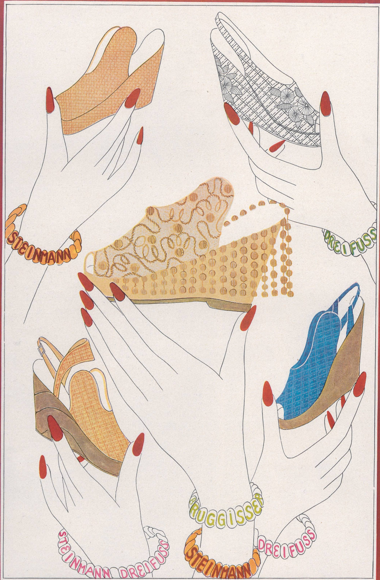
LÉANDRE Pailles de Wohlen