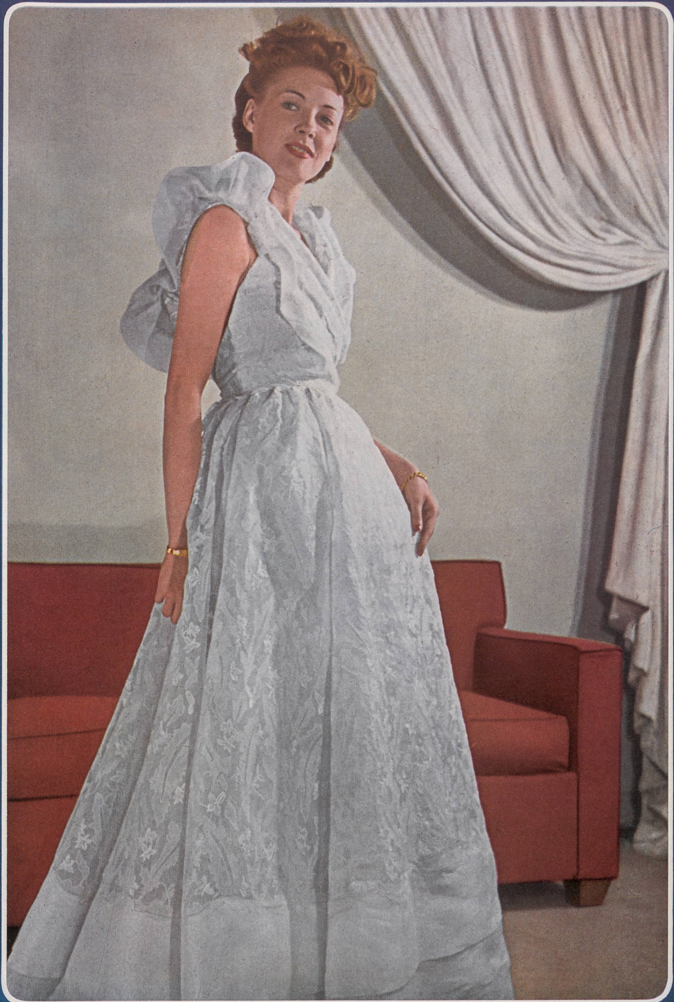
LUCIEN LELONG Union S.A., St-Gall