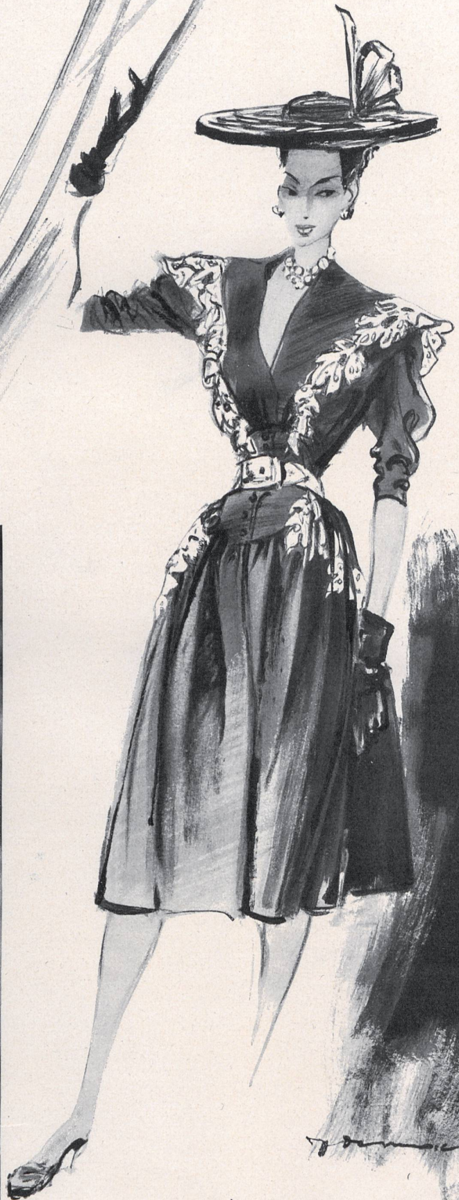
AGNÈS DRECOLL Aug. Giger & C ie , St-Gall Stoffel & C ie , St-Gall