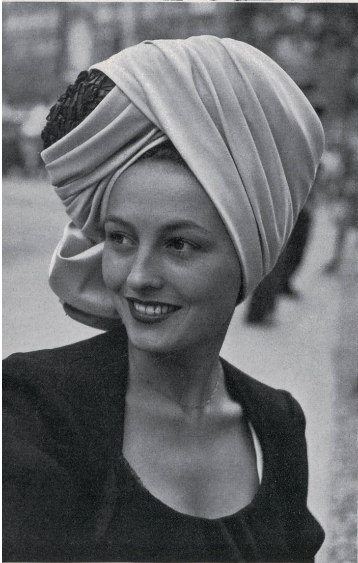
PAULETTE M. Bruggisser & C ie S.A., Wohlen