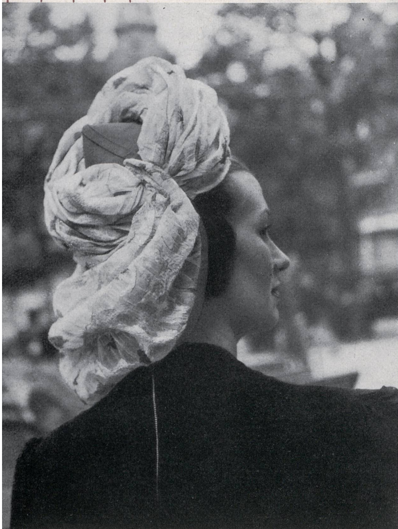
MADAME SUZY Heberlein & C ie S. A., Wattwil