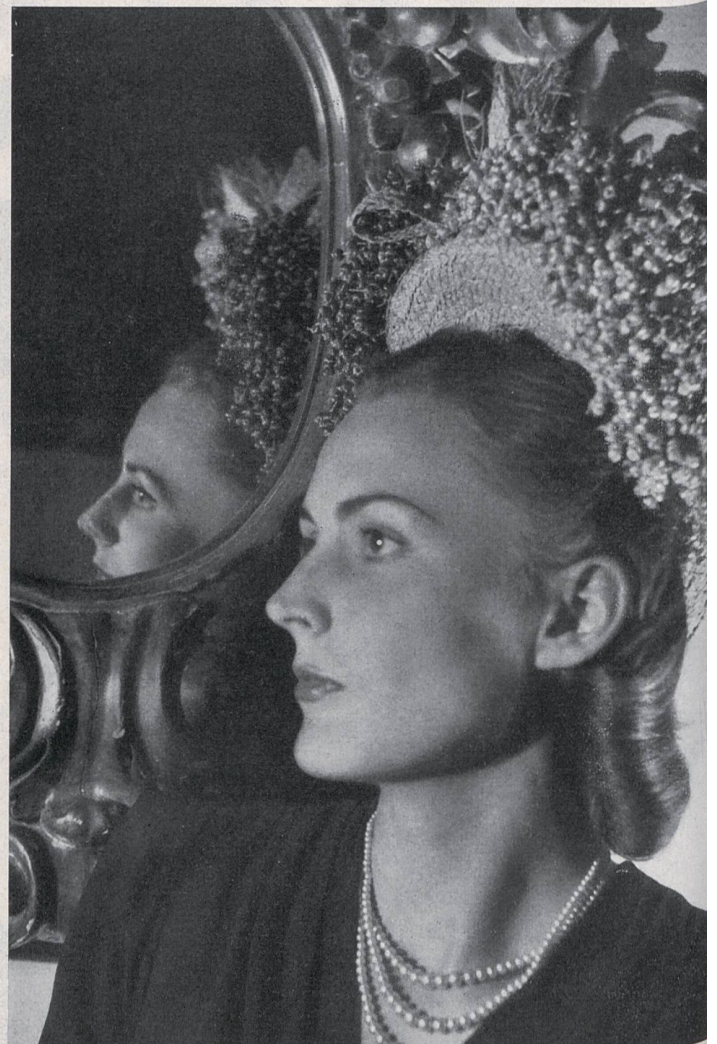
LEGROUX SŒURS M. Bruggisser & C ie S. A., Wohlen