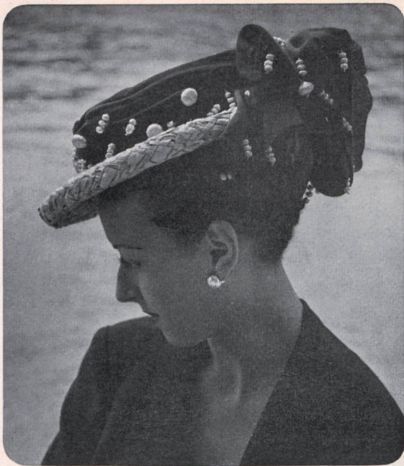
BALENCIAGA. Bruggisser — Vischer