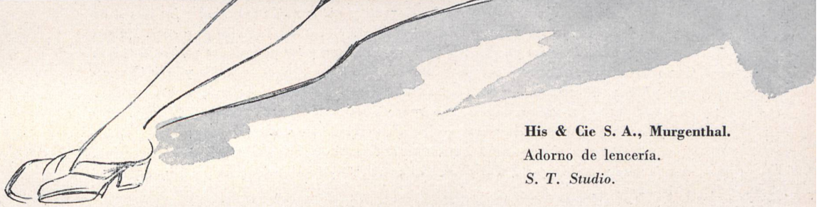
His & Cie S. A., Murgenthal. Adorno de lencería.