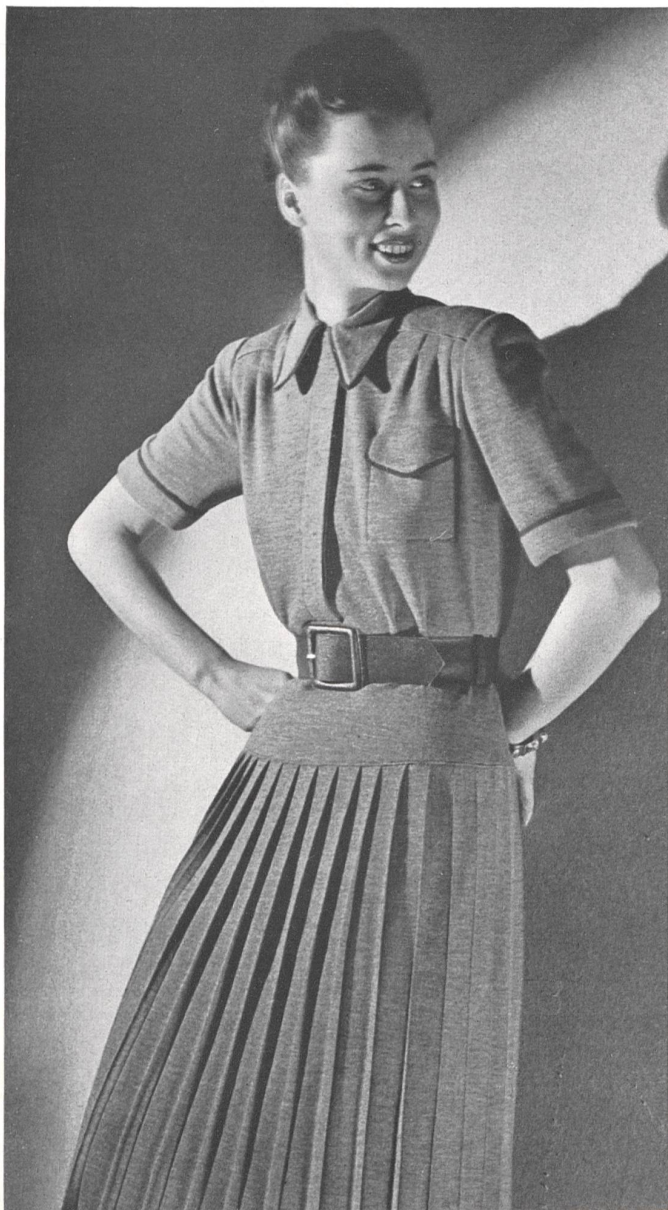
Vestido de lana de aspecto joven