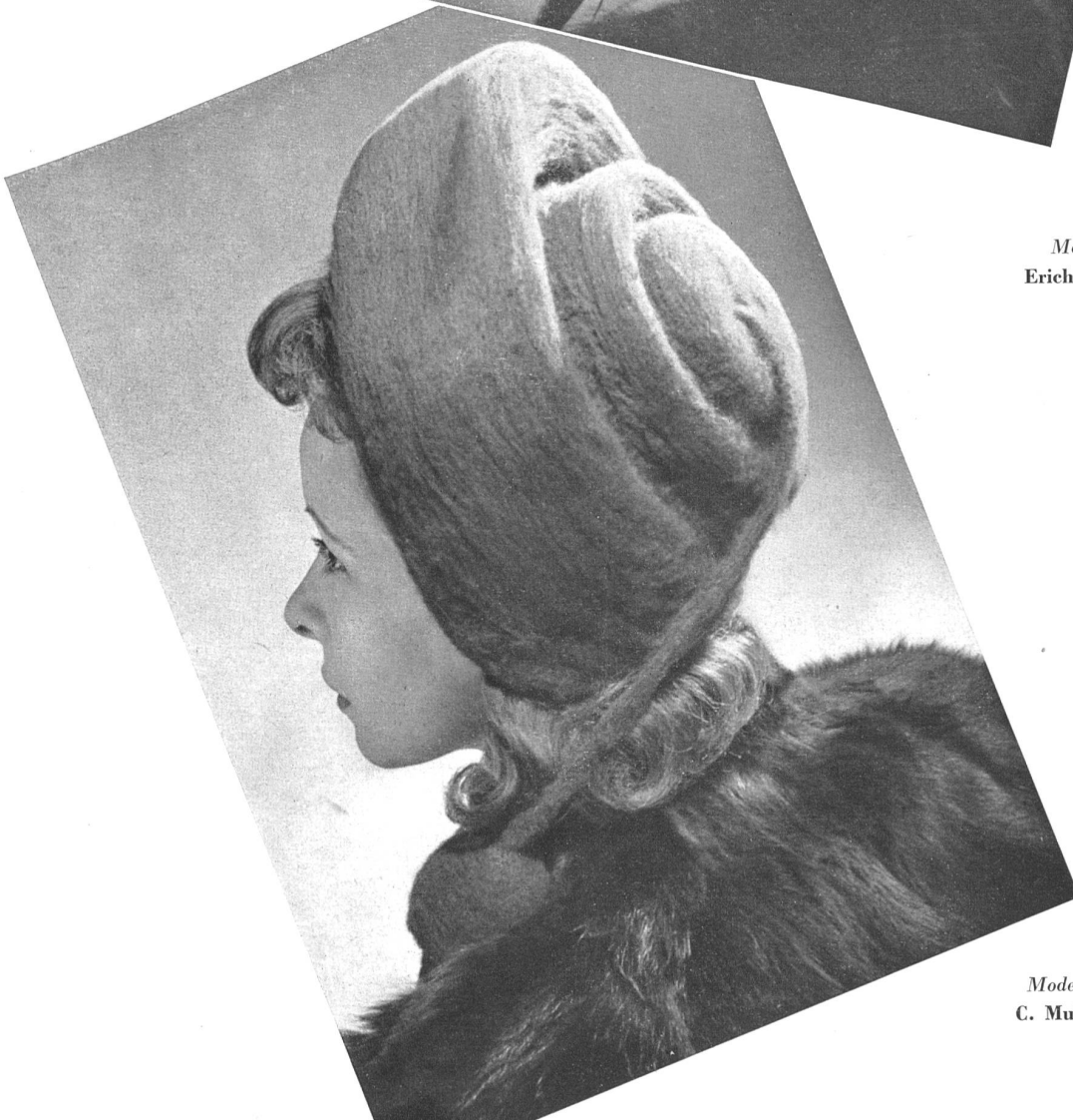
Modelo Modelo C. Muller S.A., Zurich.