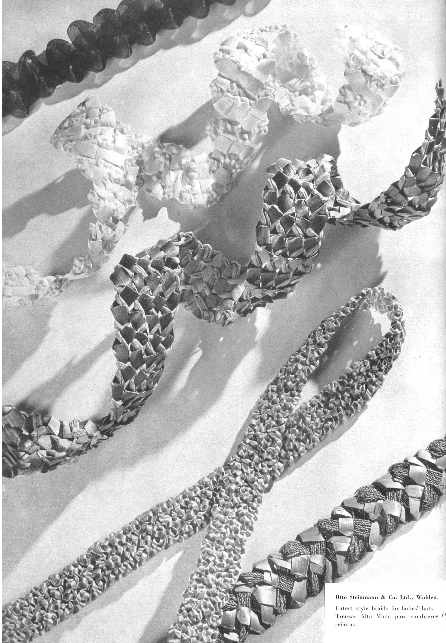
Otto Steinmann & Co. Ltd., Wohlen. Latest style braids for ladies' hats. Trenzas Alta Moda para sombreros de señoras.