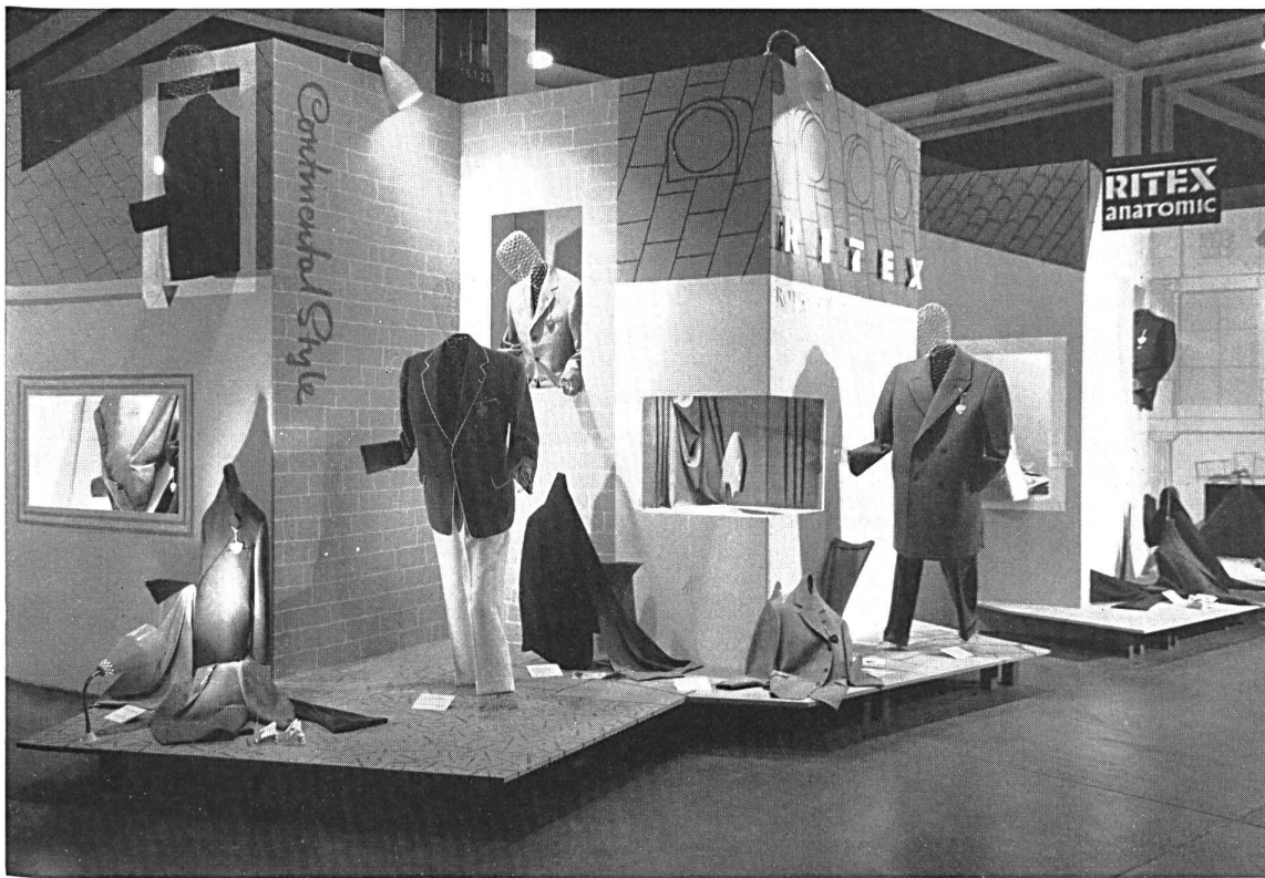
Le stand de la maison : Der Stand der Firma :