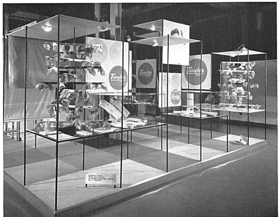
Le stand de la maison : Der Stand der Firma :

Seiten 89 (unten) und 90 : Einige Aspekte der Ausstellung verschiedener Branchen der Bekleidungsindustrien im Salon « Madame - Monsieur ».