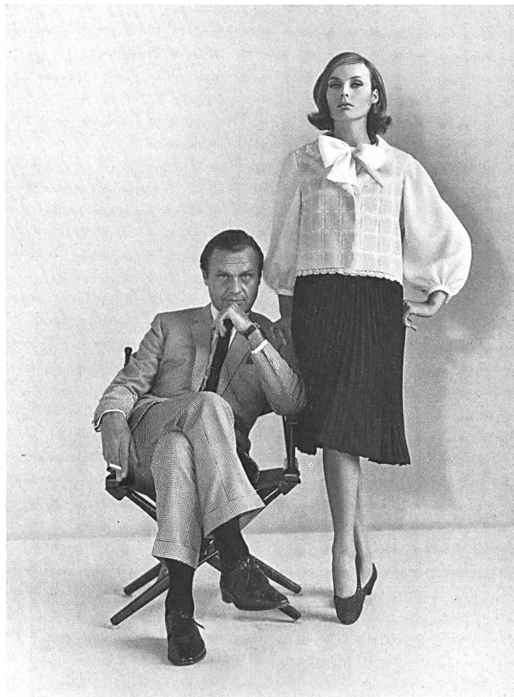
Swiss Fabric and Embroidery Center, New York