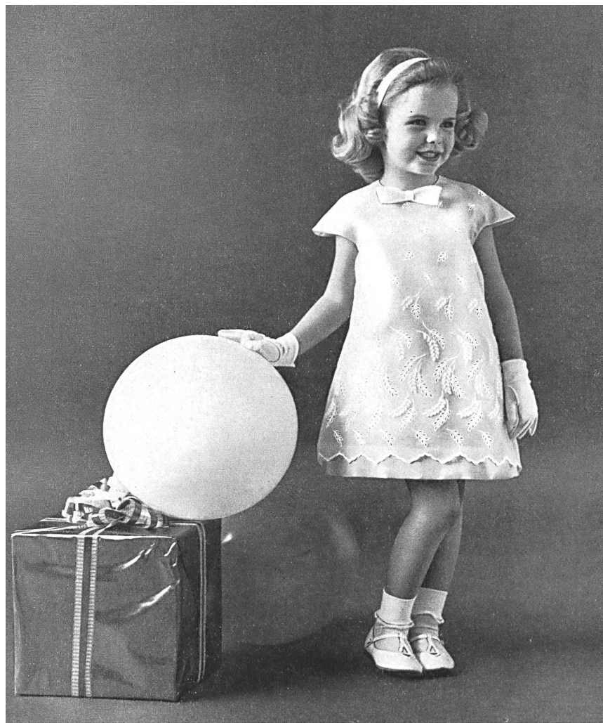
« NELO », J. G. NEF & CO. S.A., HÉRISAU Organdi blanc brodé White embroidered organdie Modèle de Youngland