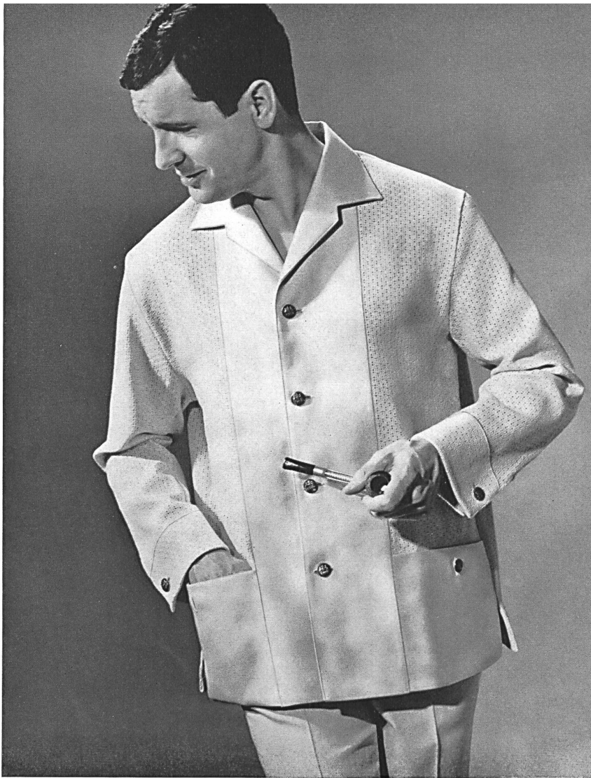
« LUTTEURS », LES FILS FEHLMANN S.A., SCHÖFTLAND Frais ensemble d'été en coton combiné avec tissu poreux Cool summer suit in cotton combined with porous fabric Conjunto fresco para verano, de algodón combinado con tejido poroso Kühles Baumwoll-Sommer-Ensemble mit porösem Gewebe