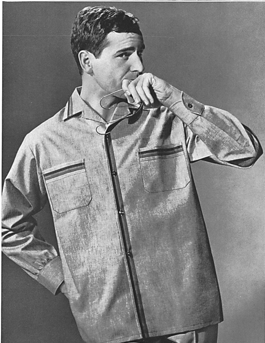
« LUTTEURS », LES FILS FEHLMANN S. A., SCHÖFTLAND Chemise-veste de coton pour les jours chauds, avec amusante garniture de couleur Loose cotton shirt for hot summer days with attractive edging Camisa chaqueta de algodón para los días calurosos, con divertido adorno en color Baumwollene Chemisette für heisse Tage mit amüsanten Bordüren-Garnitur