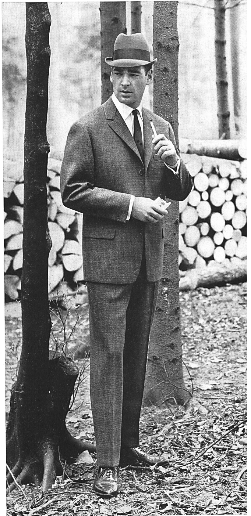
Costume droit en peigné de laine, brun forestier Fashionable single breasted worsted suit in « brun forestier » colour Vestido de moda de estambre de lana en color « brun forestier » Modischer Einreier aus reinem Kammgarn, in « brun forestier » Farbe