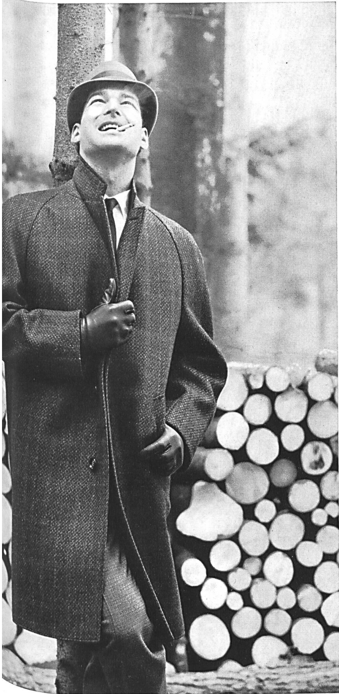
« PKZ », BURGER-KEHL & CO. AG., ZURICH Pardessus d'hiver mode, brun forestier, en laine et alpaga Fashionable forest brown winter coat in wool and alpaca Abrigo de moda para invierno en lana y alpaca, de color « brun forestier » Modischer Wintermantel aus Wolle und Alpaka, in « brun forestier » Farbe