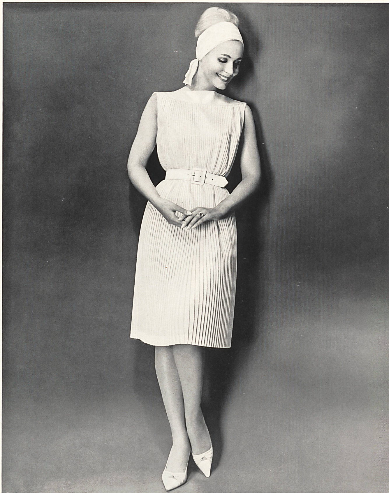
Elegantes Plissé-Kleid aus «Stoffels» Terylene

Nous présentons notre collection à l'Hôtel Central, à Zurich Tél. (051) 32 68 20