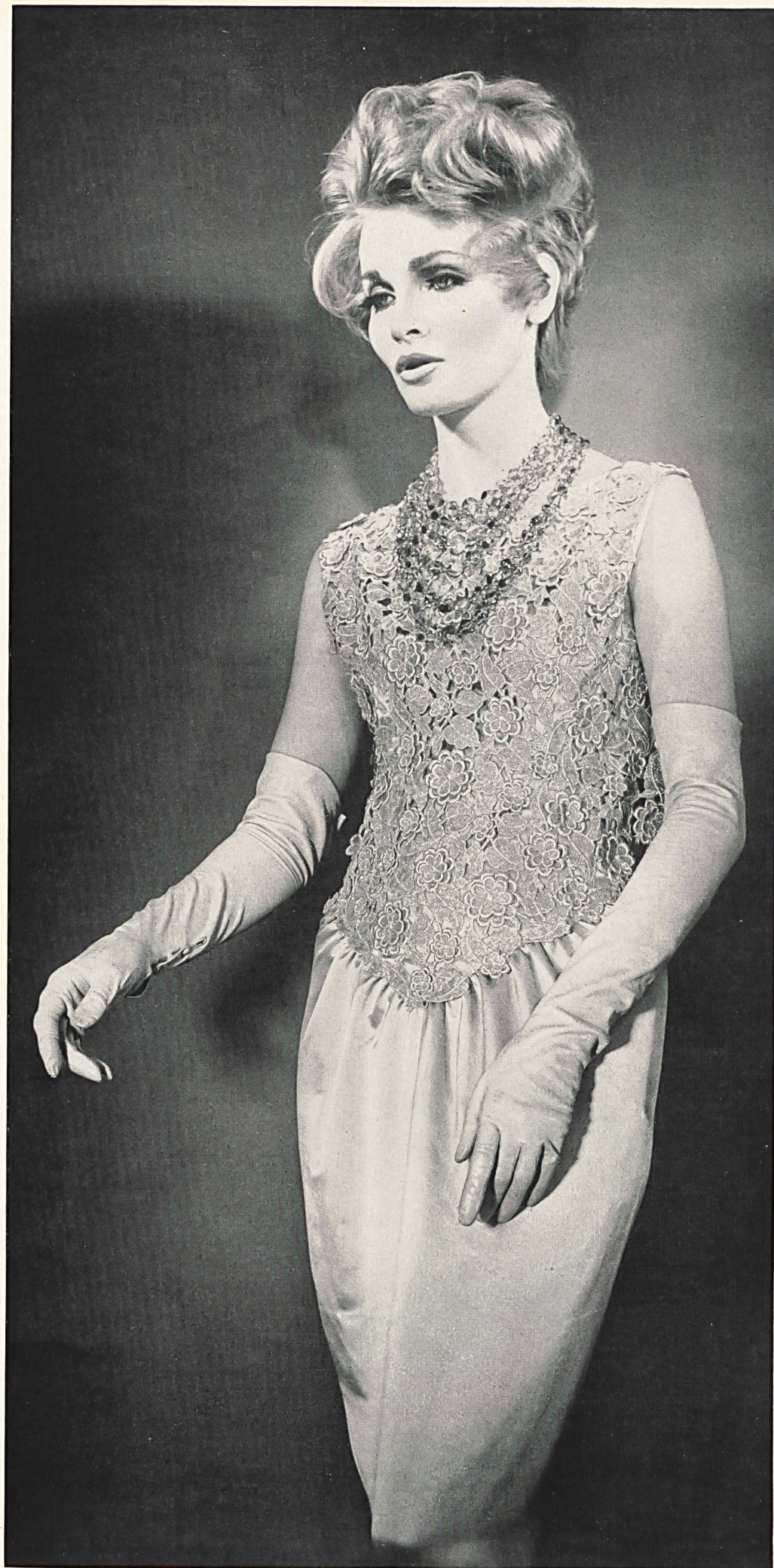
PIERRE CARDIN Organdi de soie brodé métal de Forster Willi & Co., Saint-Gall Grossiste à Paris: Robert Burg & Cie