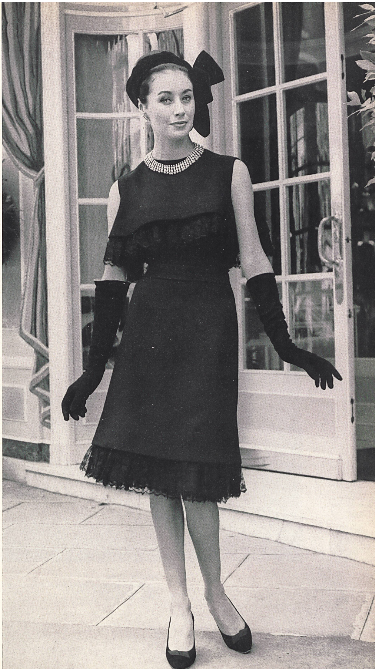
CHRISTIAN DIOR Crêpe de soie de la S.A. Stünzi Fils, Horgen