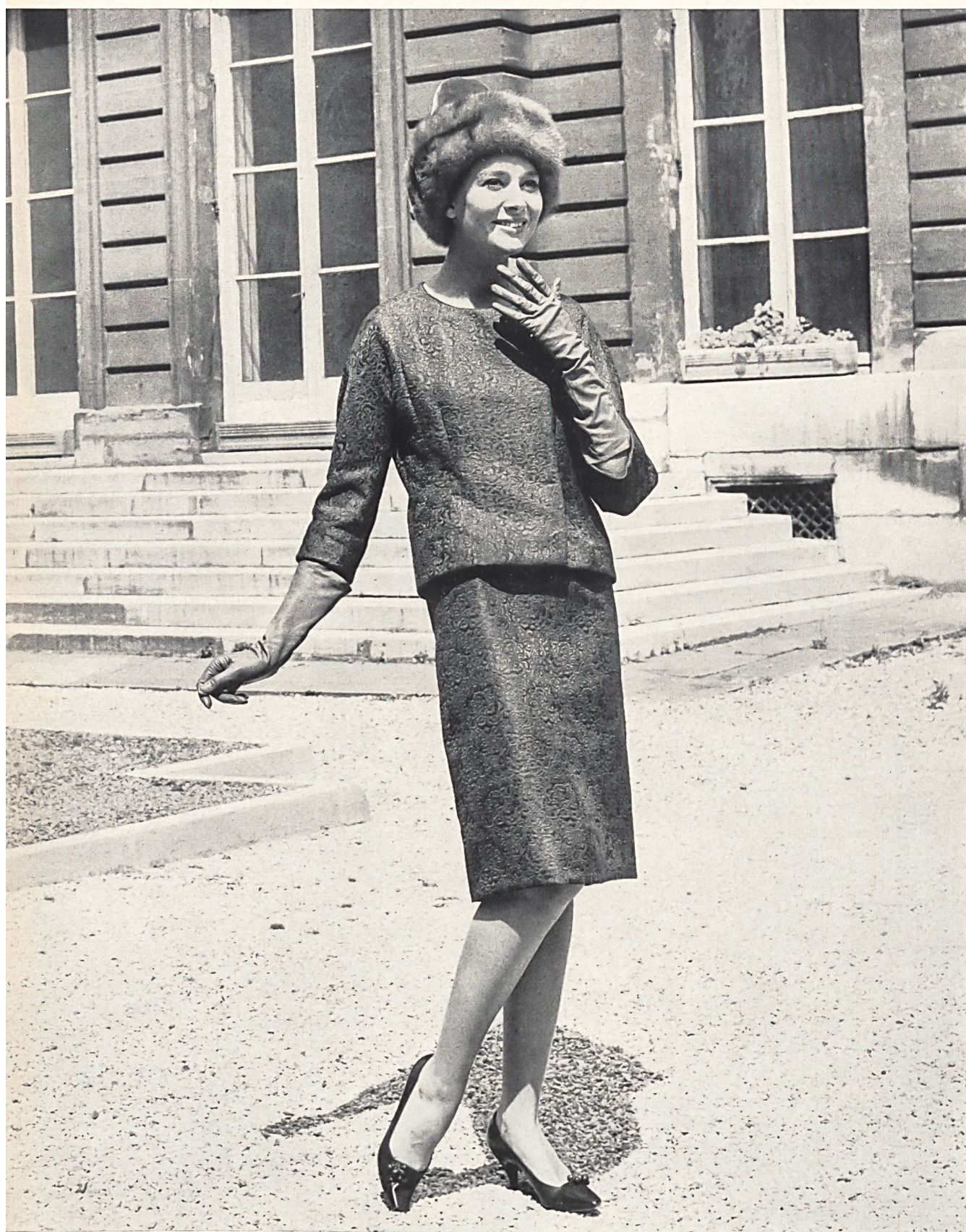
PIERRE CARDIN Matelassé pure soie de Robt. Schwarzenbach & Co., Thalwil