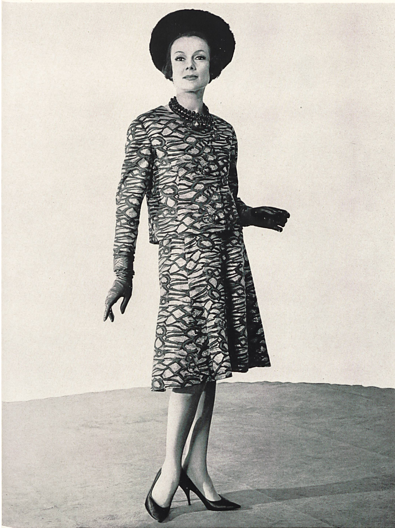
NINA RICCI Jacquard métal Nouveauté de Rudolf Brauchbar & Cie S. A., Zurich Distribué par Montex, Paris