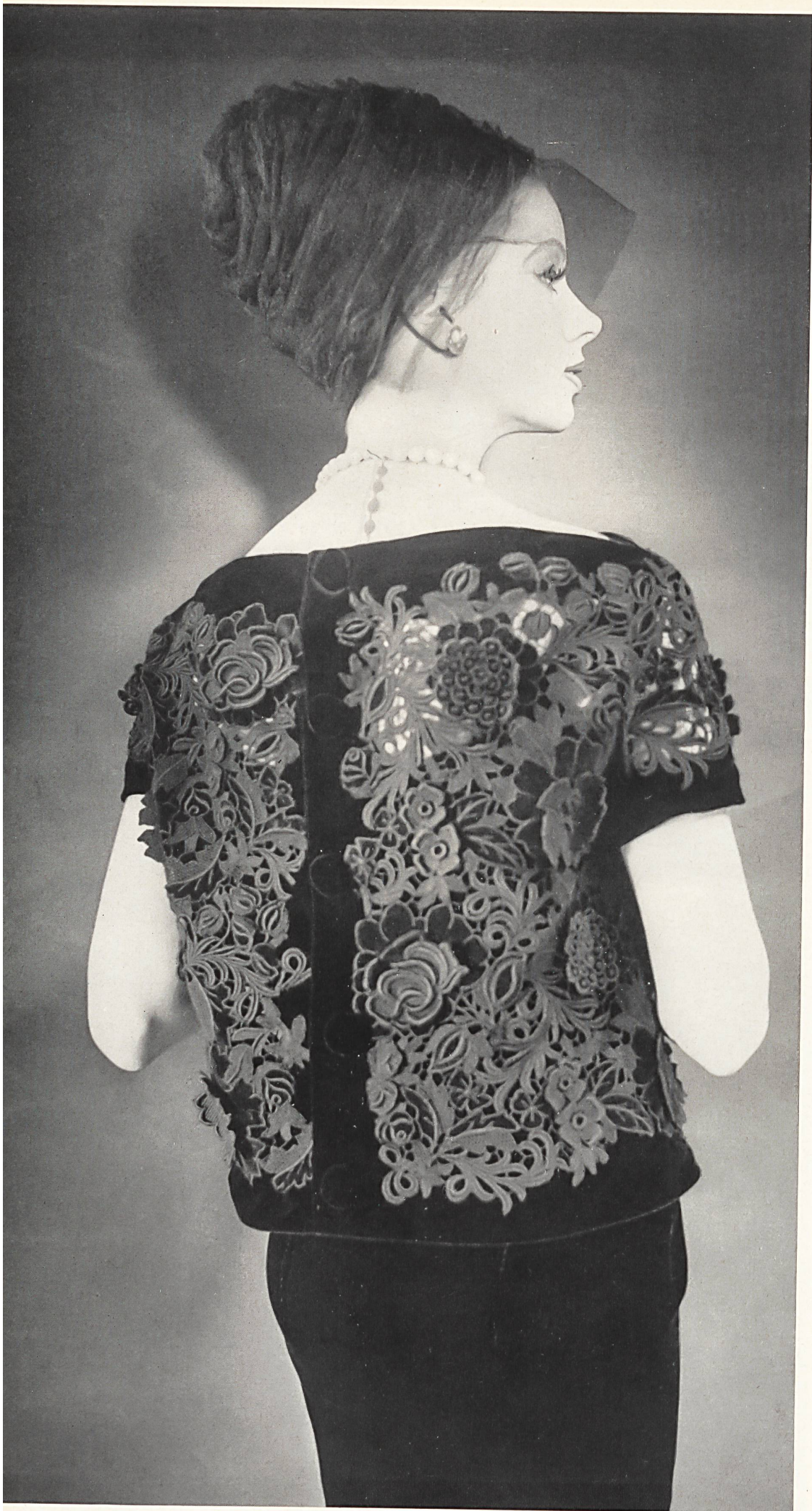
PIERRE BALMAIN Dentelle de guipure et velours de Forster Willi & Co., Saint-Gall Grossiste à Paris: Robert Burg & Cie