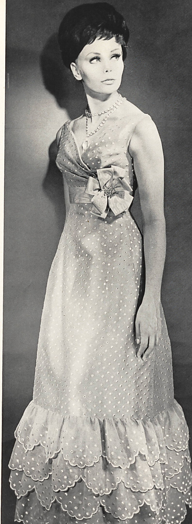
JEAN PATOU Broderie lamé argent sur organdi de soie de Union S.A. Saint-Gall Grossiste à Paris: Robert Burg & Cie