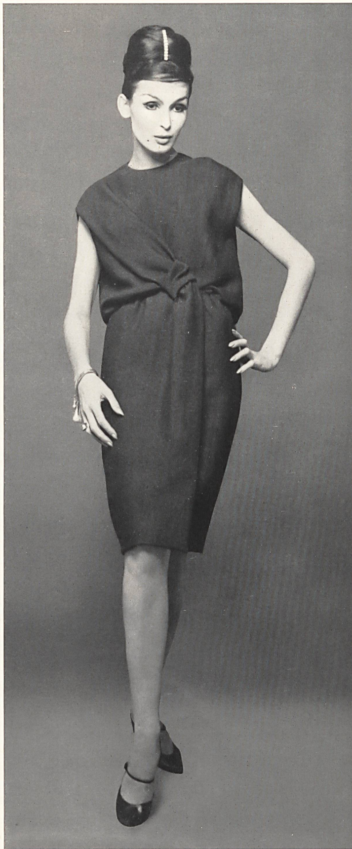
LANVIN CASTILLO Tissu «Alzora» (laine/fibranne/nylon) de Heer & Cie S.A., Thalwil Grossiste à Paris: Robert Burg & Cie