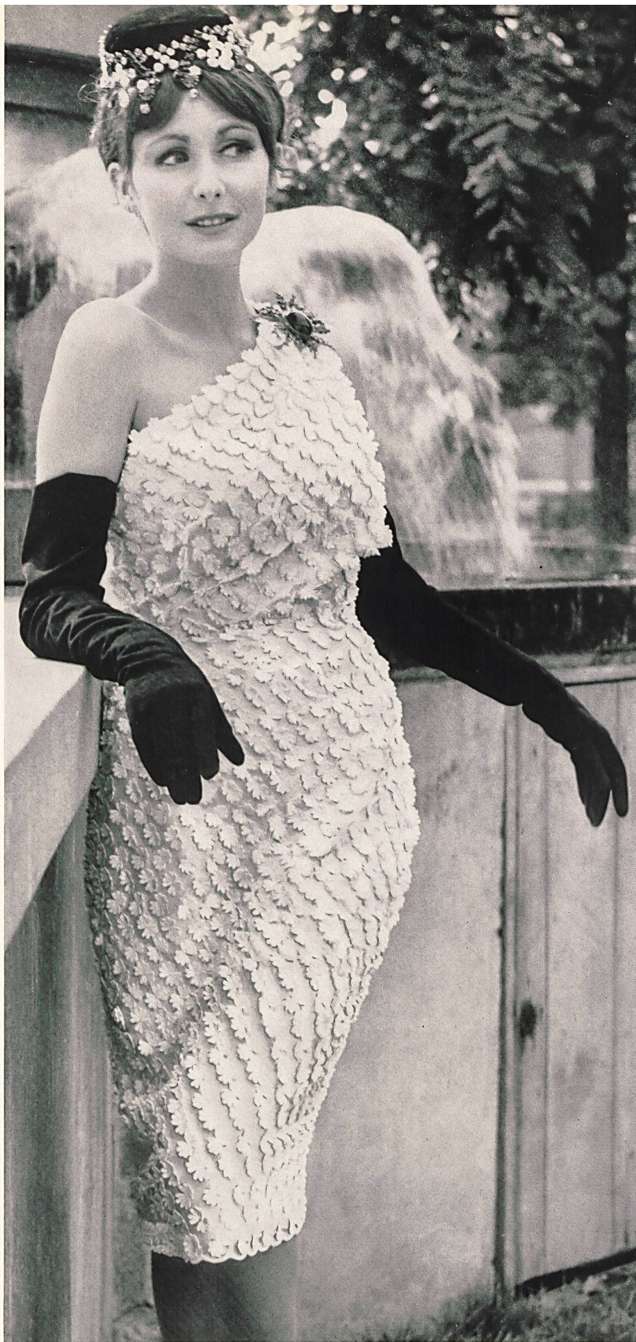
BERNARD SAGARDOY Chiffon de soie pure avec broderie détachée de Forster Willi & Co., Saint-Gall Grossiste à Paris: Robert Burg & Cie