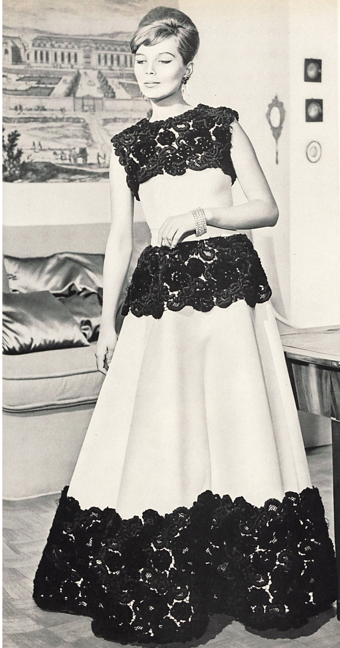
CHRISTIAN DIOR Guipure rebrodée de Union S.A., Saint-Gall