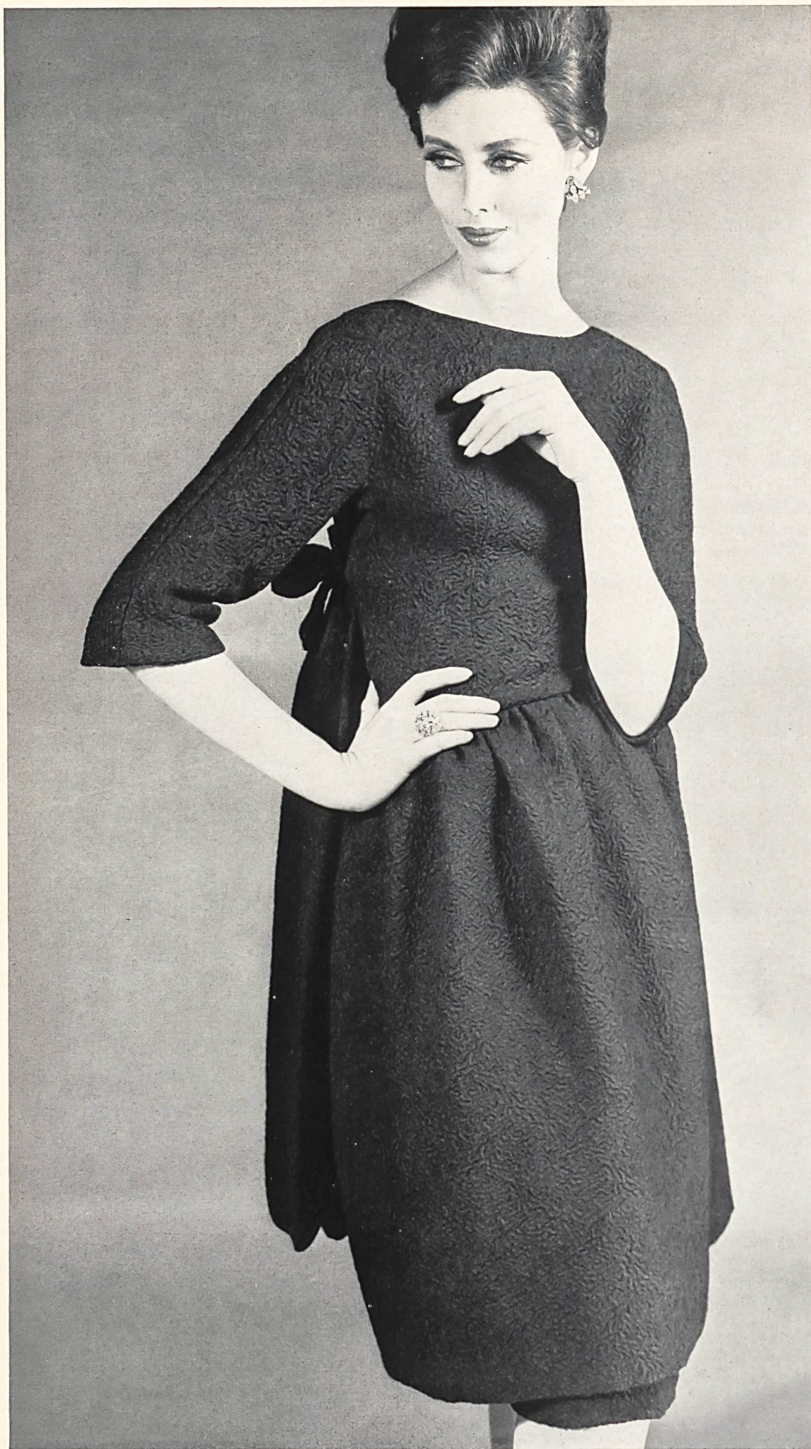
JEAN PATOU « Cario » tout soie de L. Abraham & Cie, Soieries S.A., Zurich