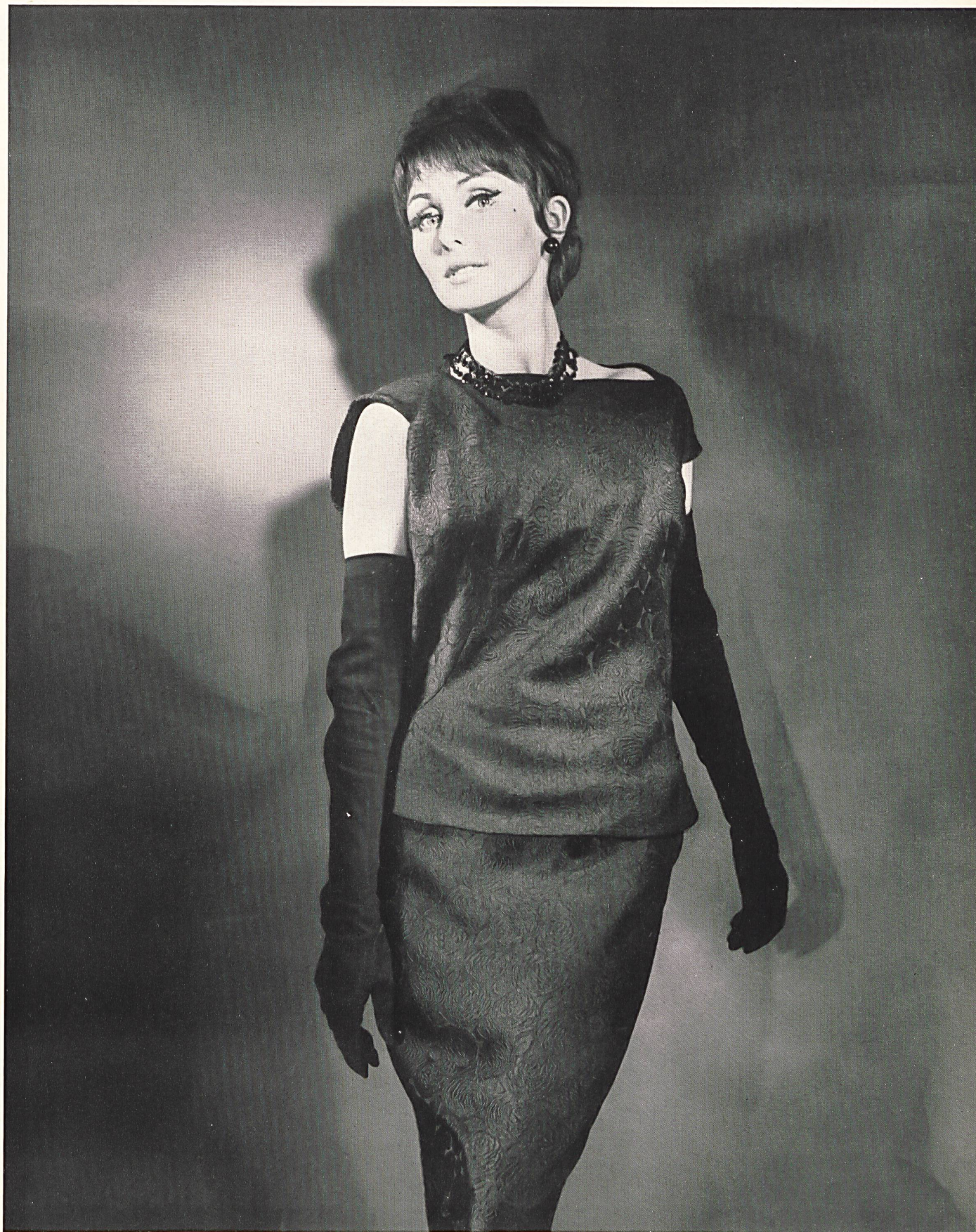
CARVEN Crêpe façonné tout soie des Soieries Stehli S.A., Zurich