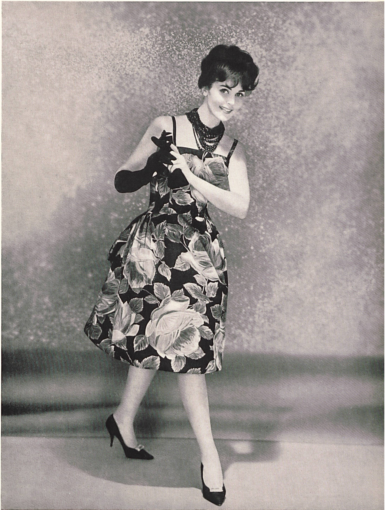
METTLER & CO. S. A., SAINT-GALL Satin de coton Everglaze Minicare (cotton satin — satén de algodón — Baumwollsatin) Modèle El-El S. A., Zurich (Joseph Bancroft & Sons Co. A.G., Zurich)