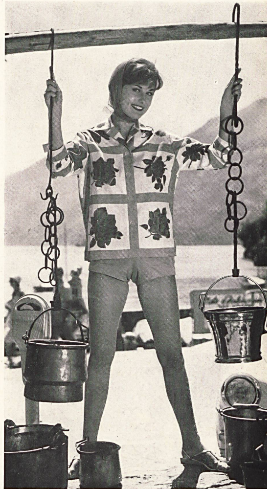
Ensemble de plage en coton ; short uni ou imprimé Cotton beach outfit with plain or printed short Conjunto de playa de algodón con short liso o estampado Ensemble aus Baumwolle ; short uni oder buntbedruckt