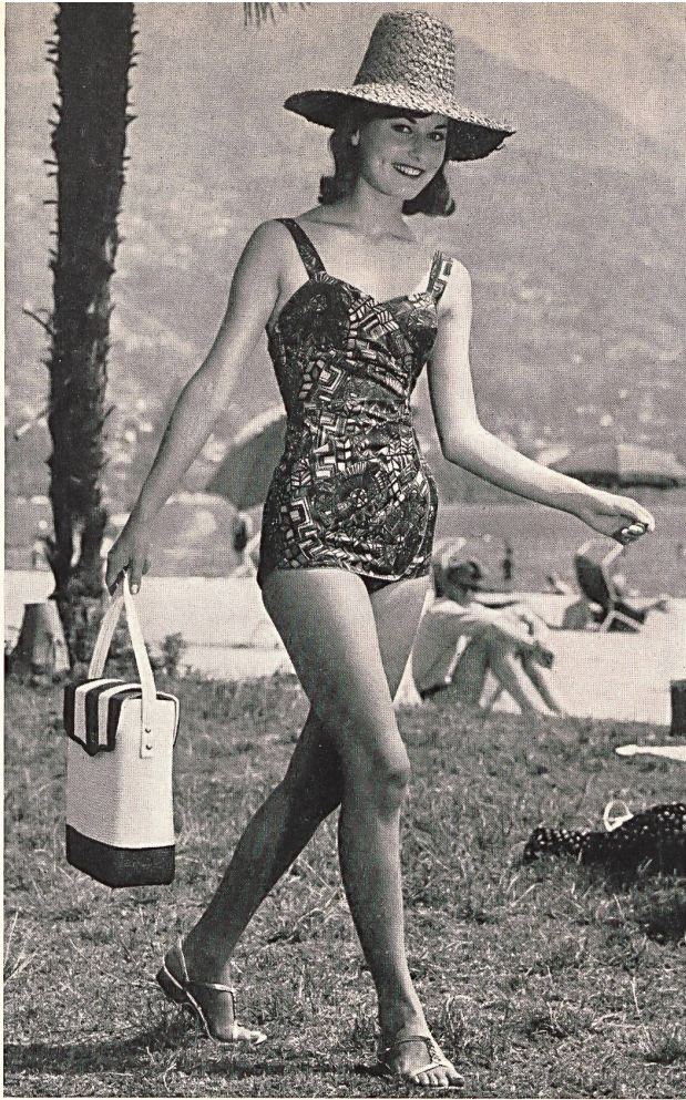
Maillot de bain juvénile, élégamment drapé, en coton imprimé Smartly draped youthful printed cotton swimsuit Bañador juvenil en tejido de algodón estampado con elegante efecto drapeado Jugendlicher Badeanzug aus buntbedruckten Baumwollstoff mit eleganter Drapierung