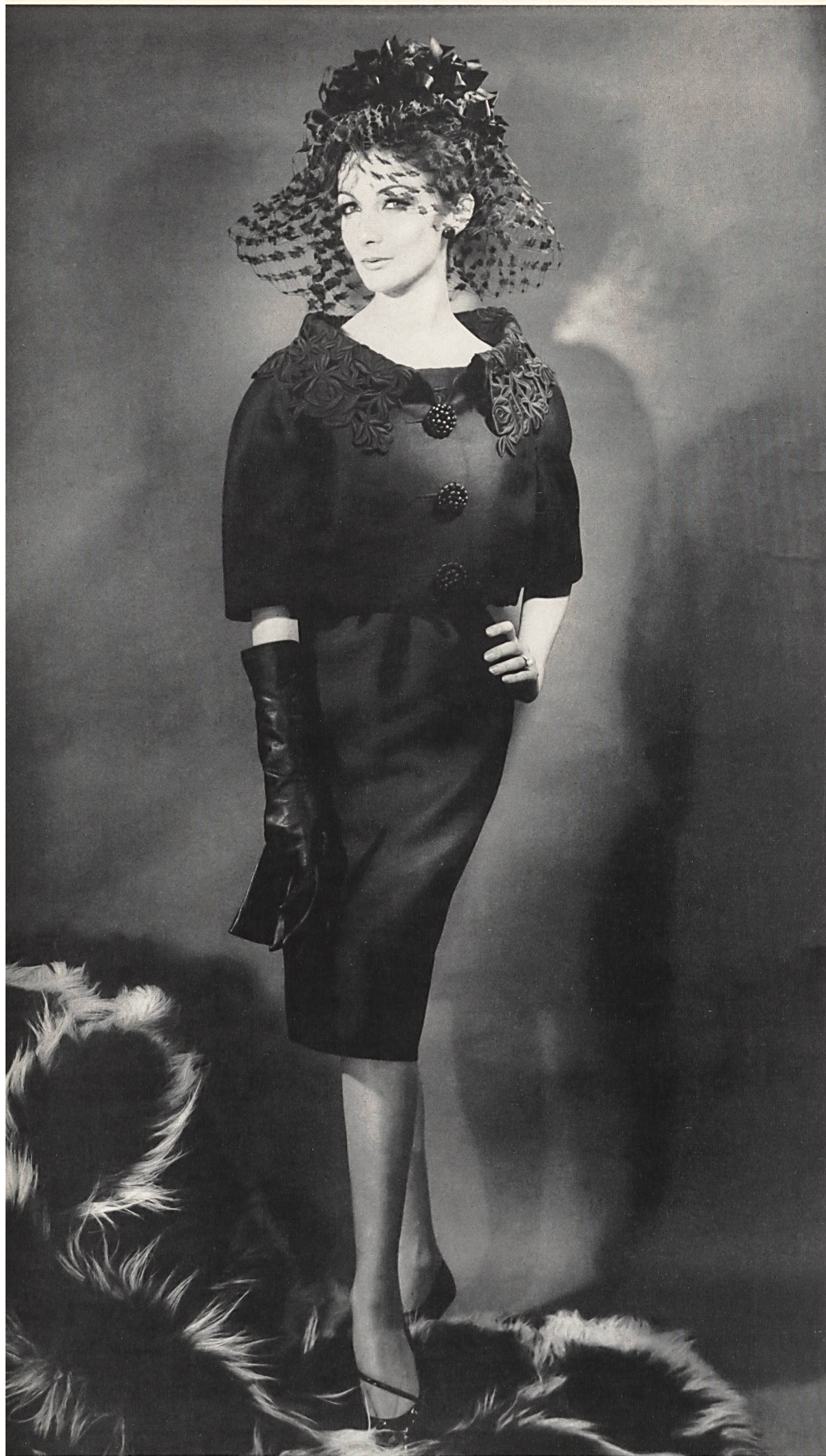
BERNARD SAGARDOY Broderie noire découpée de Union S. A., Saint-Gall Grossiste à Paris: Robert Burg & Cie