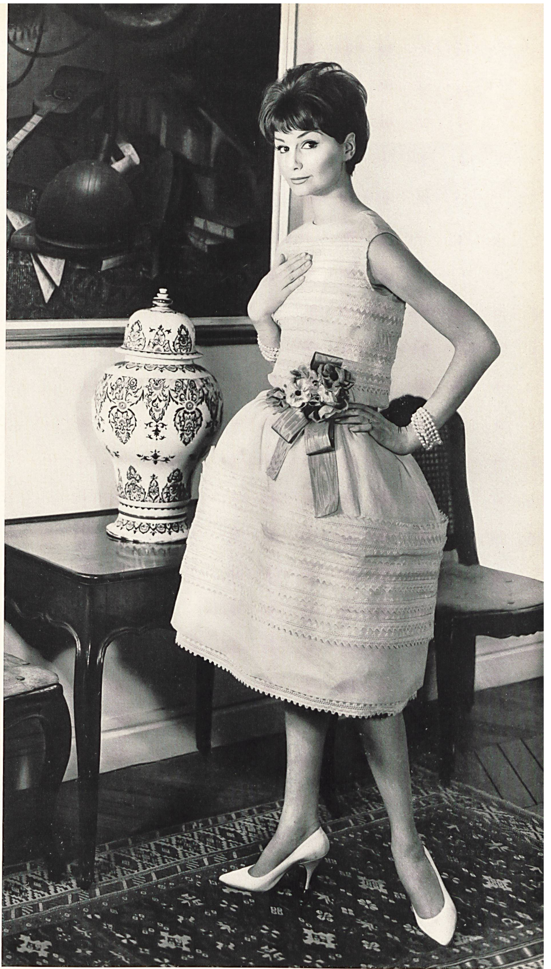
CHRISTIAN DIOR Organdi brodé de Forster Willi & Co., Saint-Gall