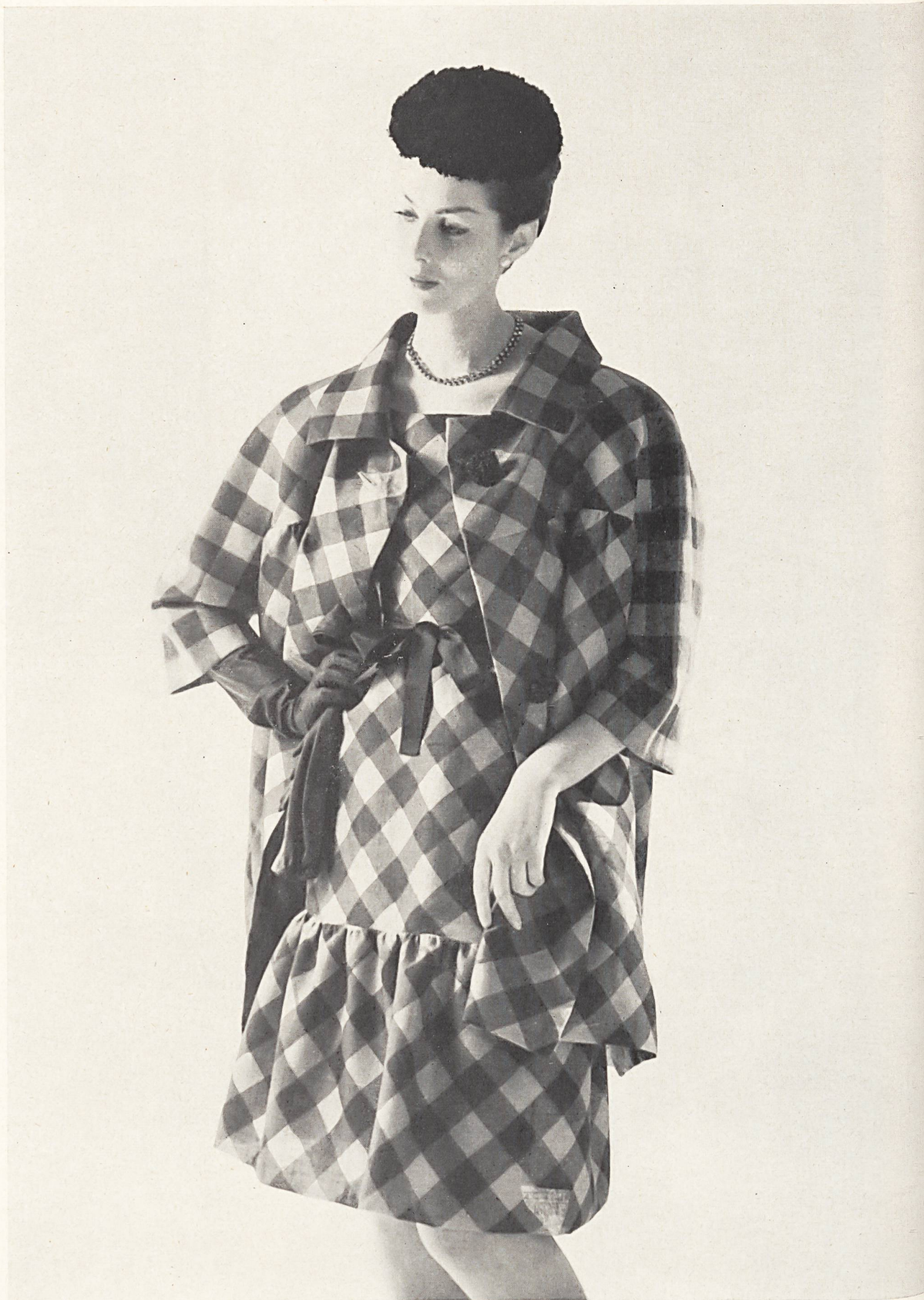
HUBERT DE GIVENCHY