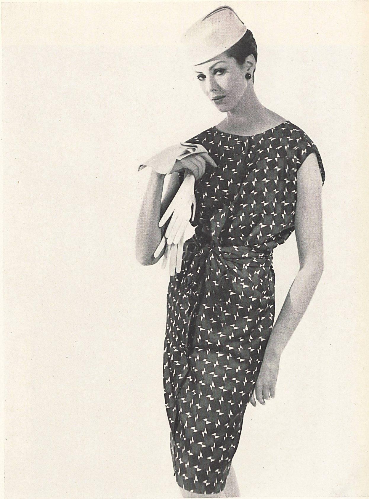
HUBERT DE GIVENCHY