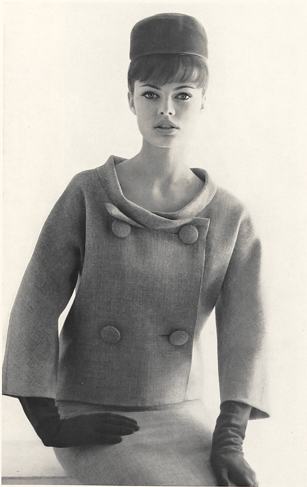
PIERRE CARDIN « Shetty fashion fil » des Tissages de soieries Naef Frères S. A., Zurich