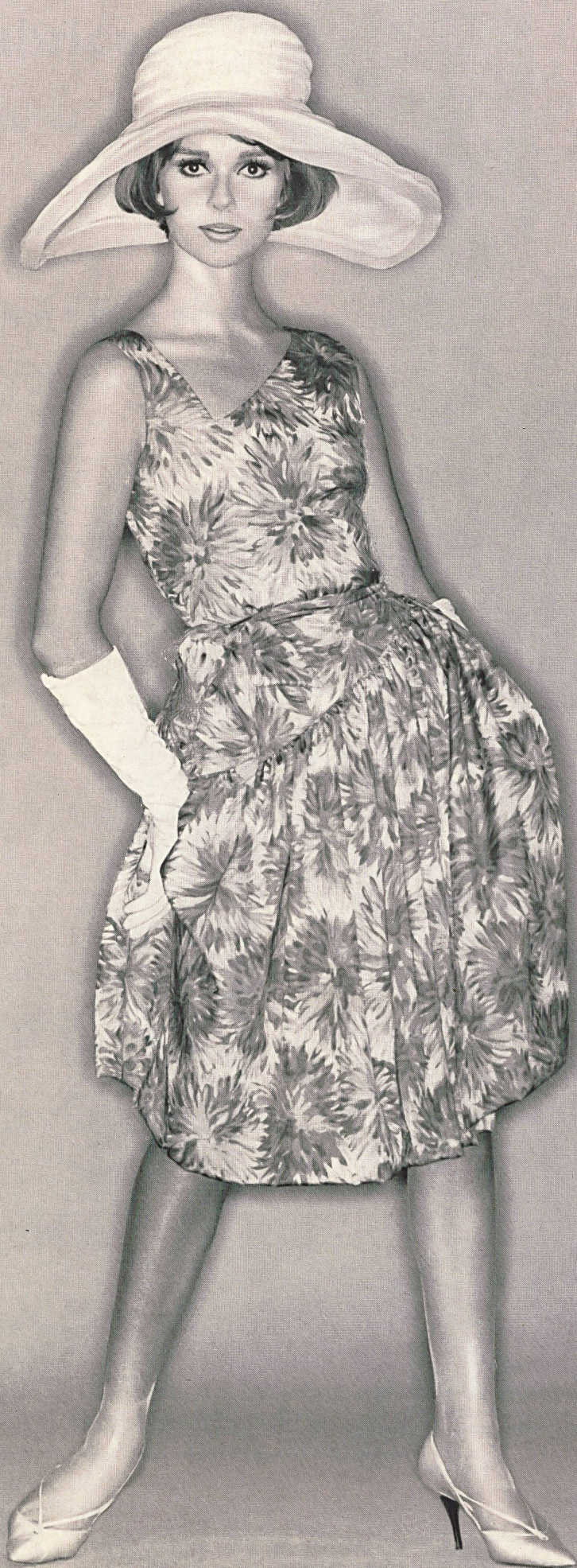
MAGGY ROUFF Tissu pure soie « Manina » de Robt. Schwarzenbach & Co., Thalwil