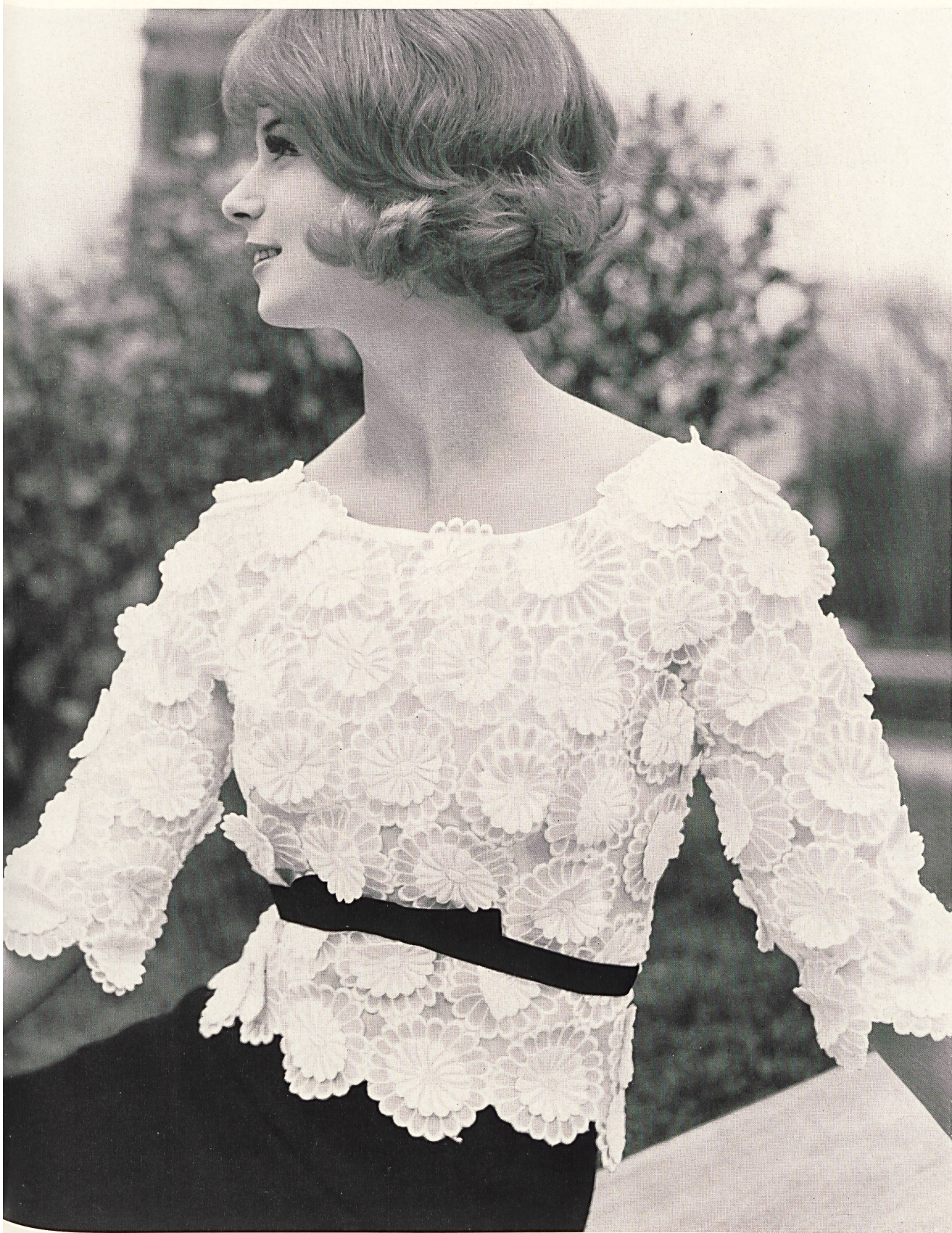
JACQUES HEIM Broderie «Nelo» appliquée sur organdi de J. G. Nef & Co. S. A., Hérissau