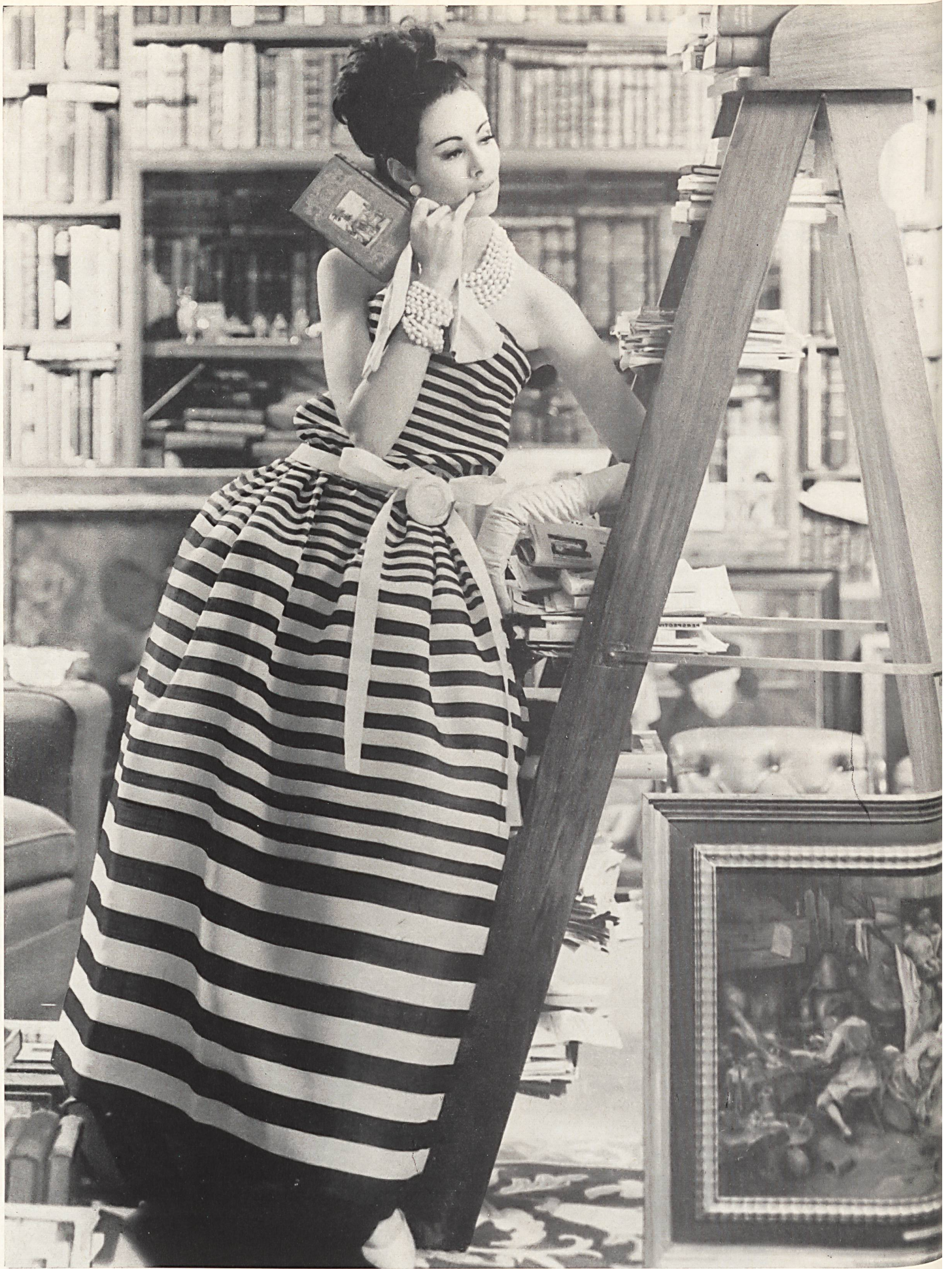
CHRISTIAN DIOR «Gazar» rayé de L. Abraham & Cie, Soieries S. A., Zurich