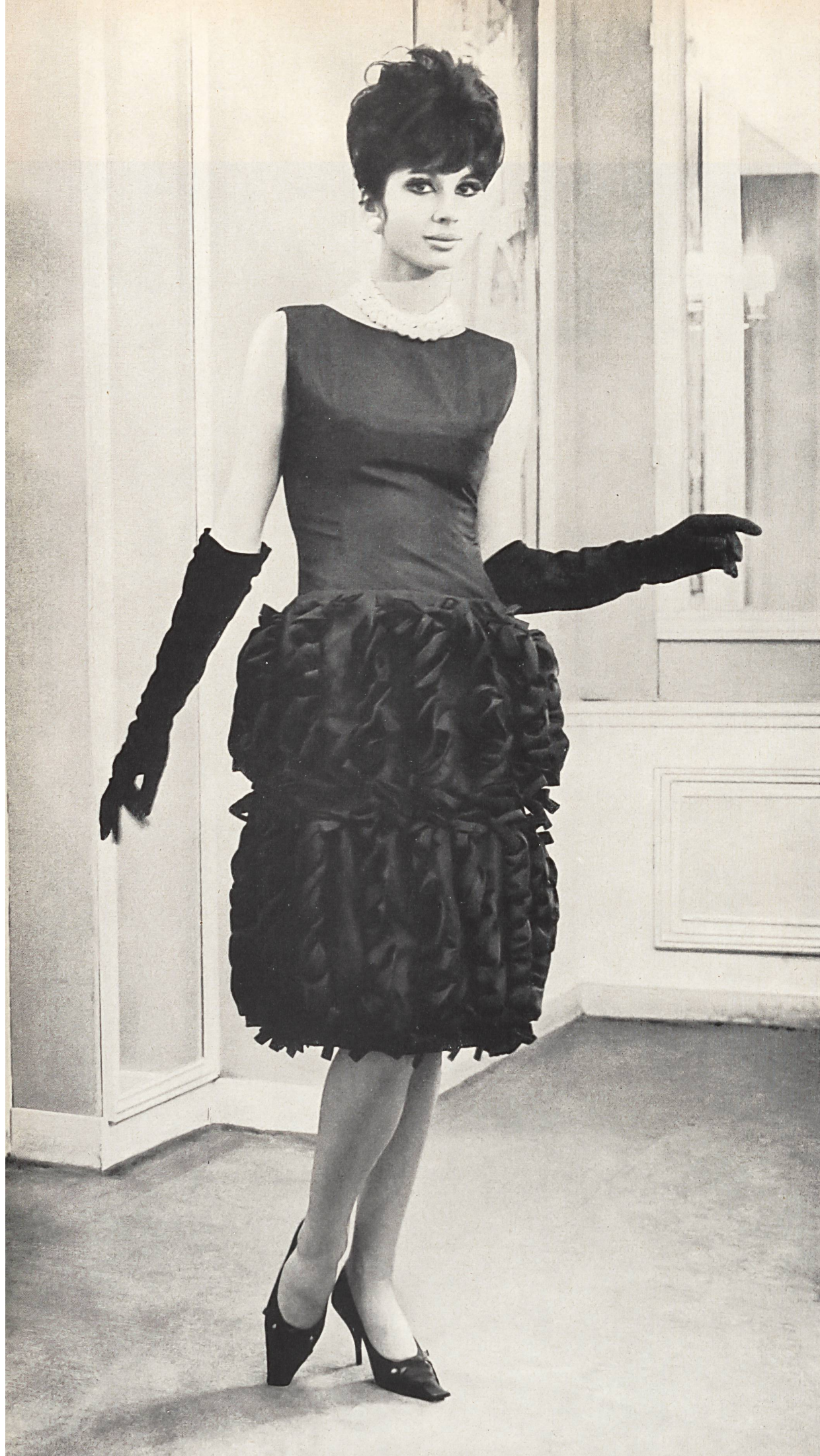
CHRISTIAN DIOR Taffetas de soie de la S. A. Stünzi Fils, Horgen