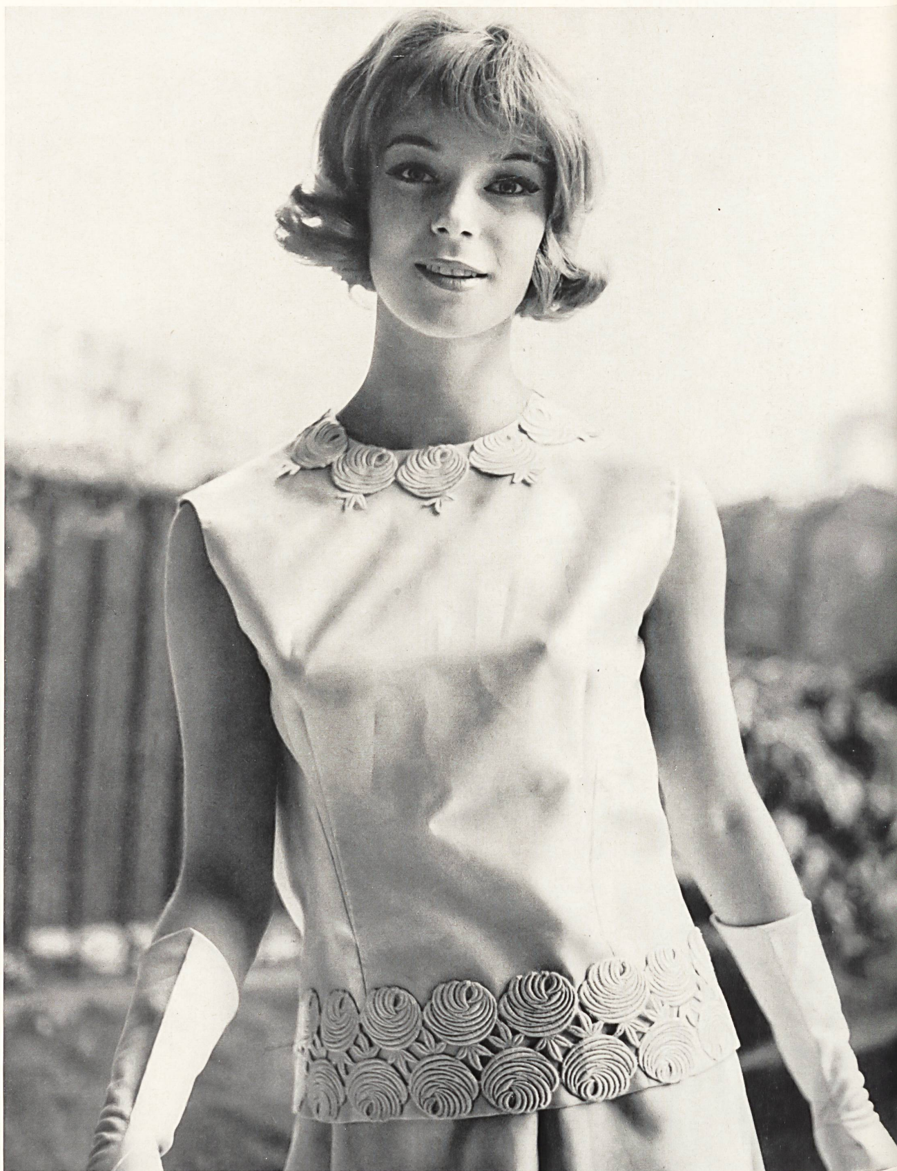
BERNARD SAGARDOY Bande de guipure de Jacob Rohner S. A., Rebstein