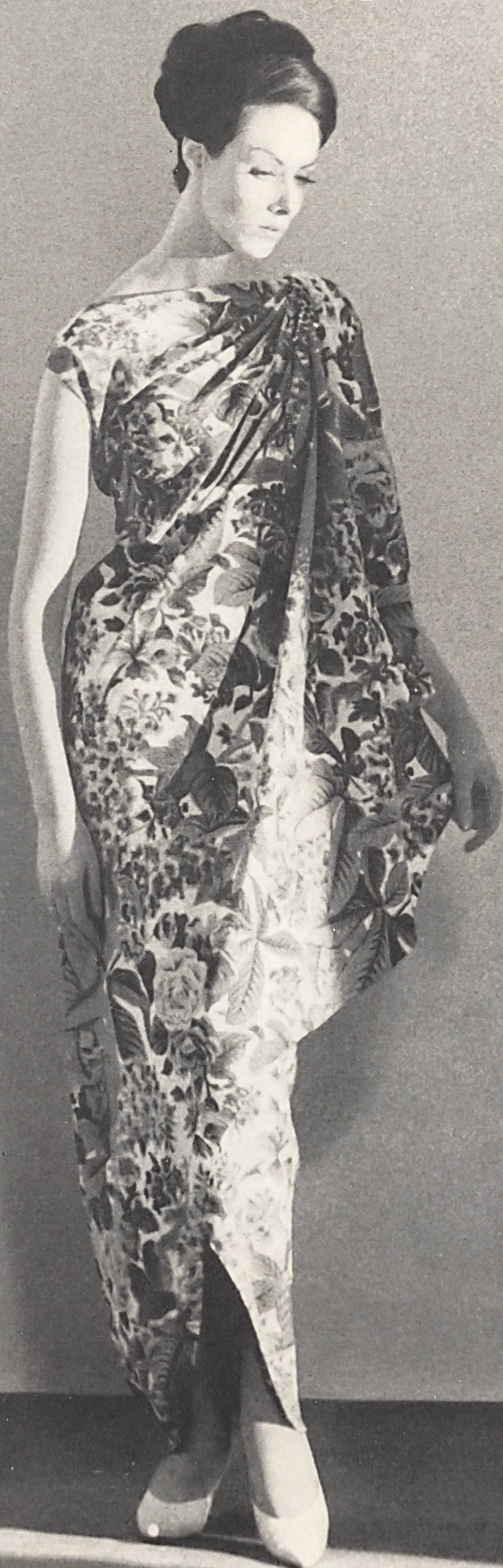
JEAN DESSES Crêpe « Corico » imprimé de L. Abraham & Cie, Soieries S. A., Zurich