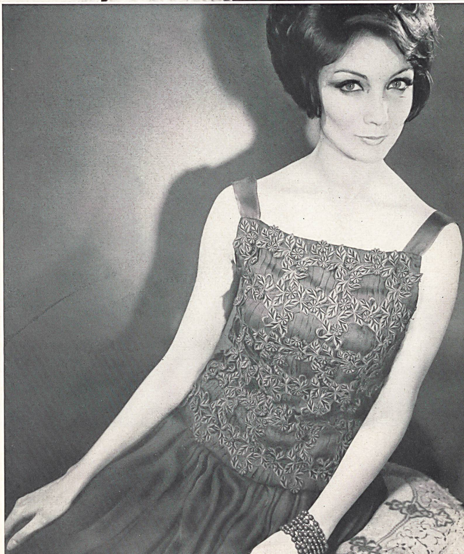
BERNARD SAGARDOY Dentelle gros relief avec fleurs superposées de Walter Schrank & Co. S.A., Saint-Gall Grossiste à Paris : Robert Burg & Cie