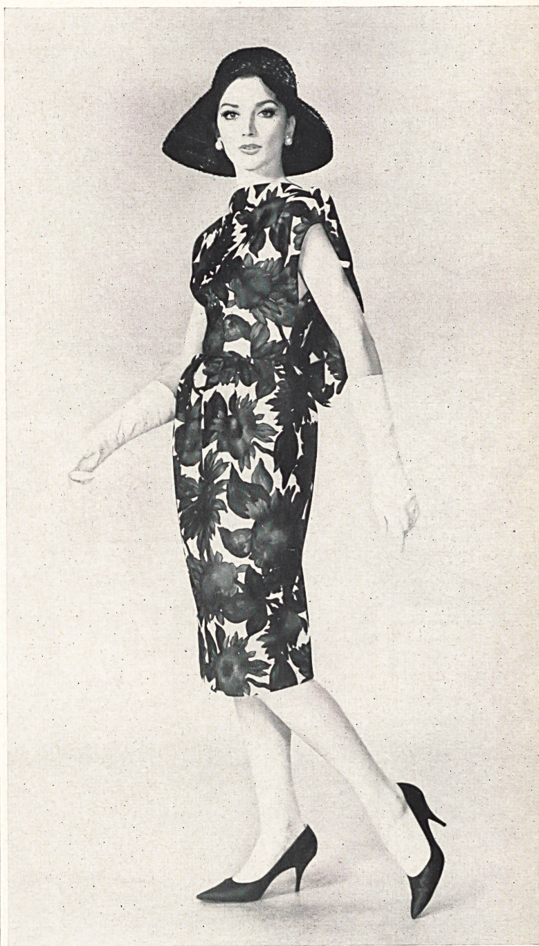
BOB BUGNAND « Corniche » imprimé de Rudolf Brauchbar & Cie S. A., Zurich Distribué par Montex, Paris