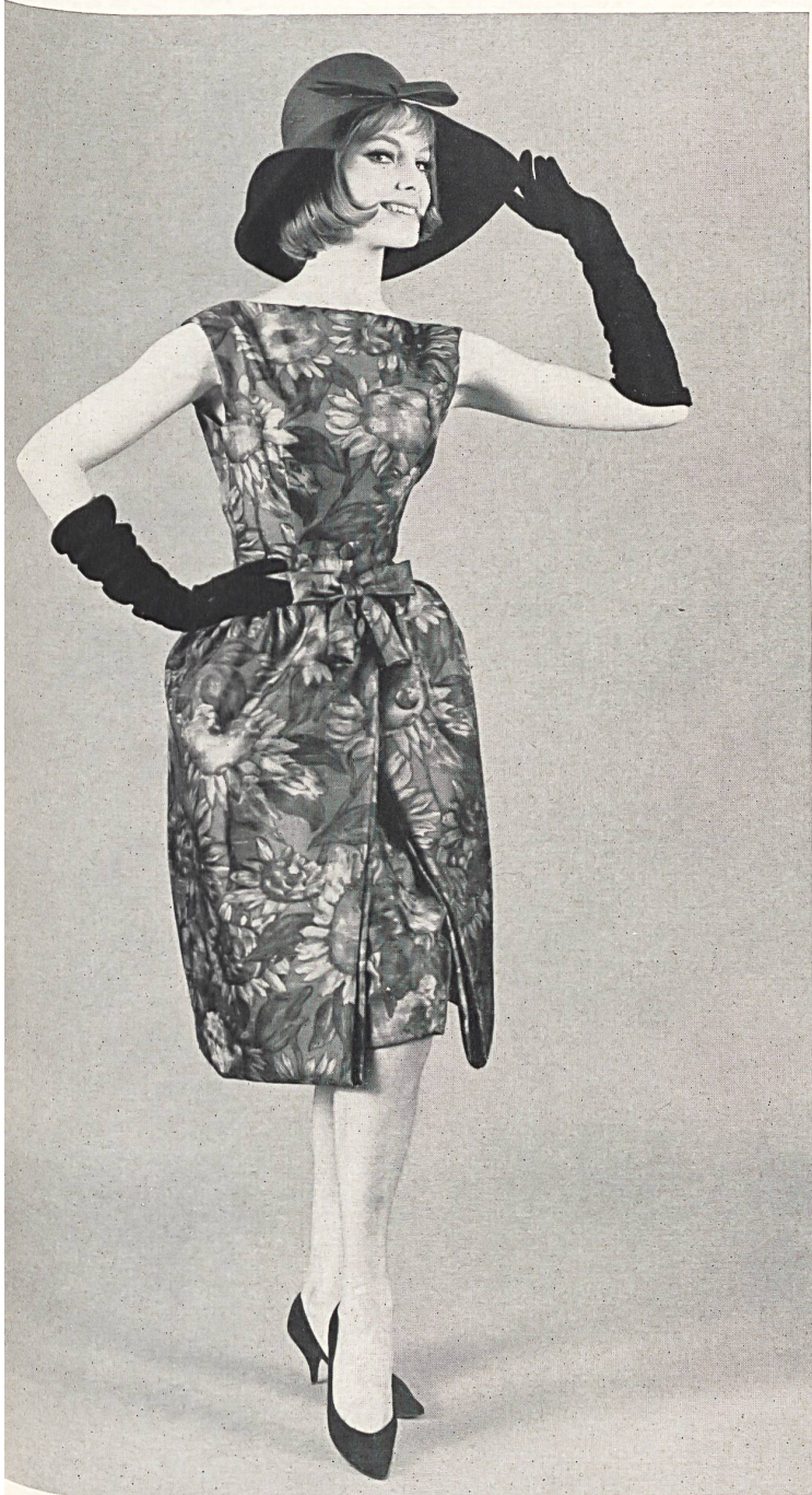
BOB BUGNAND « Olympie » pure soie de Rudolf Brauchbar & Cie S. A., Zurich Distribué par Montex, Paris