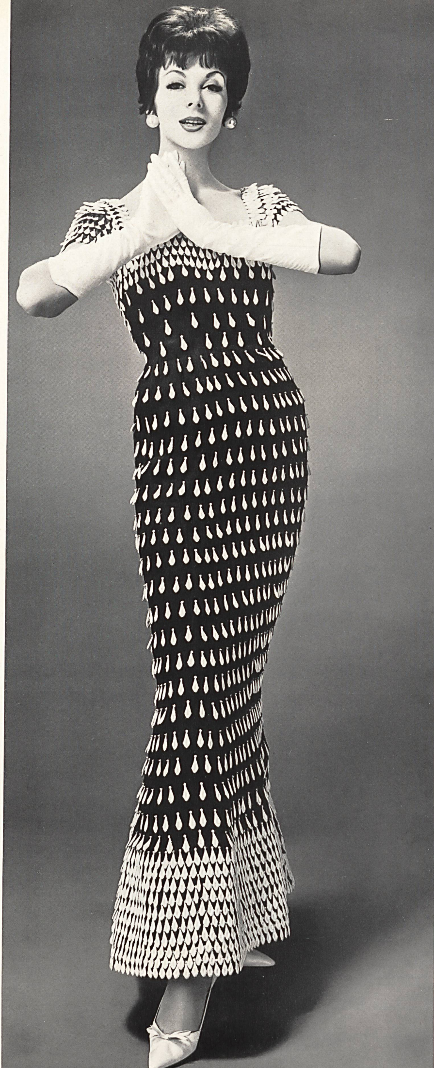
LANVIN CASTILLO