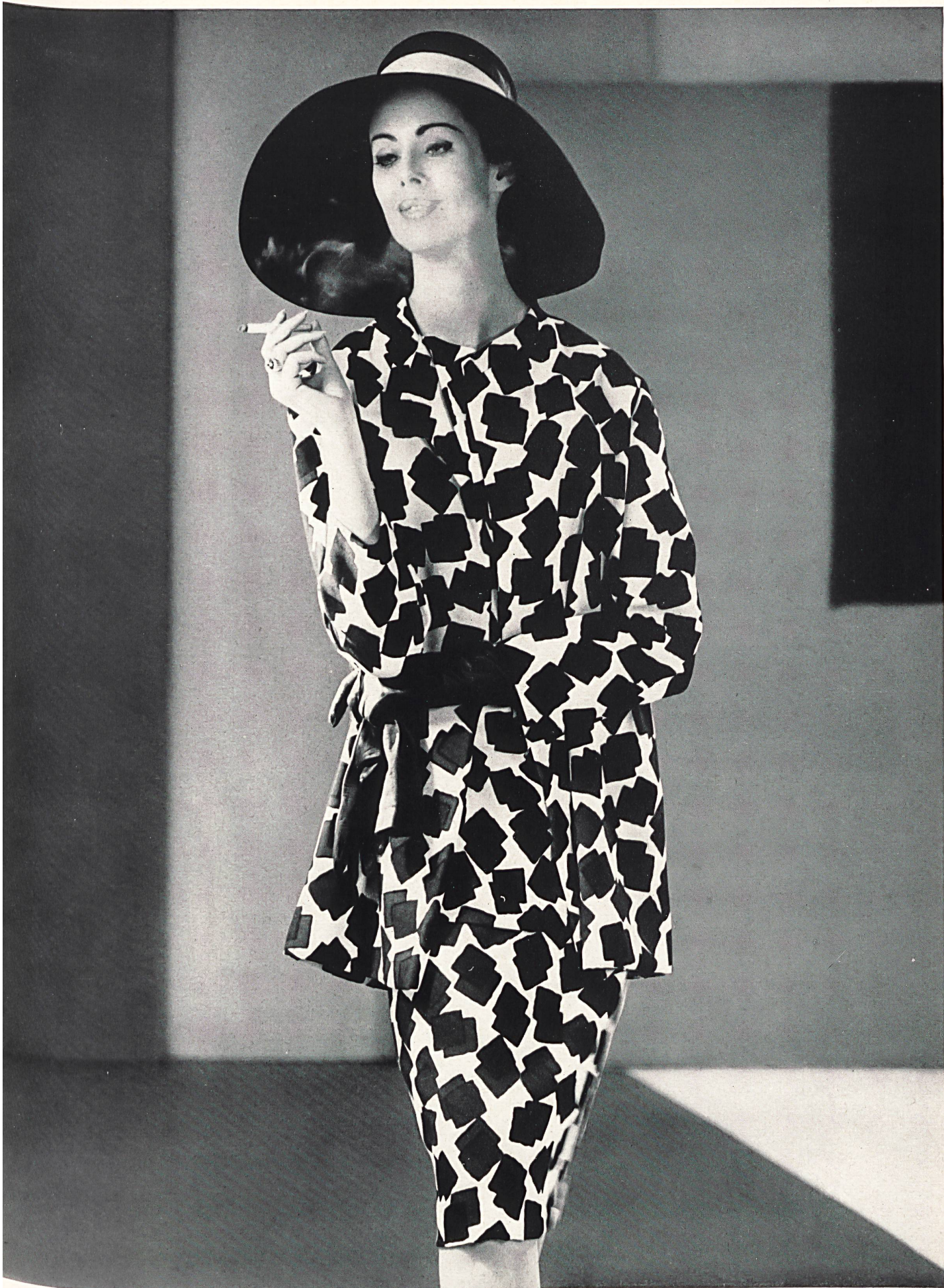
NINA RICCI Crêpe « Corico » imprimé de L. Abraham & Cie, Soieries S.A., Zurich