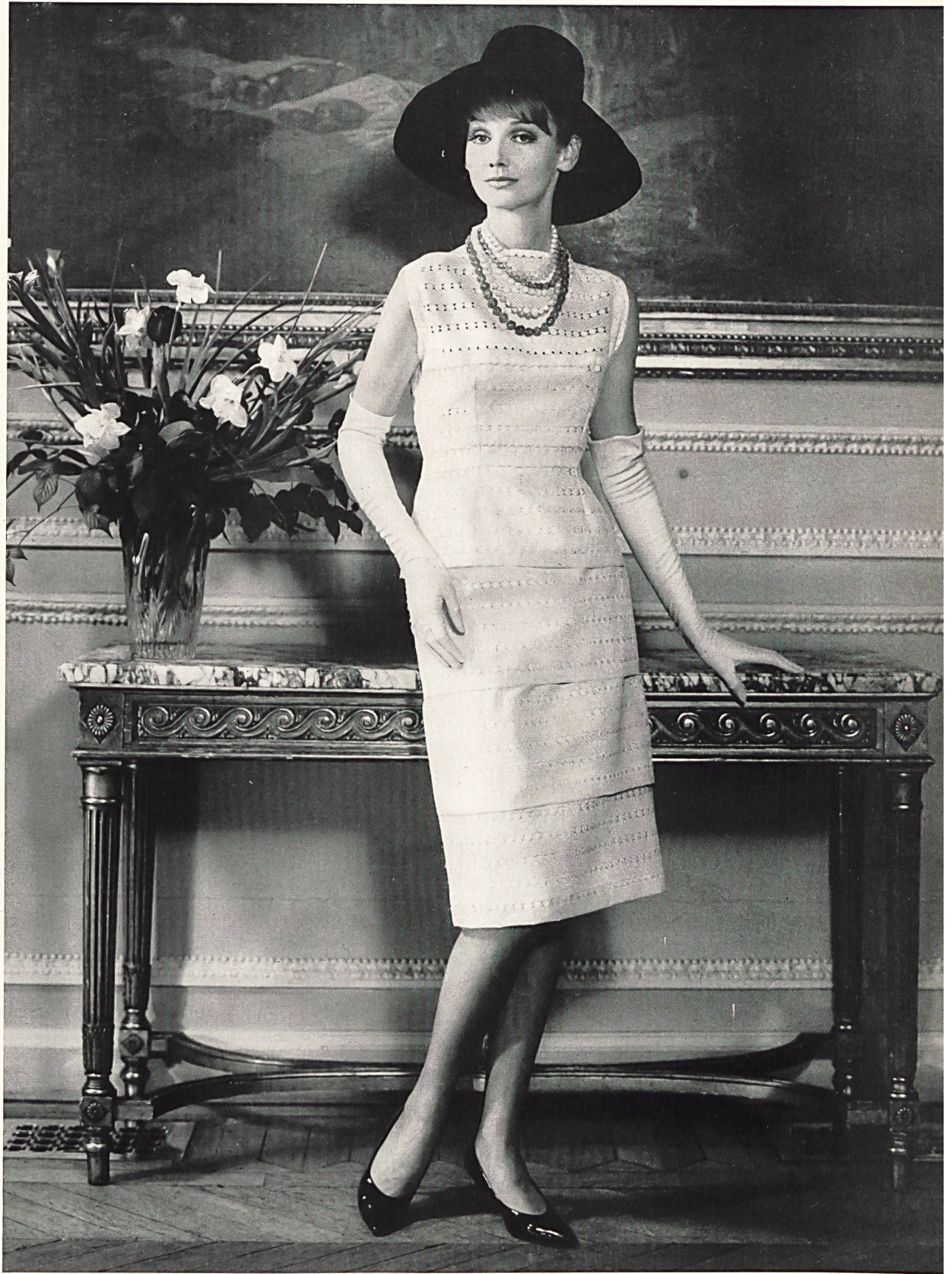
CARVEN Batiste Minicare de Reichenbach & Co., Saint-Gall Distribué par Montex, Paris