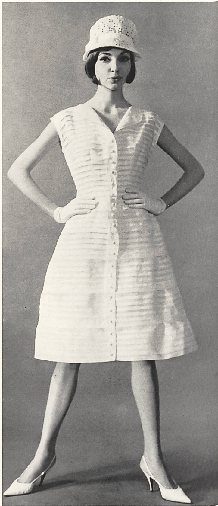
CARVEN Percalé plissé de Reichenbach & Co., Saint-Gall Distribué par Montex, Paris