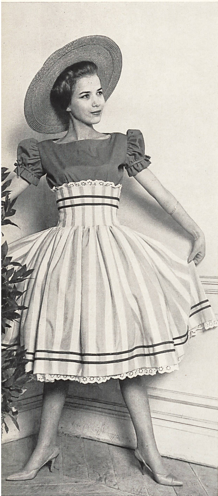
JACQUES ESTEREL «Recosablé» Minicare de Reichenbach & Co., Saint-Gall Distribué par Montex, Paris