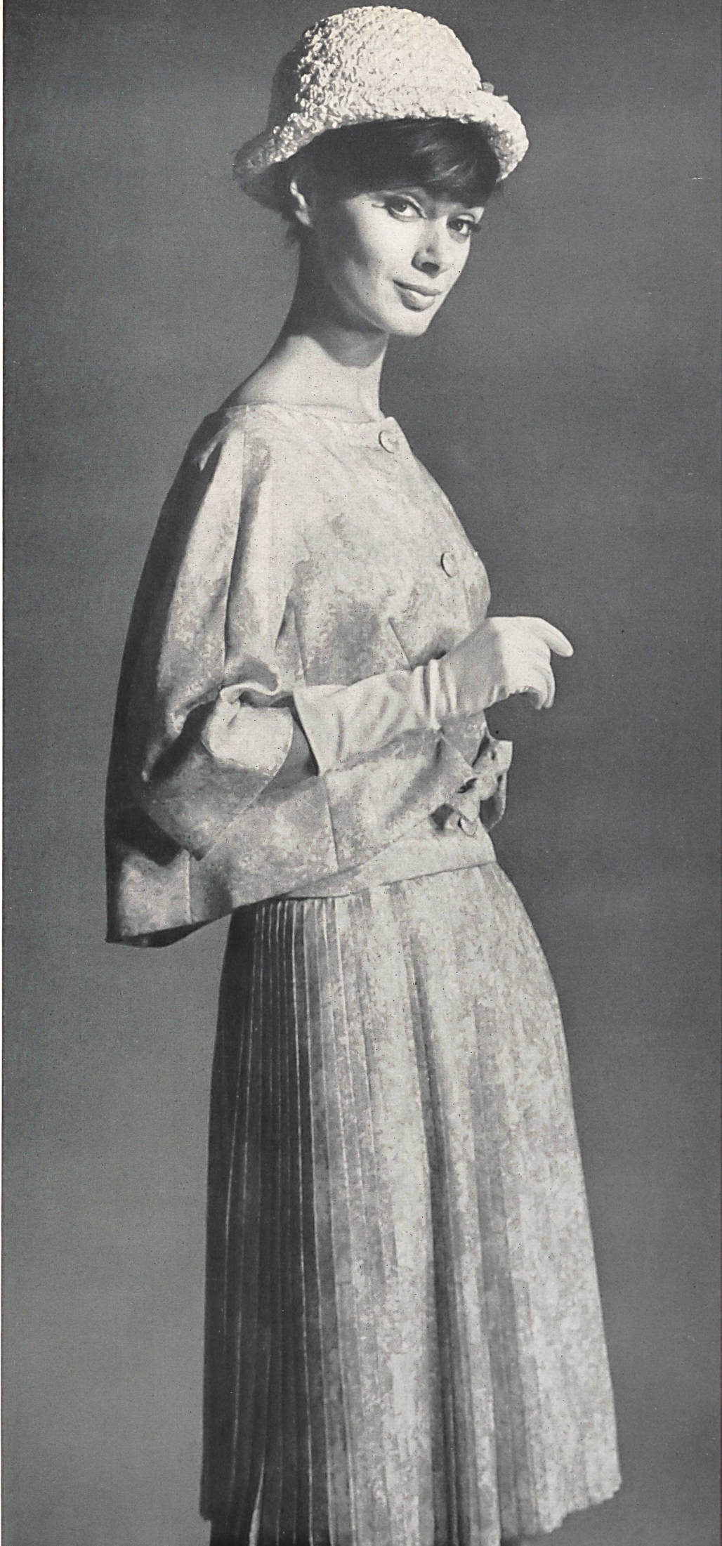
JACQUES HEIM « Coïmbra » twill pure soie de Bégé S. A., Zurich, succ. de Berthold Guggenheim Fils & Cie