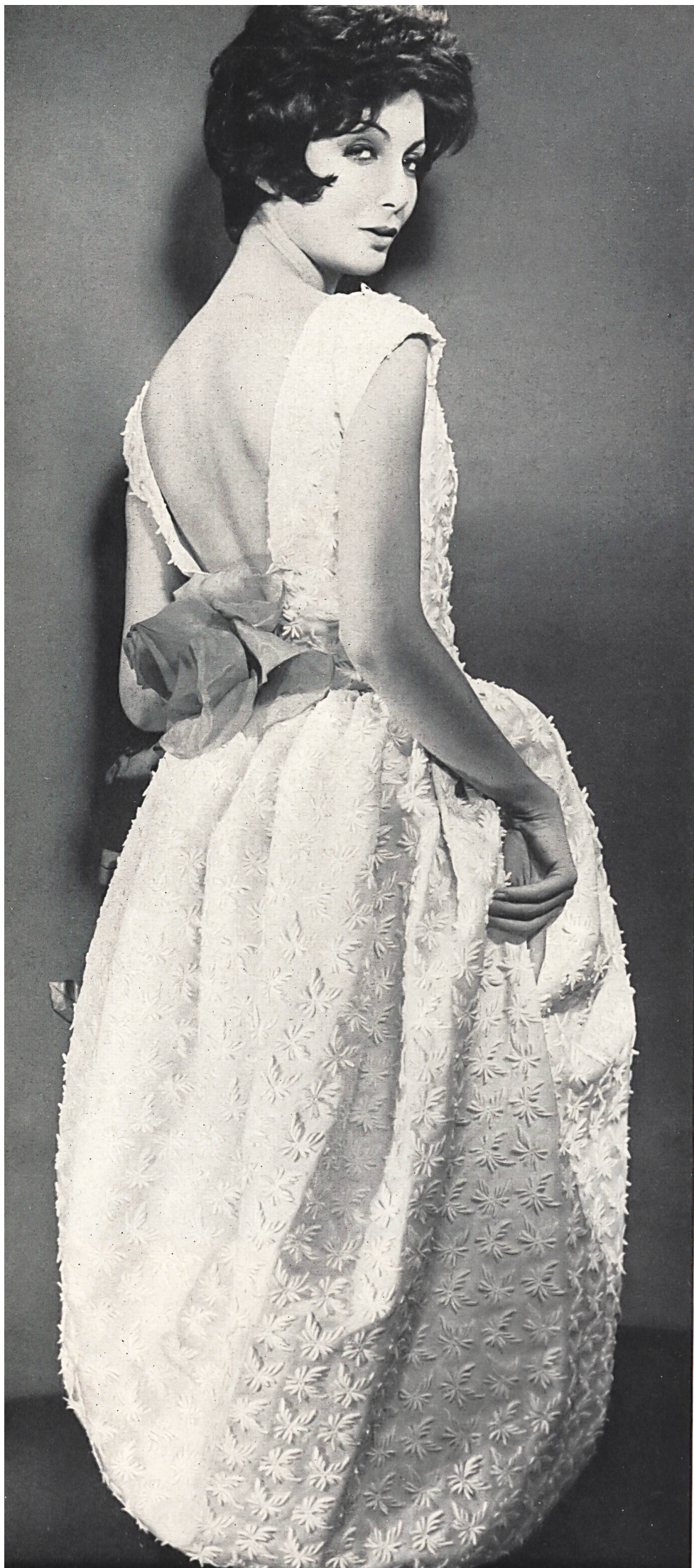
JACQUES GRIFFE Satin de soie brodé de guipure superposée de Rau S. A., Saint-Gall Grossiste à Paris : Robert Burg & Cie