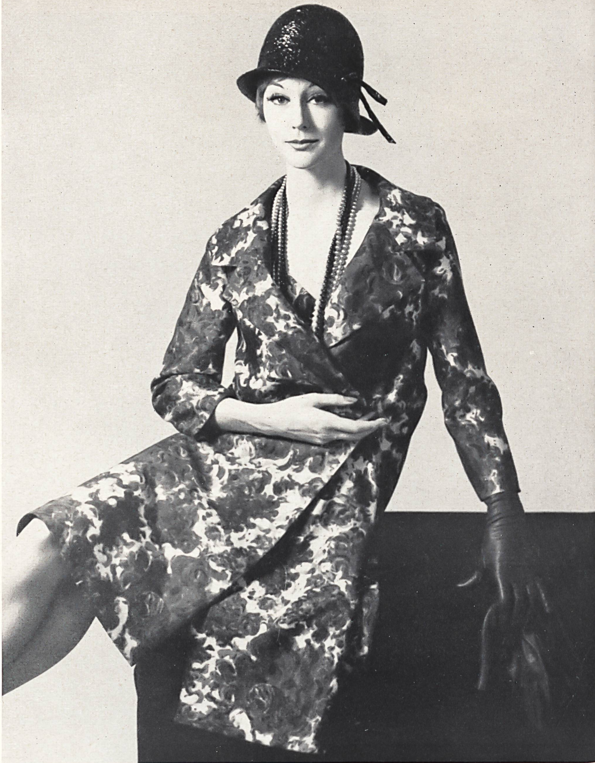
NINA RICCI Impression main sur soie « Manina » de Robt. Schwarzenbach & Co., Thalwil