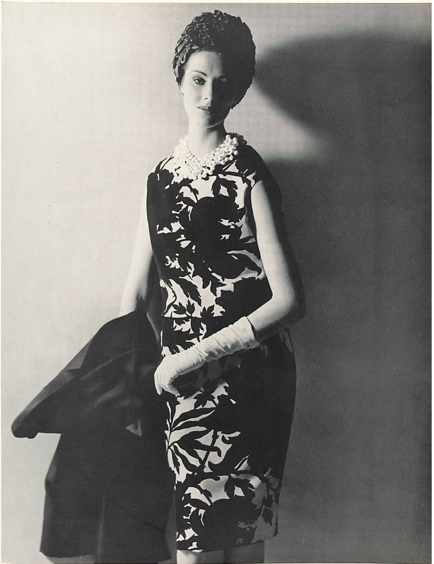
CHRISTIAN DIOR Crêpe « Corico » imprimé de L. Abraham & Cie, Soieries S. A., Zurich