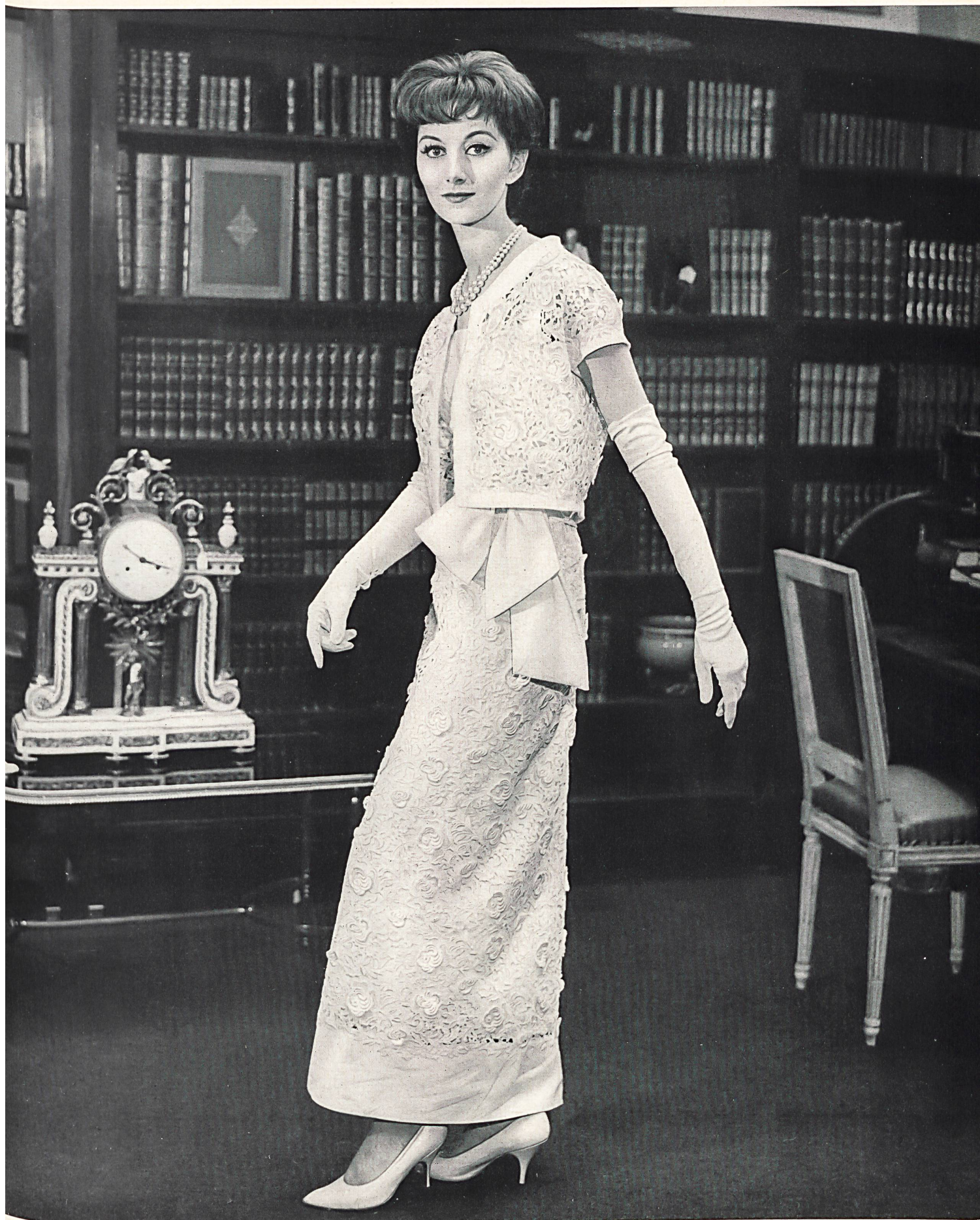
PIERRE BALMAIN Guipure riche de Forster Willi & Co., Saint-Gall Grossiste à Paris: Pierre Brivet S. à r. l.