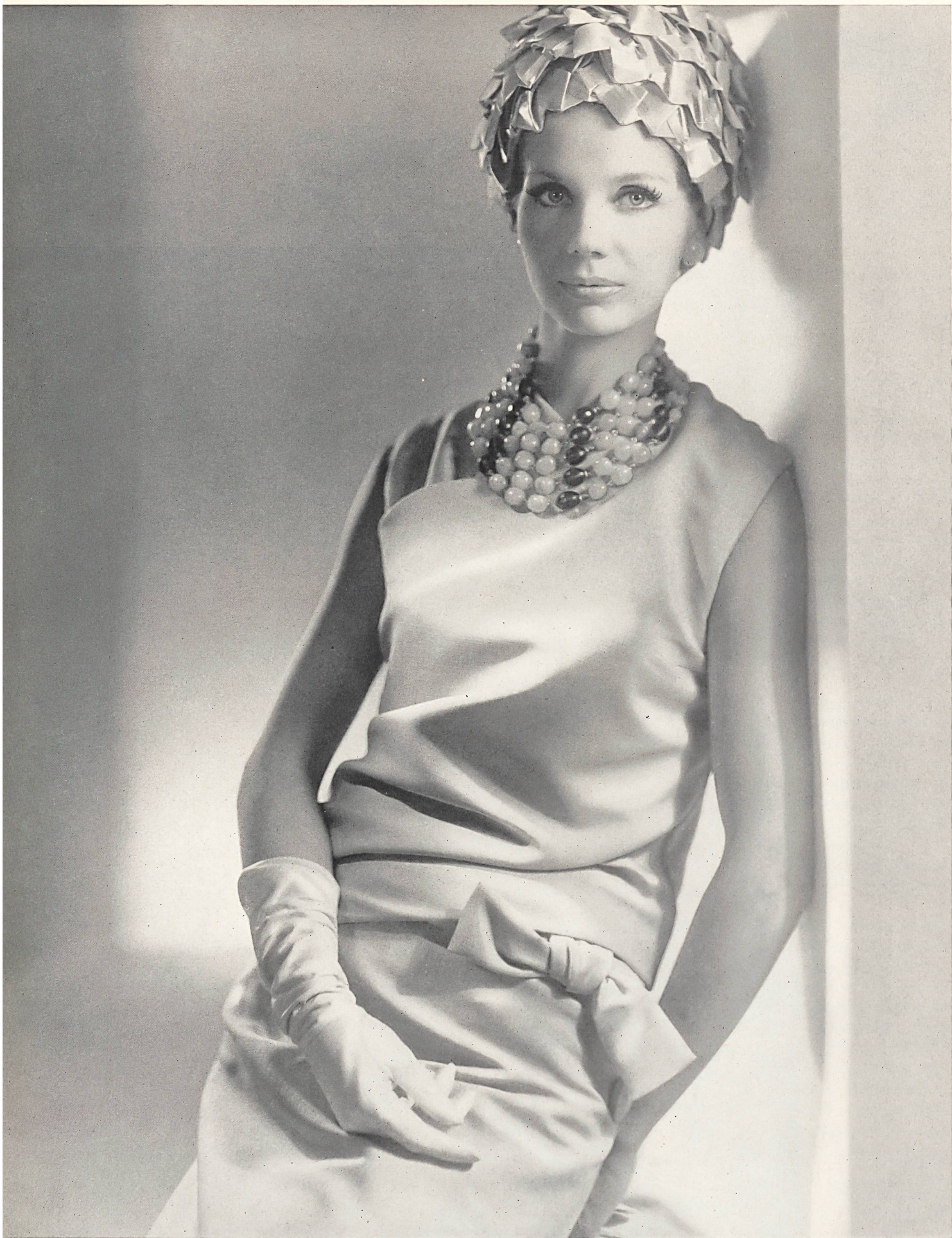
CHRISTIAN DIOR « Tasco Silk » de L. Abraham & Cie, Soieries S. A., Zurich