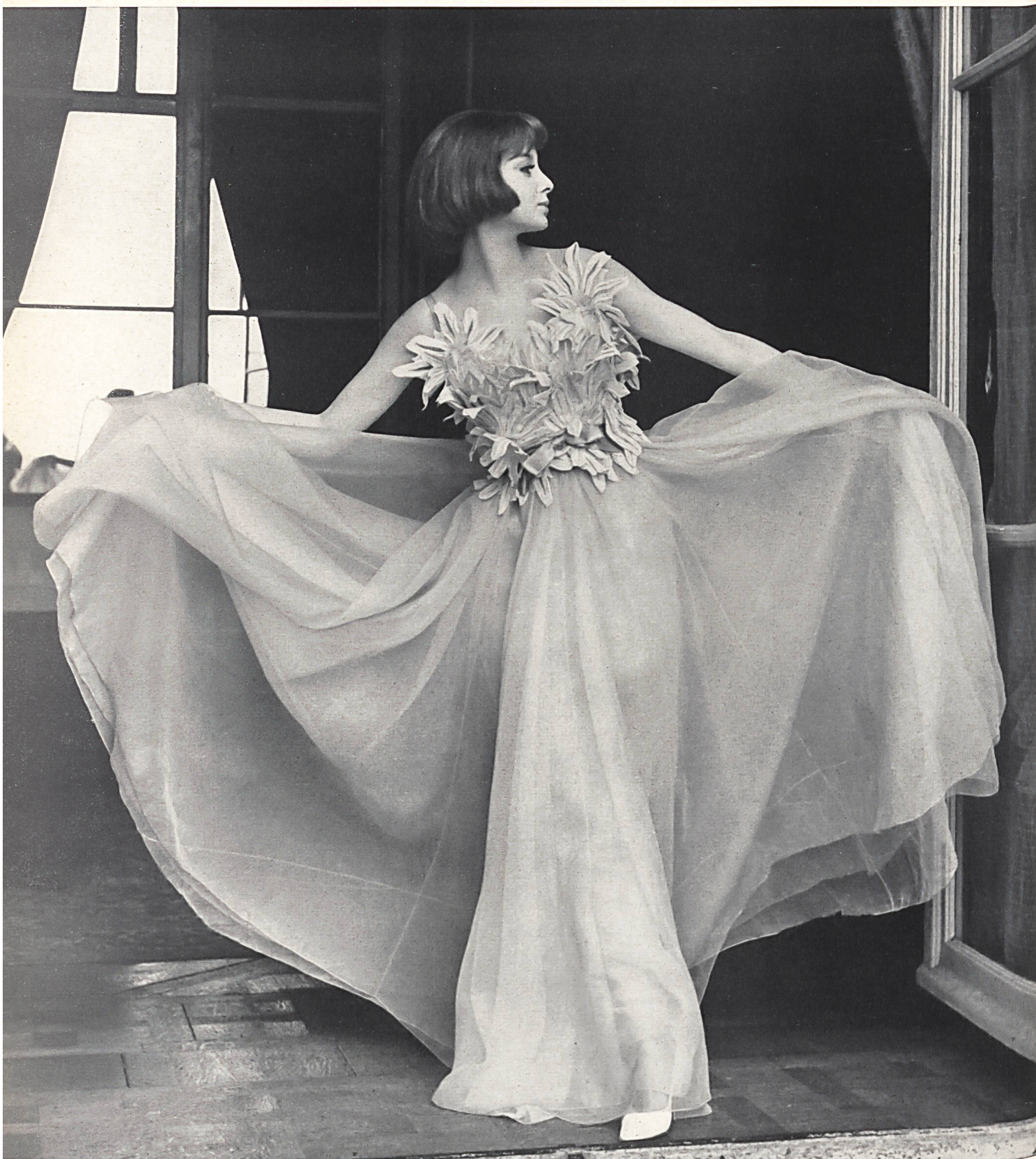
CHRISTIAN DIOR Guipure riche de A. Naef & Cie S.A., Flawil

MODÈLES EXCLUSIFS — REPRODUCTION INTERDITE