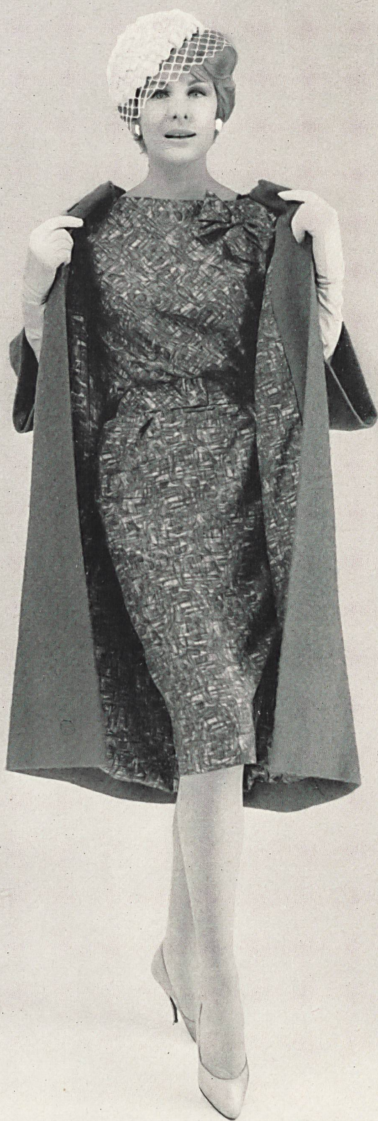
PIERRE BALMAIN « Luanda » imprimé de Rudolf Brauchbar & Cie S.A., Zurich Distribué par Montex, Paris