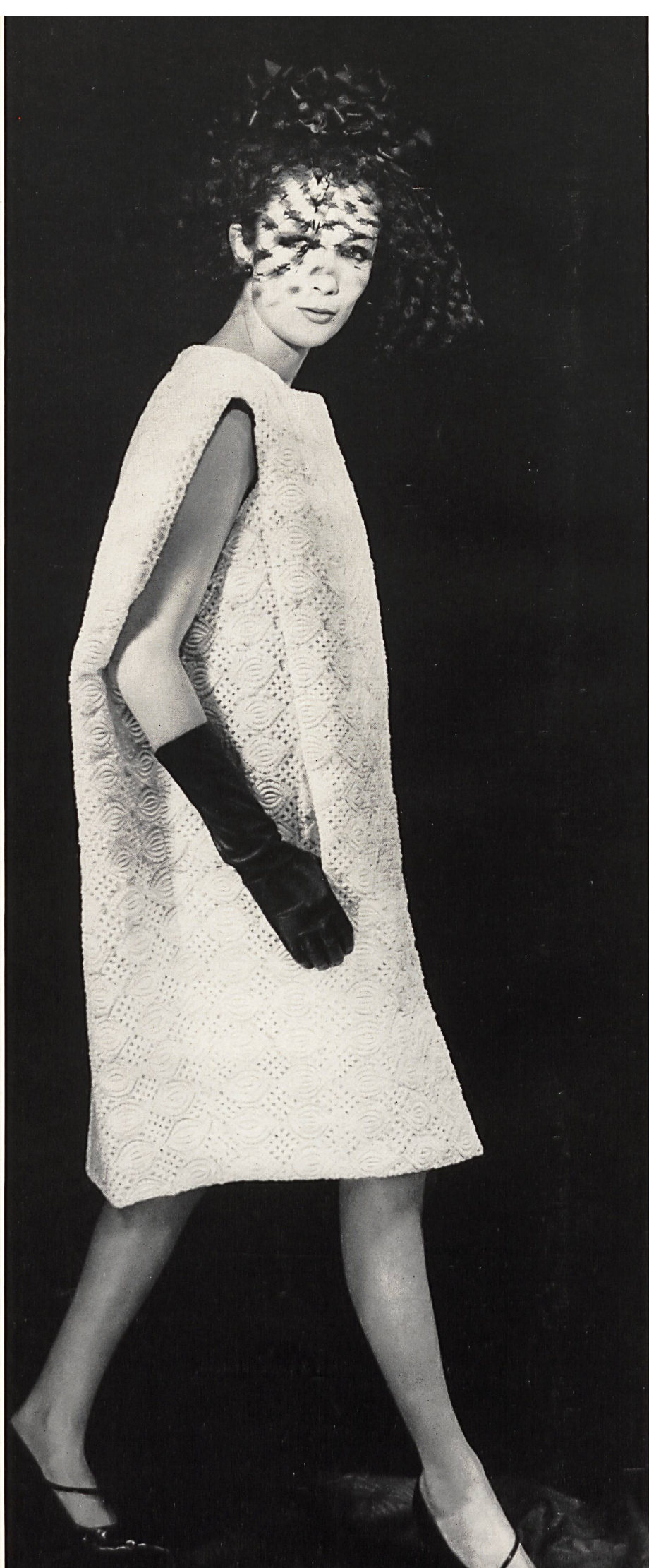
CHRISTIAN DIOR (Boutique) Broderie de laine de Walter Schrank & Co. S.A., Saint-Gall