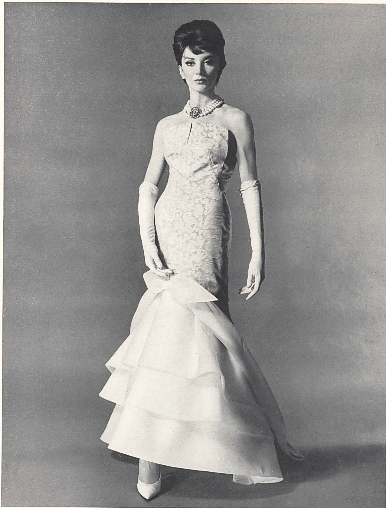
CARVEN Jacquard piqué de Reichenbach & Co., Saint-Gall Distribué par Montex, Paris