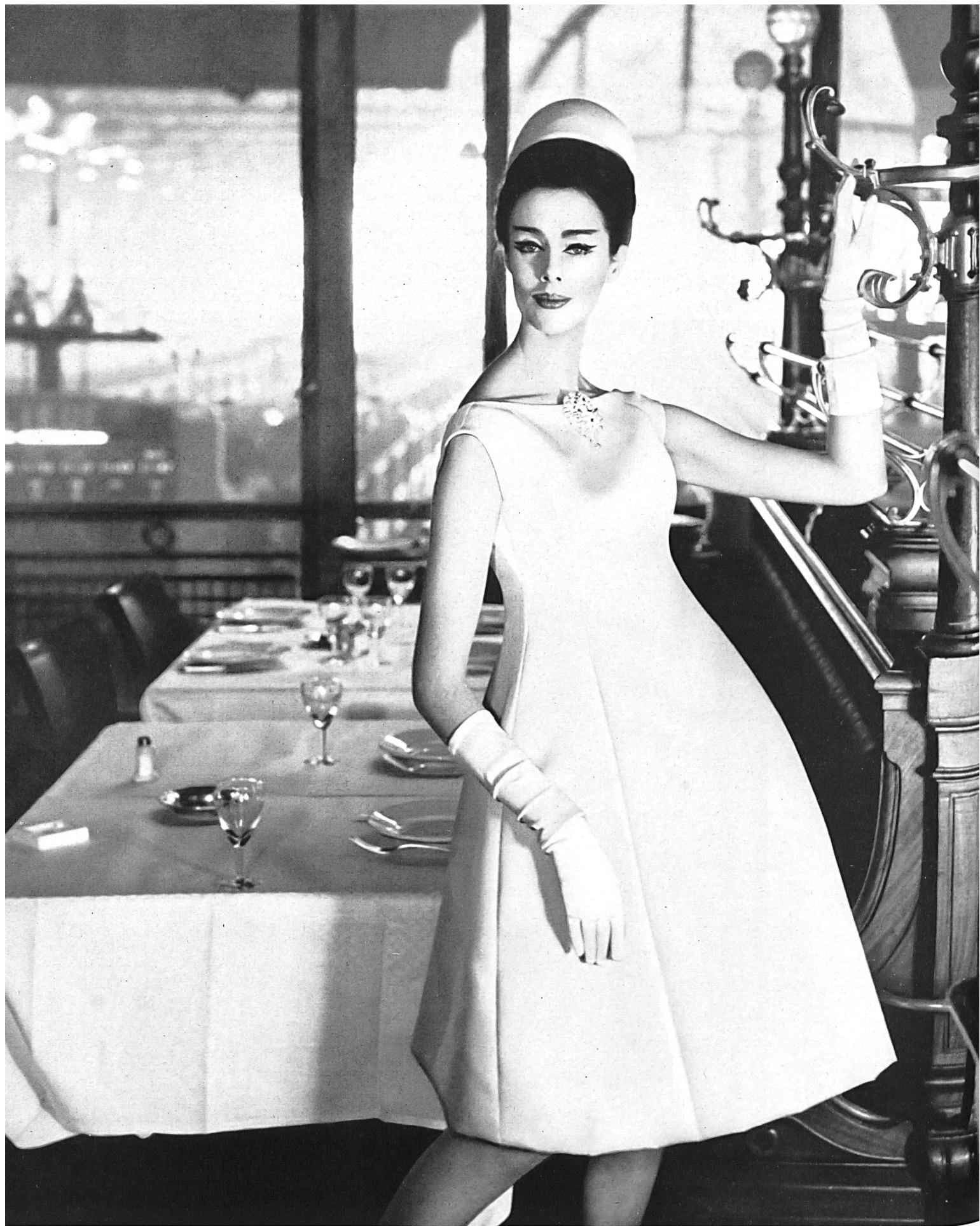
CHRISTIAN DIOR Cabardine de soie de L. Abraham & Cie, Soieries S. A., Zurich