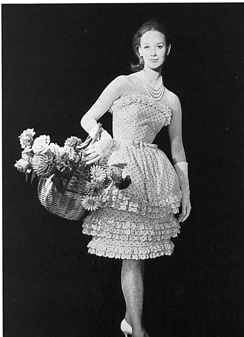
CHRISTIAN DIOR (Boutique)

Broderie sur batiste de A. Naef & Cie S.A., Flawil