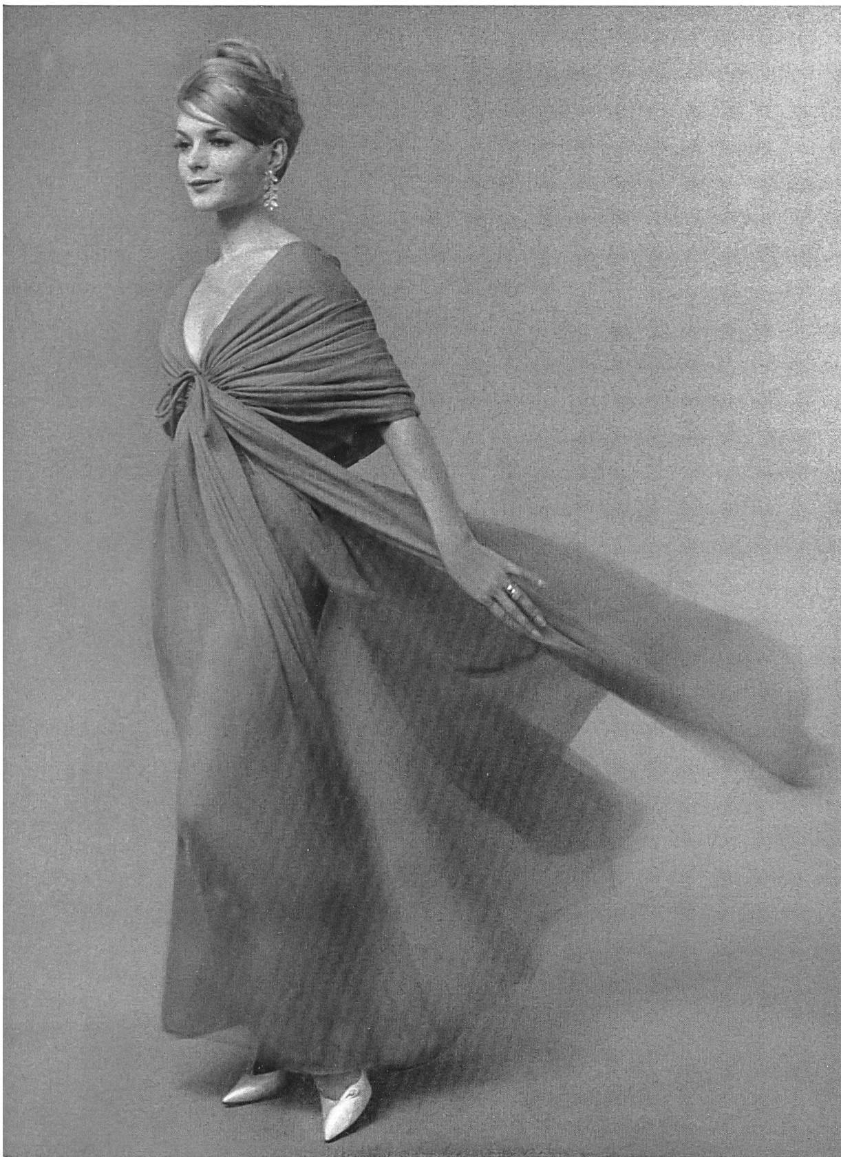
JACQUES GRIFFE Mousseline « Follette » de L. Abraham & Cie, Soieries S. A., Zurich