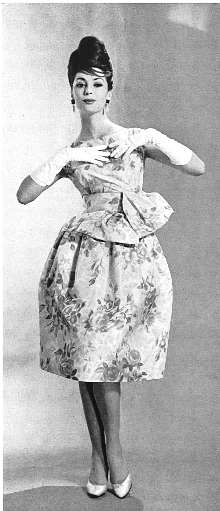
CHRISTIAN DIOR (Boutique) Taffetas chiné pure soie de Rudolf Brauchbar & Cie S.A., Zurich