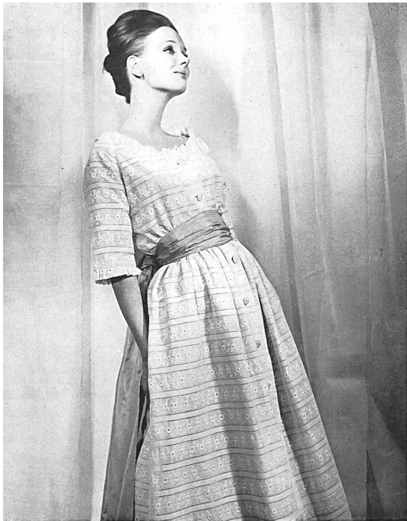
CHRISTIAN DIOR (Boutique)

Broderie sur batiste de A. Naef & Cie S.A., Flawil