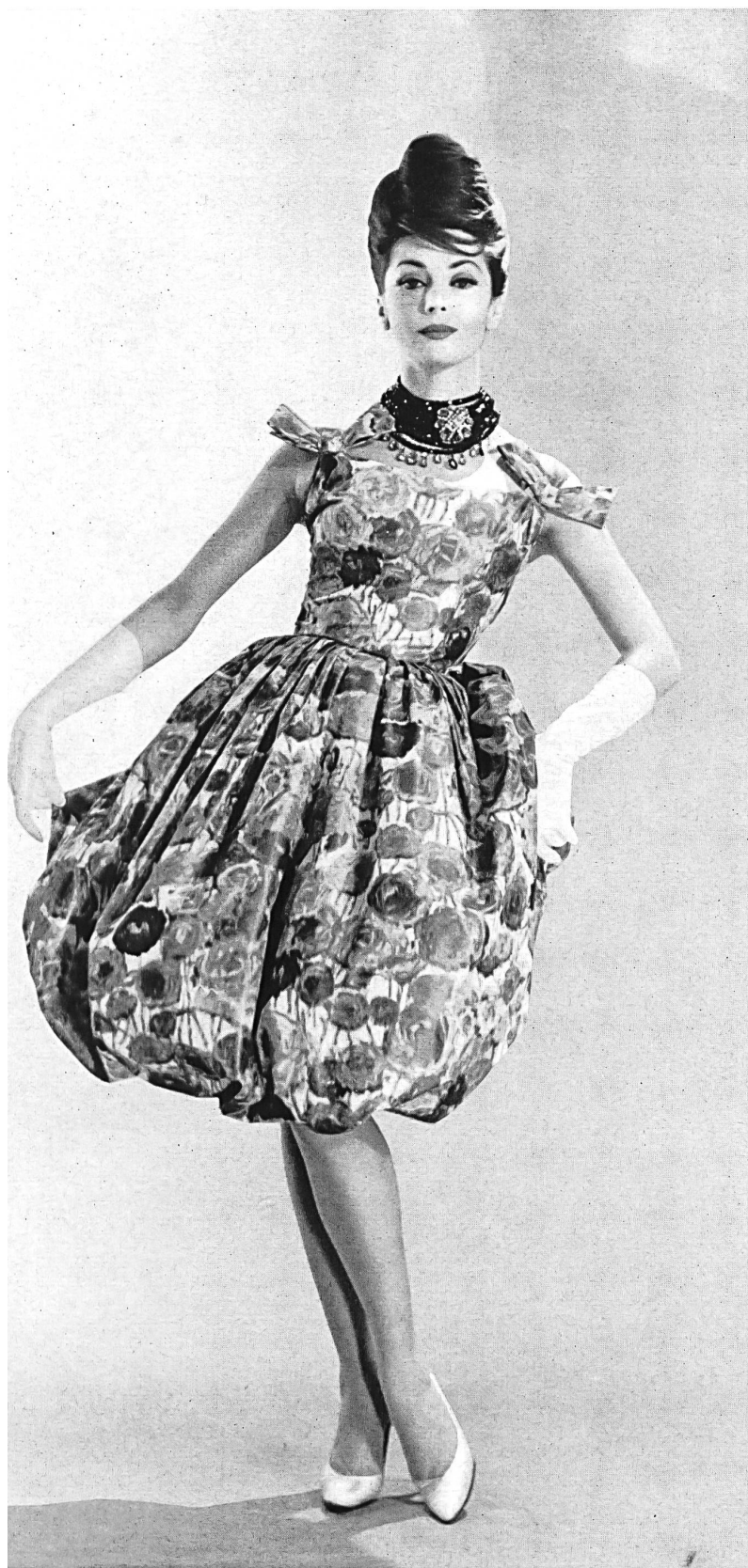
CHRISTIAN DIOR (Boutique) Taffetas chiné pure soie de Rudolf Brauchbar & Cie S.A., Zurich