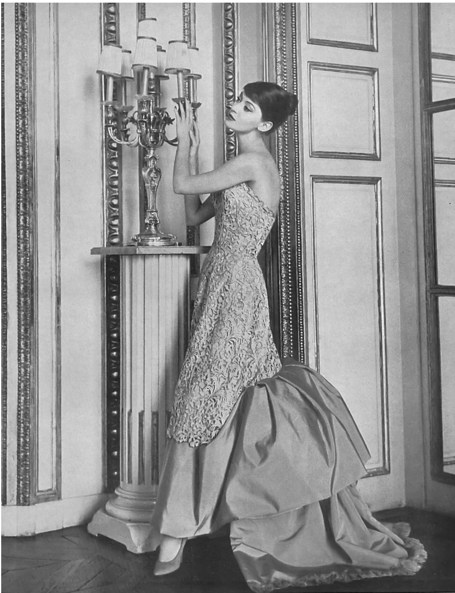
JEAN DESSES Guipure en lamé or de Forster Willi & Co., Saint-Gall Grossiste à Paris : Les Tisseurs B de M