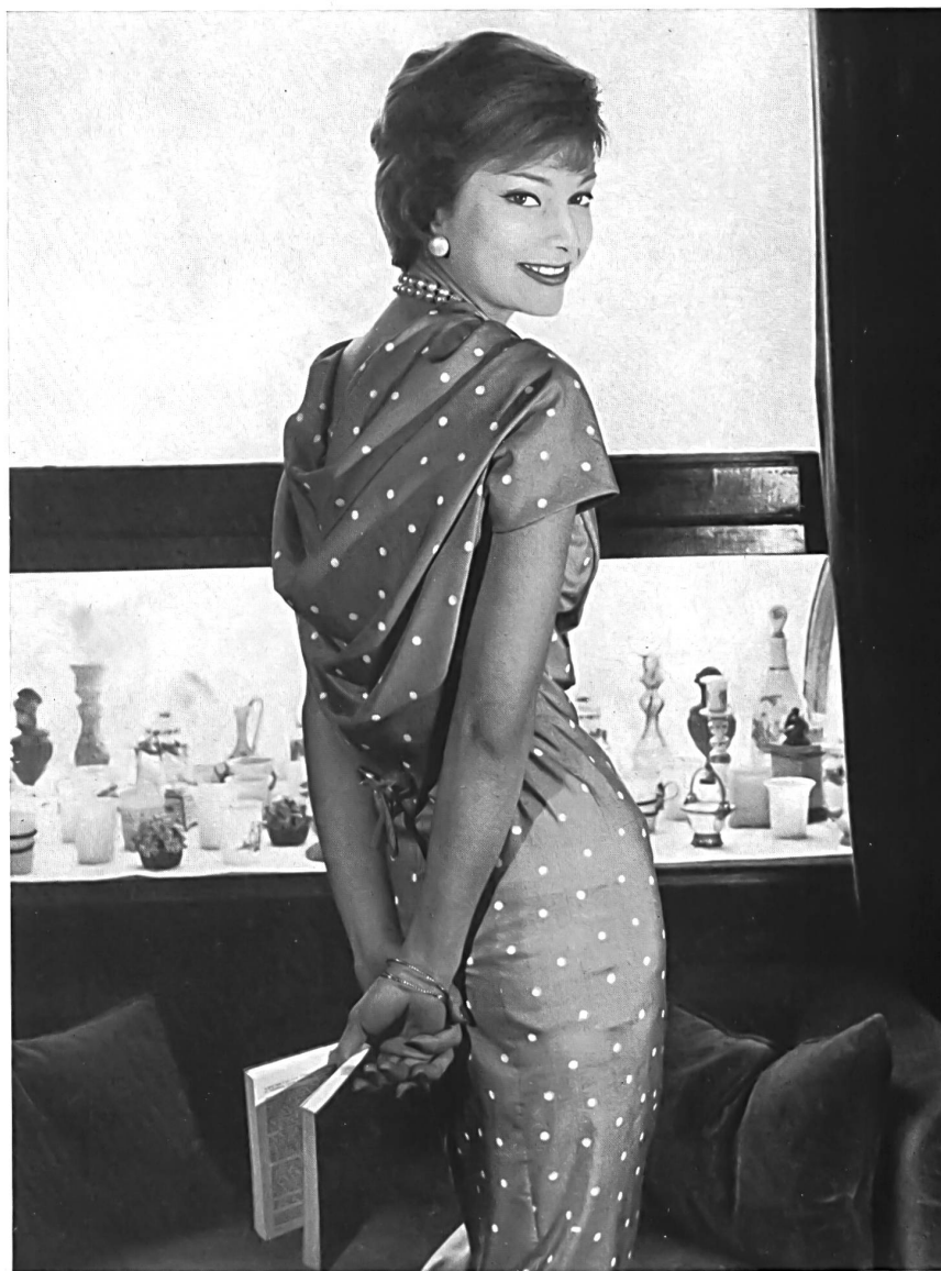
GUY LAROCHE « Super-Miyako » imprimé de L. Abraham & Cie, Soieries S.A., Zurich