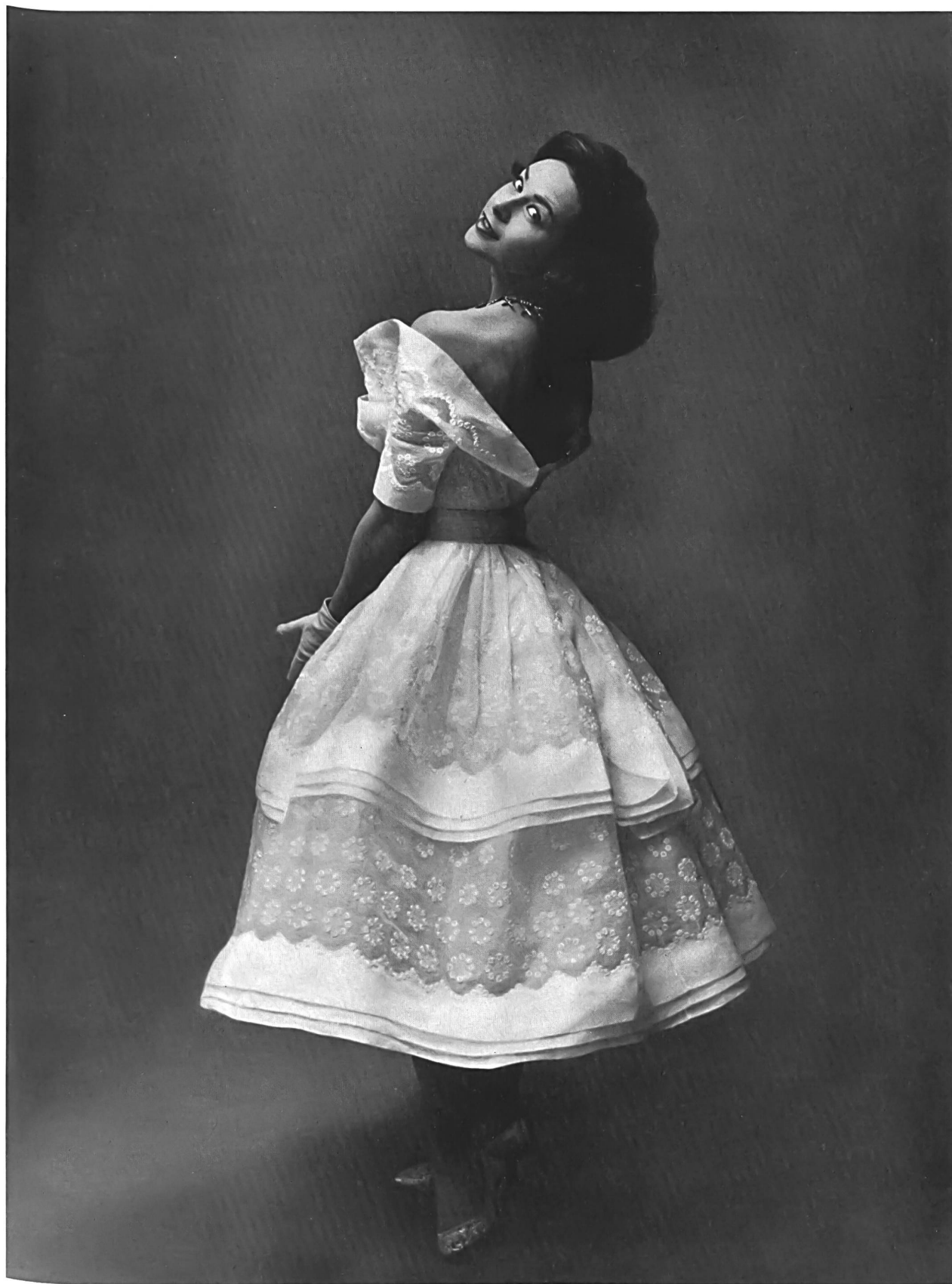
CARVEN Organdi blanc brodé de Reichenbach & Co., Saint-Gall Montex, Paris

Tous les documents de Paris reproduits dans ce numéro représentent des modèles réservés dont la reproduction est interdite