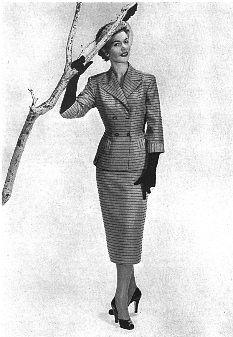
Fresco barré, rayonne et fibranne. Modèle Hellas Mfg. Co. (Pty) Ltd., Cape Town.