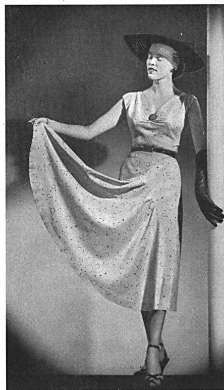
Matelassé façonné lamé. Modèle Molstad & Co., Oslo.