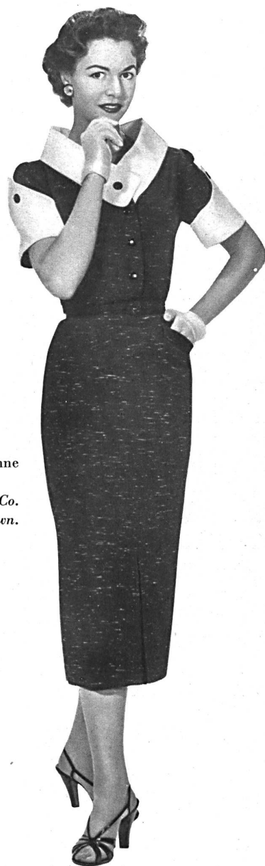
Toile Haruko, rayonne et fibranne.

Modèle Hellas Mfg. Co. (Pty) Ltd., Cape Town.