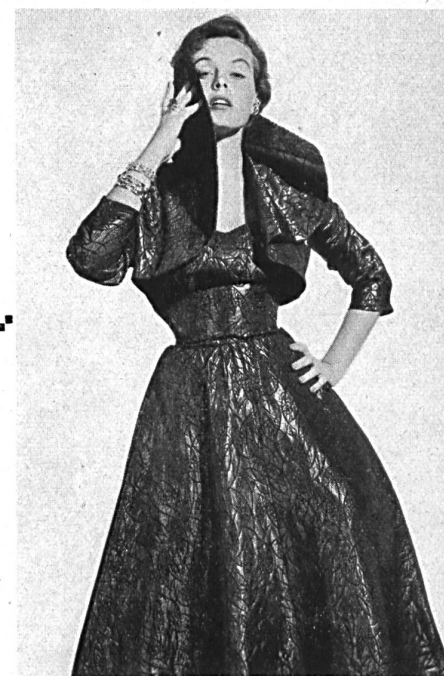
Matelassé façonné lamé. Modèle Hartnell Garment Co., Melbourne.