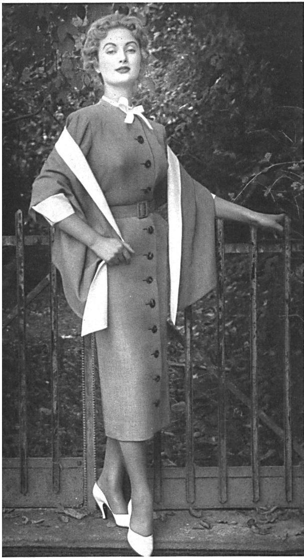
Tweed Belrobe fibranne. Modèle R. Cafader & Cie, Zurich.