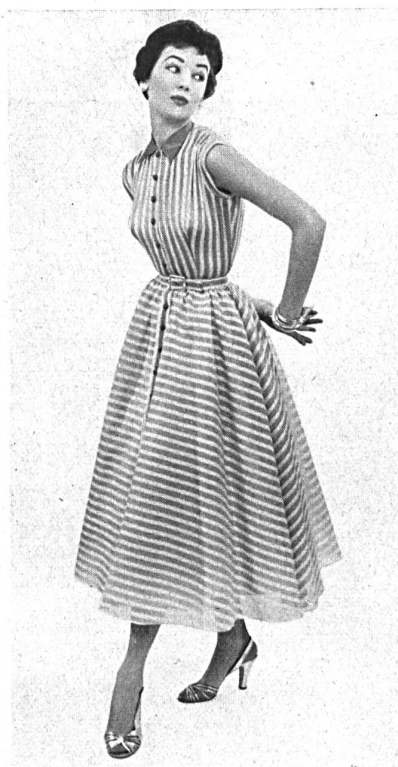
Farfalla barré. Modèle Susan Small Ltd., Londres.