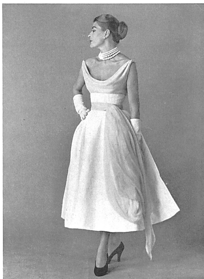
Coton jacquard blanc piqué fantaisie de Rudolf Brauchbar & Cie, Zurich distribué par Montex, Paris.