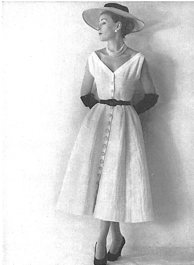
Batiste blanche plissée horizontalement de Reichenbach & Co., St-Gall distribué par Montex, Paris.