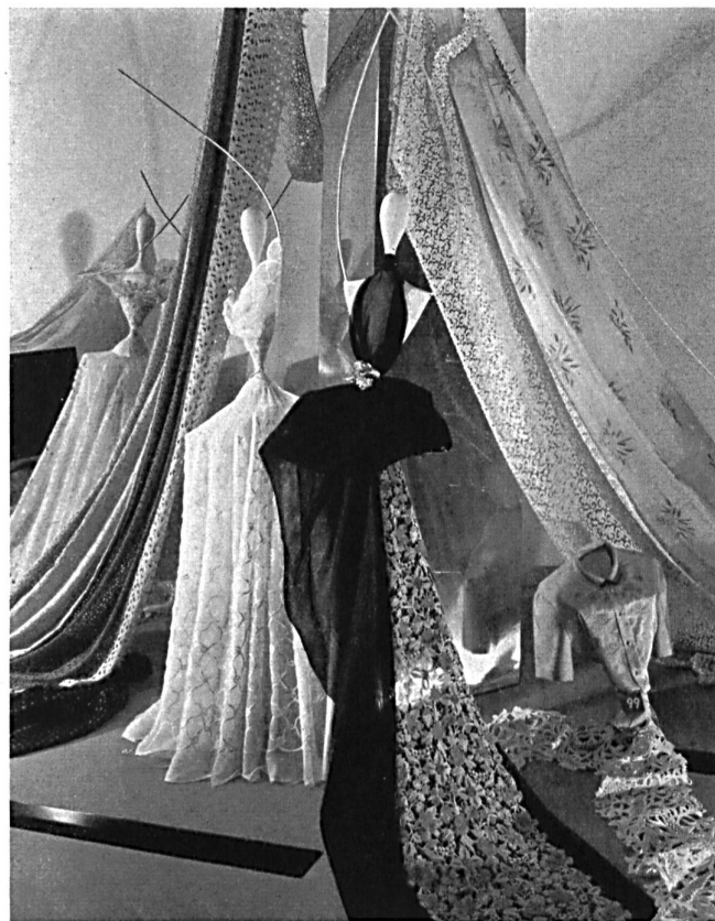
Coup d'œil sur la présentation des broderies et tissus fins de Saint-Gall. A glimpse of the presentation of embroideries and fine fabrics from St. Gall.