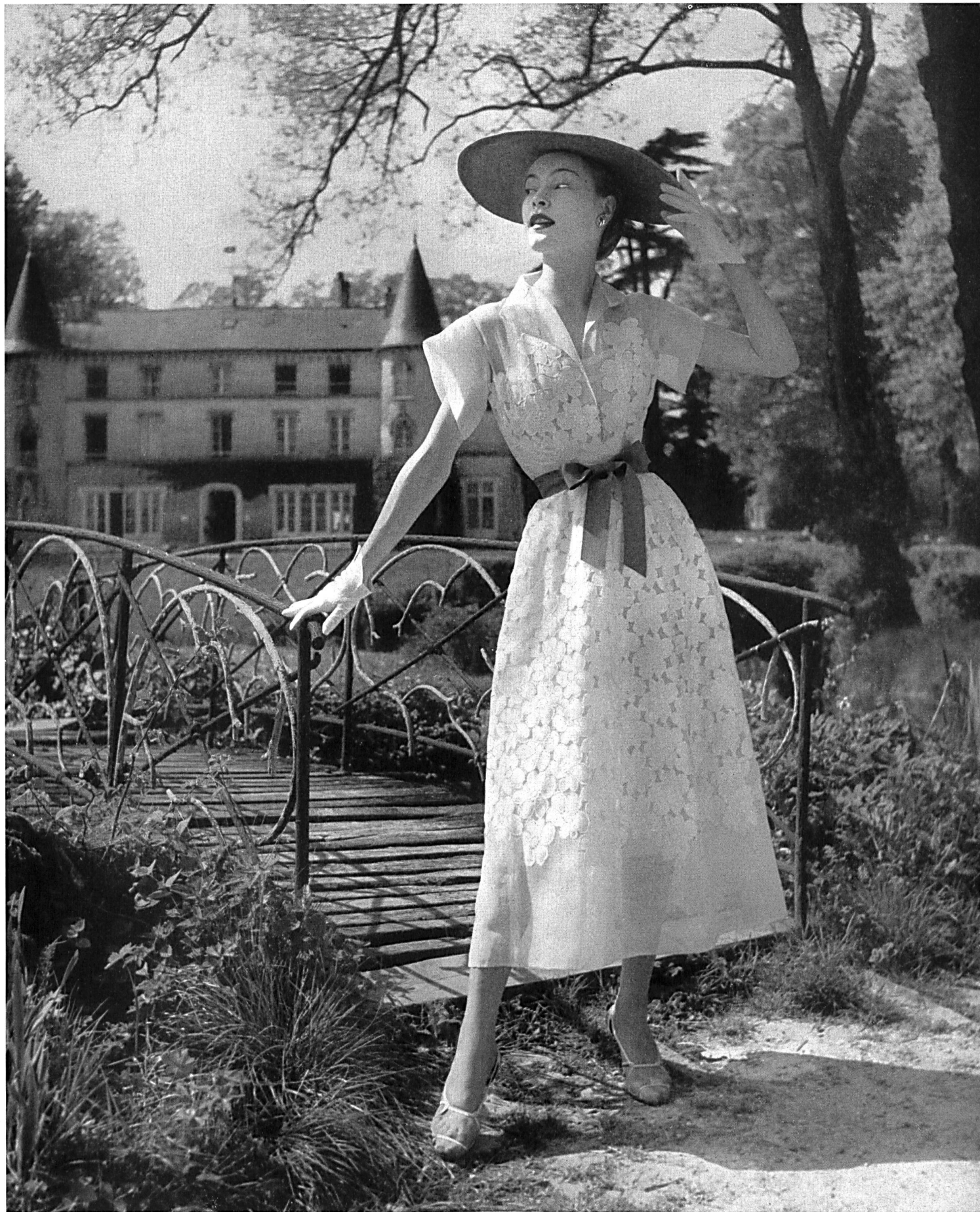
BRUYERE Broderies découpées sur toile de Union S. A., St-Gall.