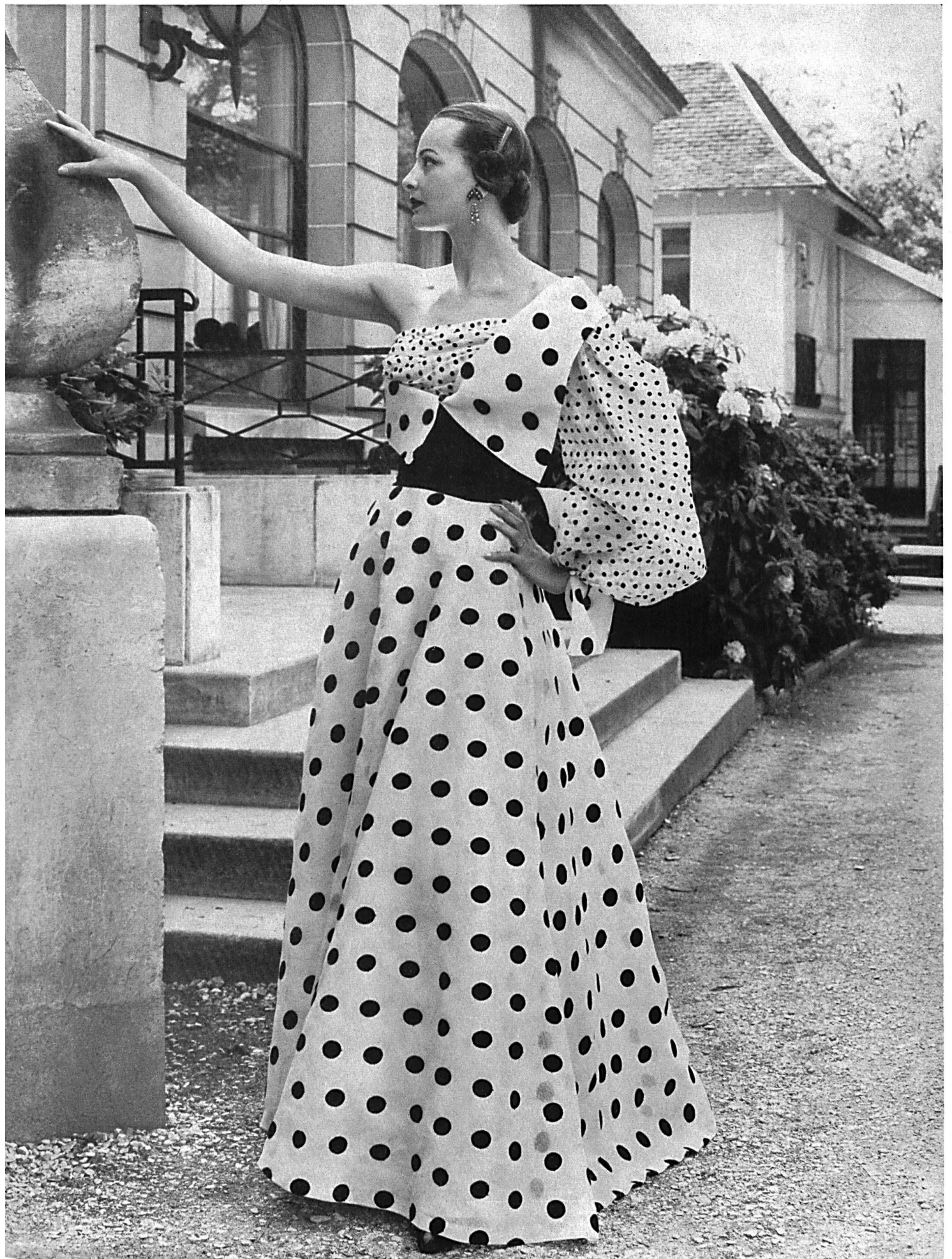
SCHIAPARELLI Organdi blanc brodé de pois noirs de Hufenus & Co. S. A., St-Gall.