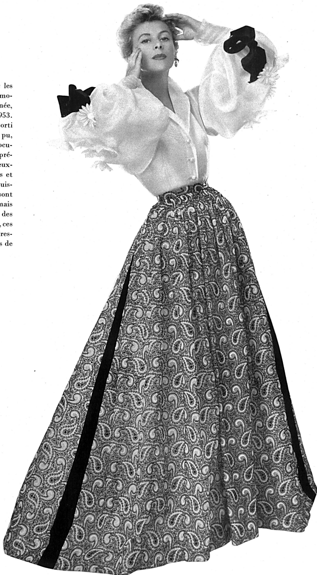
HUBERT DE GIVENCHY Dessin persan en broderie noire et jaune sur organdi de Walter Schrack & Co., St-Gall . Gros- siste à Paris : Châtillon Mouly Roussel.

Les documents publiés ici sur les pages 51 à 68 représentent des modèles de collections de cette année, précédant celle d'hiver 1952-1953. Notre dernier numéro étant sorti de presse en mai, nous n'avons pu, de ce fait, présenter déjà ces documents à nos lecteurs. Nous ne prétendons donc pas montrer à ceux-ci, de cette manière, des lignes et tendances de mode nouvelles, puisque les modèles en question sont dépassés à l'heure actuelle, mais illustrer la variété et la qualité des articles de St-Gall. En revanche, ces créations peuvent encore intéresser, en tant que telles, nos amis de l'hémisphère austral.