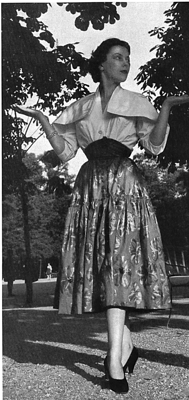
PAQUIN Percalé crêpée de Stoffel & Co., St-Gall.