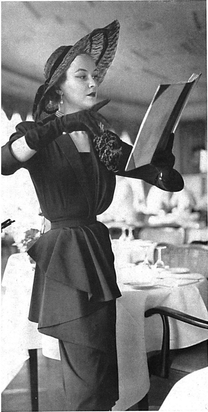
Faille pure soie de Heer & Cie S.A., Thalwil Confection : Algo S. A., Zurich.