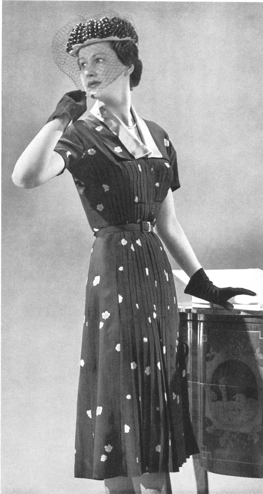
BRUYÈRE Rudolf Brauchbar & Cie, Zurich