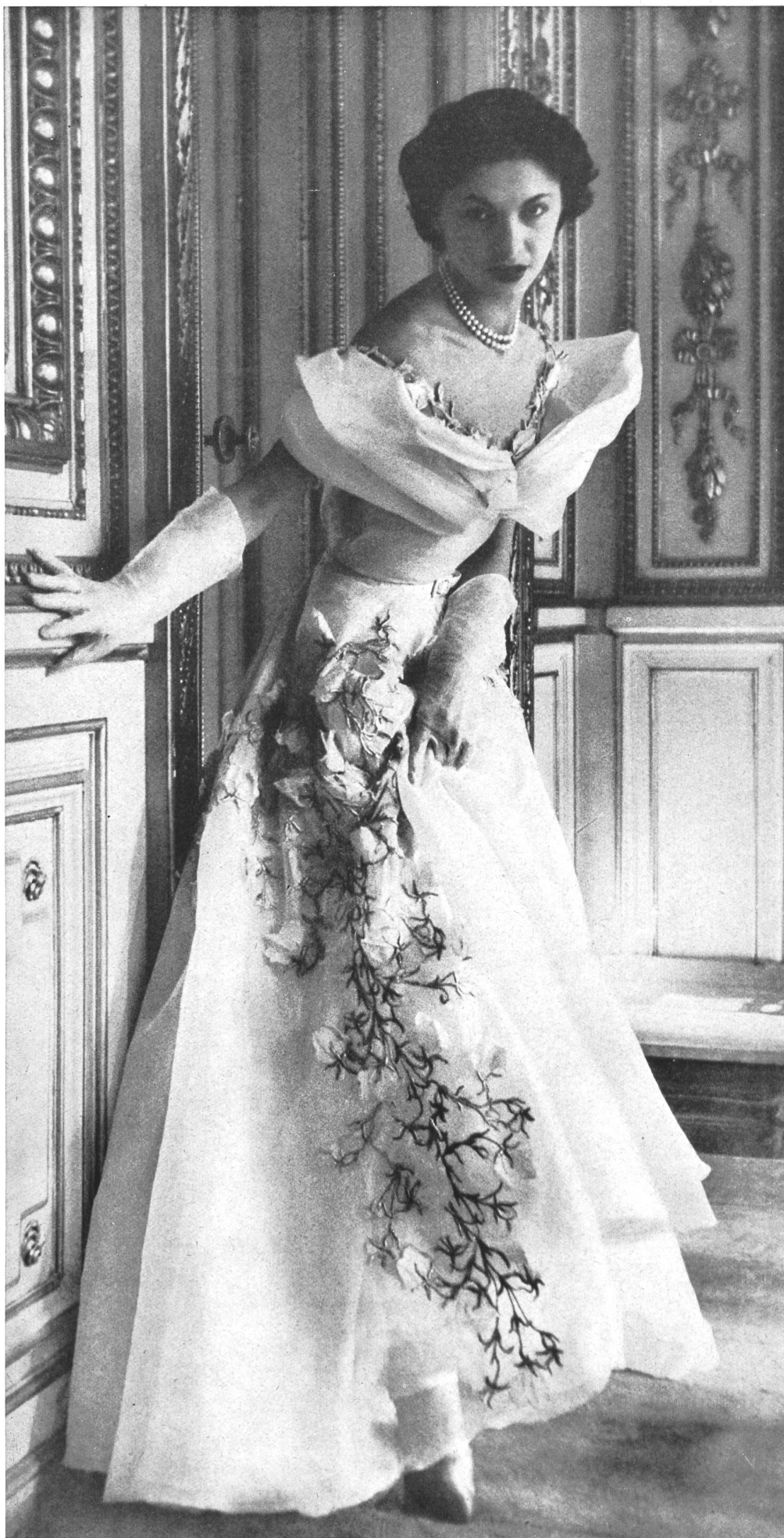
JEAN DESSÈS Forster Willi & Cie, St-Gall INAMO, ZURICH