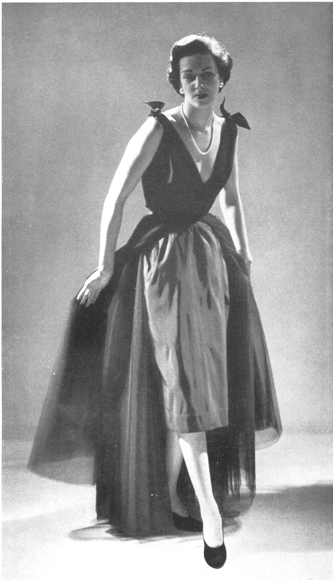
CHRISTIAN DIOR S. A. Stunzi Fils, Horgen