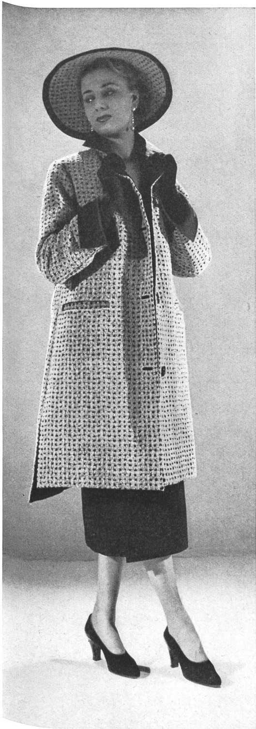
CHRISTIAN DIOR A. Naef & Cie, Flawil INAMO, ZURICH