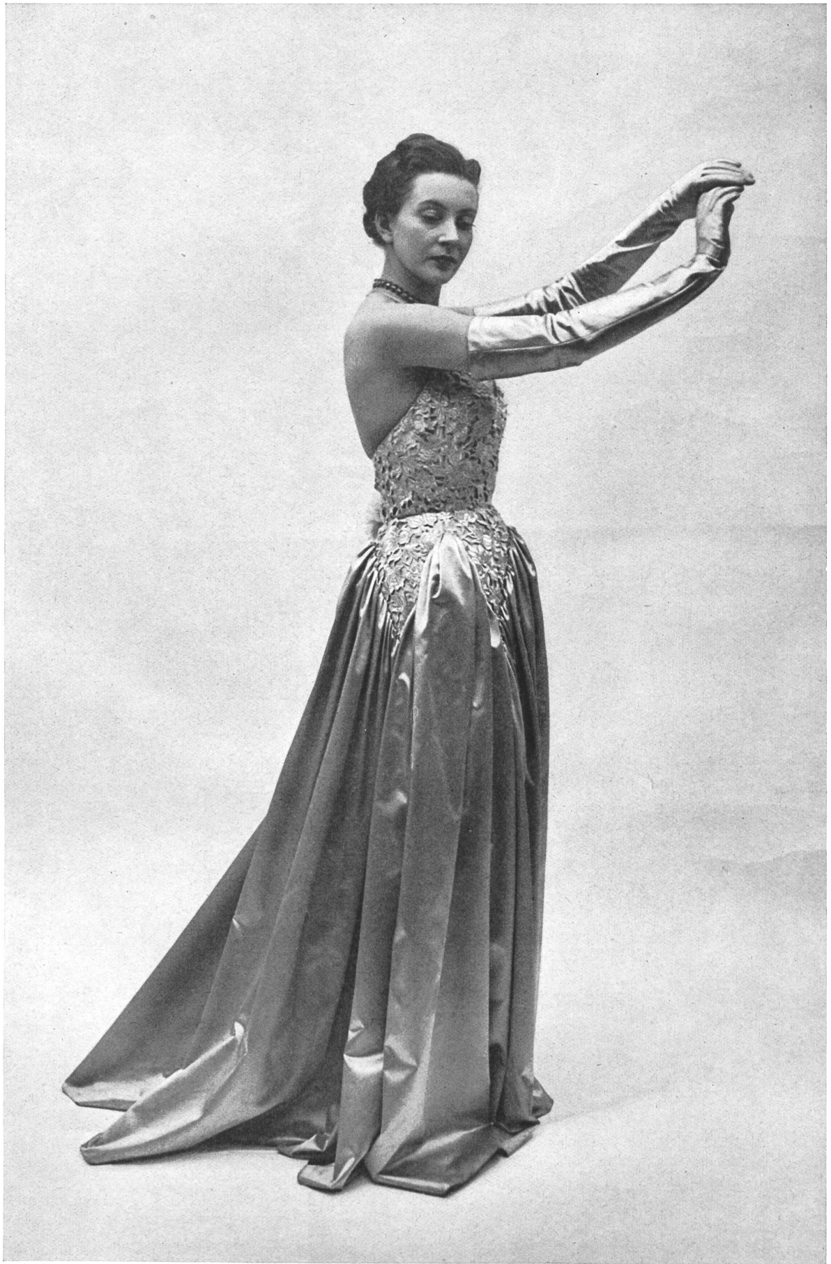
MOLYNEUX A. Naef & Cie, Flawil INAMO, ZURICH