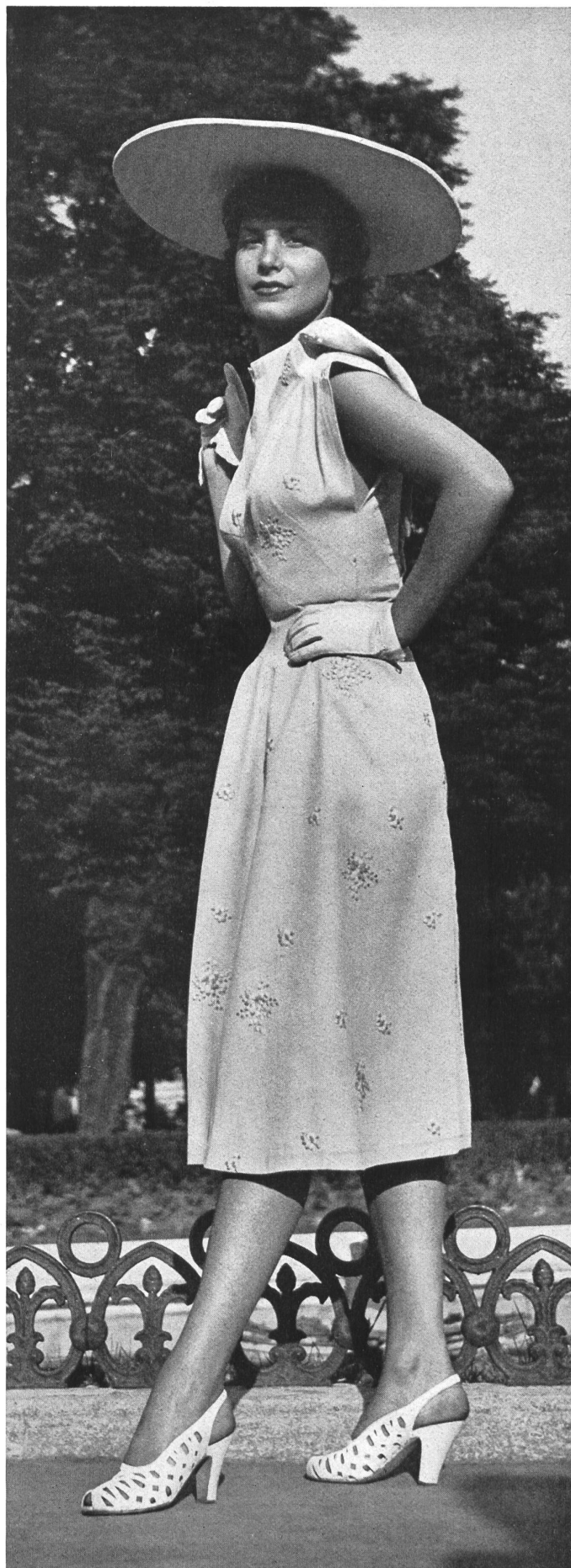
CARVEN Forster Willi & Cie, St-Gall THIÉBAUT-ADAM, PARIS