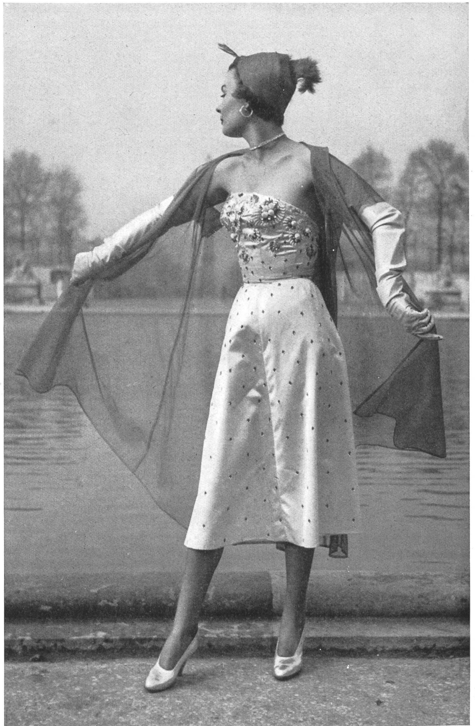
JACQUES FATH Union S.A., St-Gall PIERRE BRIVET FILS, PARIS