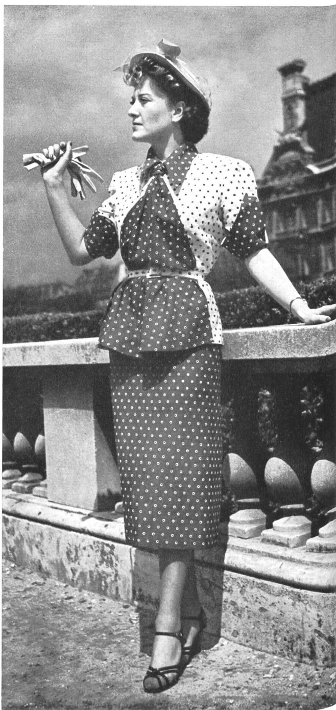
MARTIAL ET ARMAND Reichenbach & Co., St-Gall THIÉBAUT-ADAM, PARIS