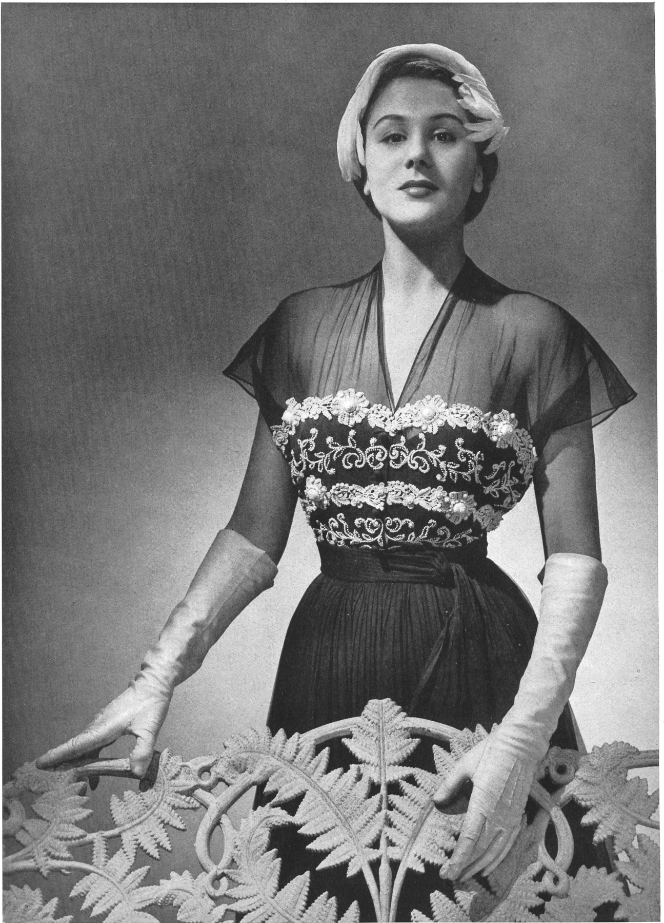
MARCEL ROCHAS Union S.A., St-Gall THIÉBAUT-ADAM, PARIS