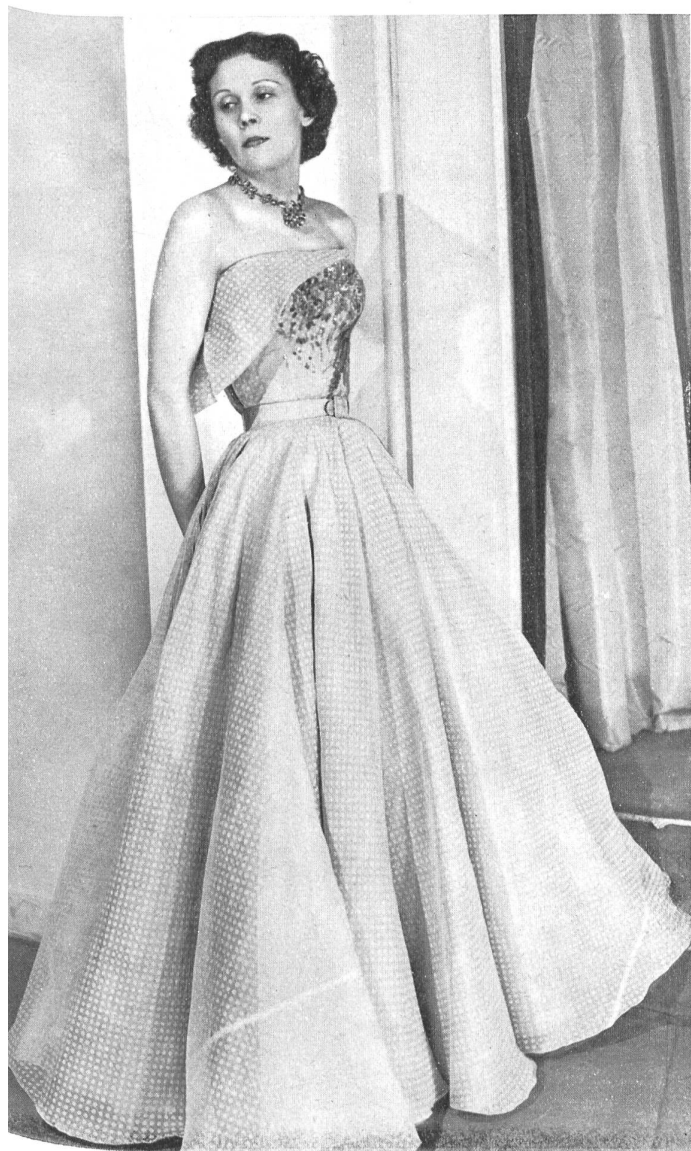
NINA RICCI Union S. A., St-Gall PIERRE BRIVET FILS, PARIS