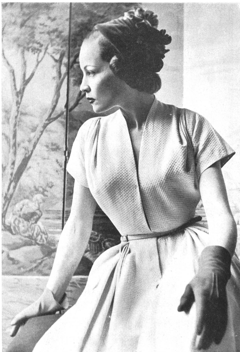
MANGUIN Stoffel & Cie, St-Gall INAMO, ZURICH