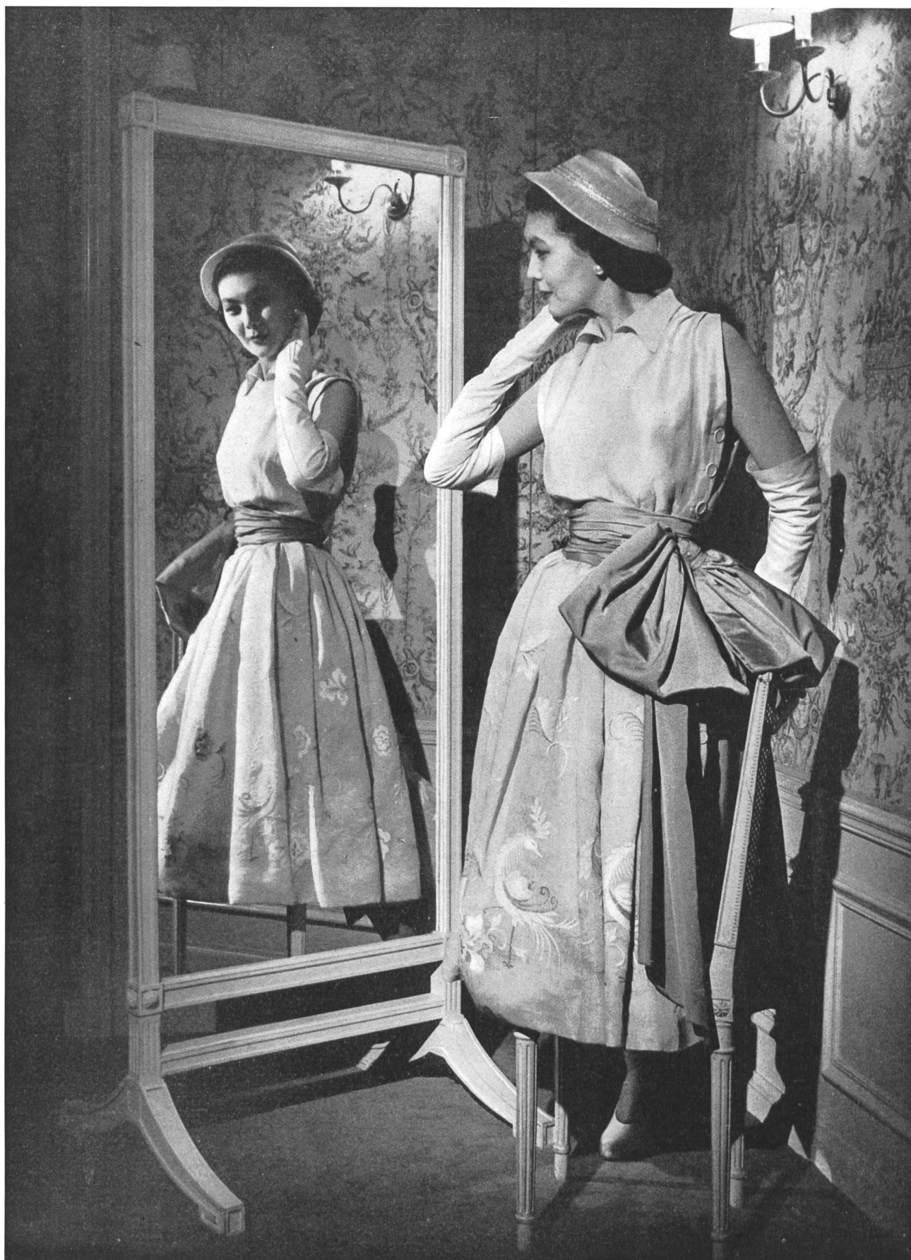
CHRISTIAN DIOR Forster Willi & Cie, St-Gall INAMO, ZURICH