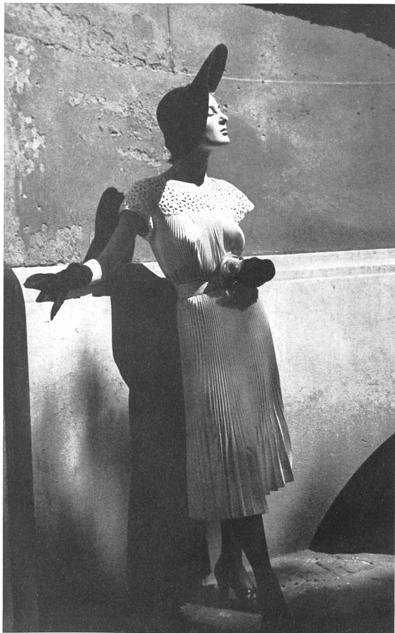
TRISTAN MAURICE Walter Schrank & Cie, St-Gall THIÉBAUT-ADAM, PARIS