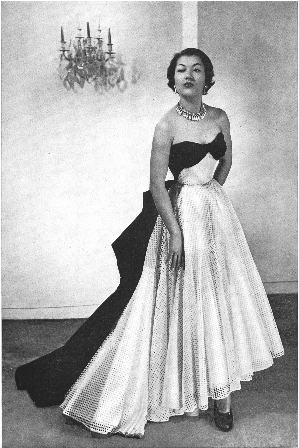
NINA RICCI J. G. Nef & Cie, Hérissau M. GUITRY, PARIS