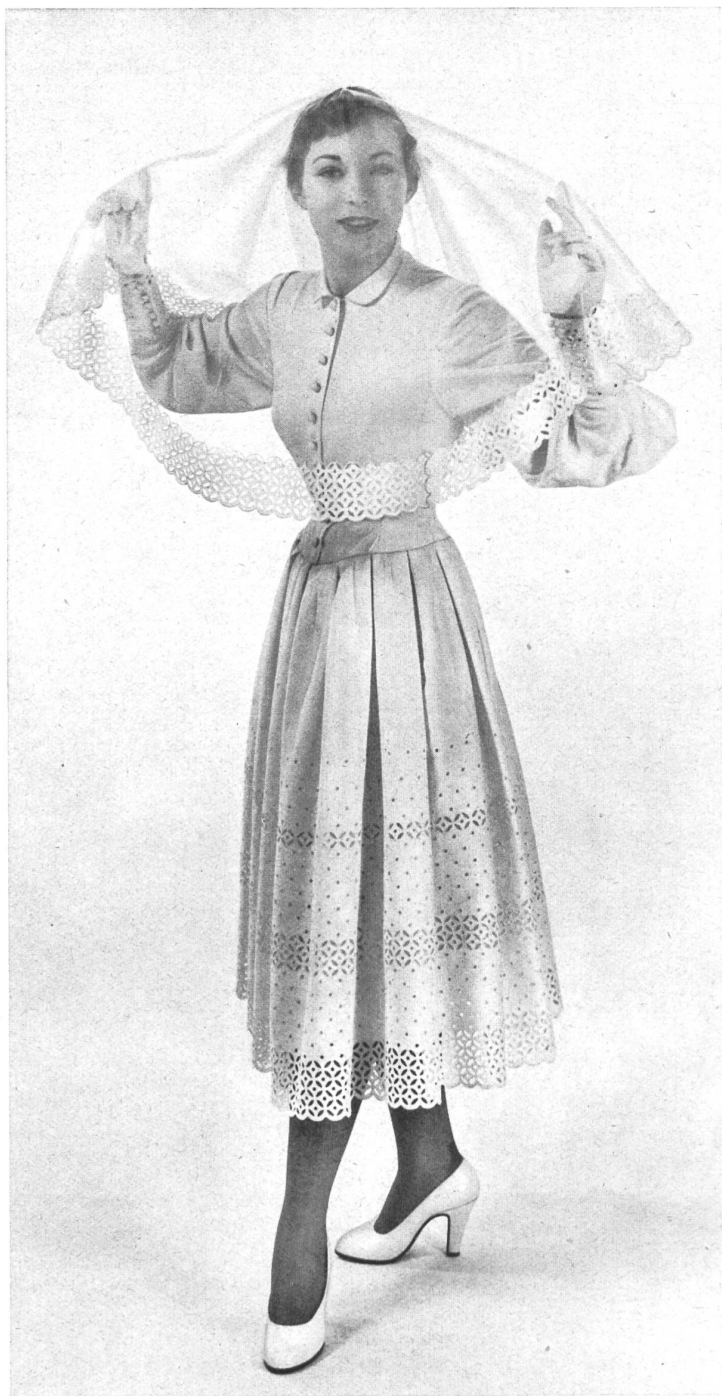
MARCEL ROCHAS Union S.A., St-Gall THIÉBAUT-ADAM, PARIS