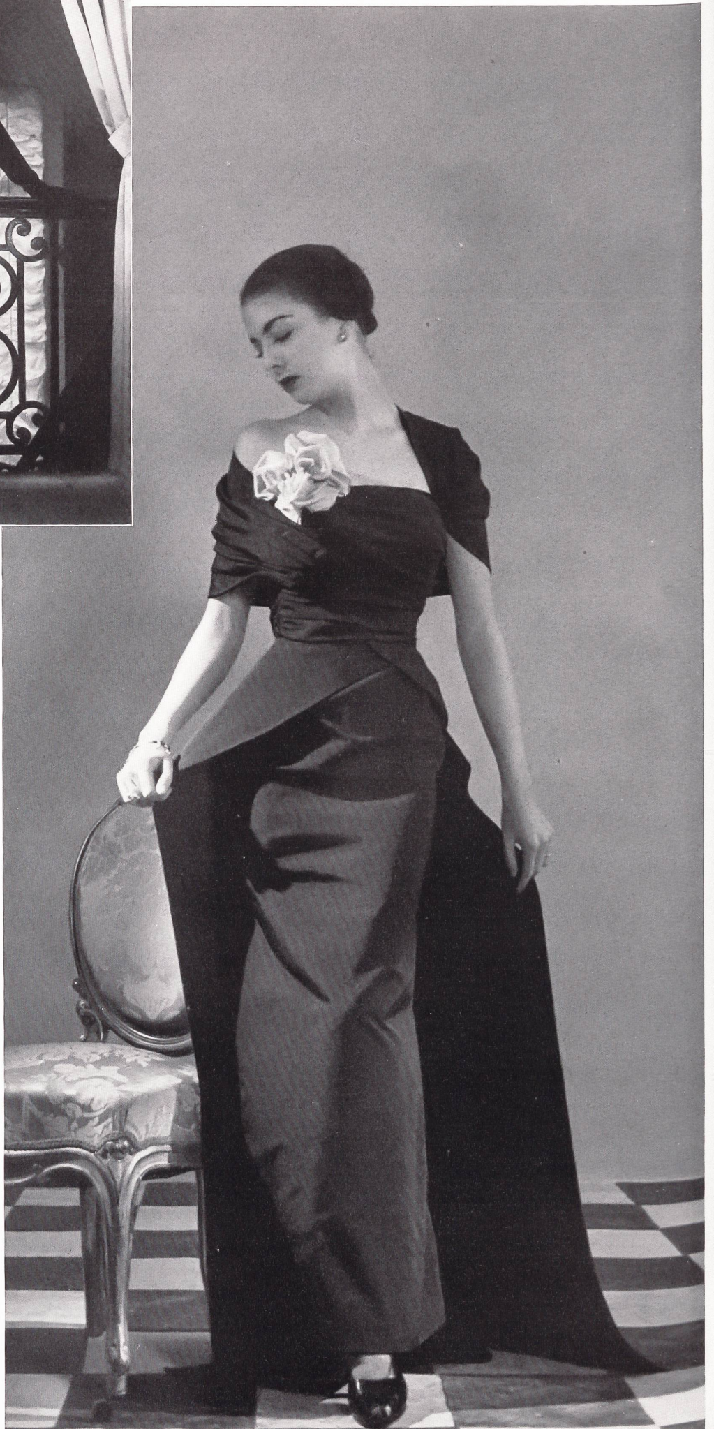
MOLYNEUX L. Abraham & Cie, Soieries S. A., Zurich