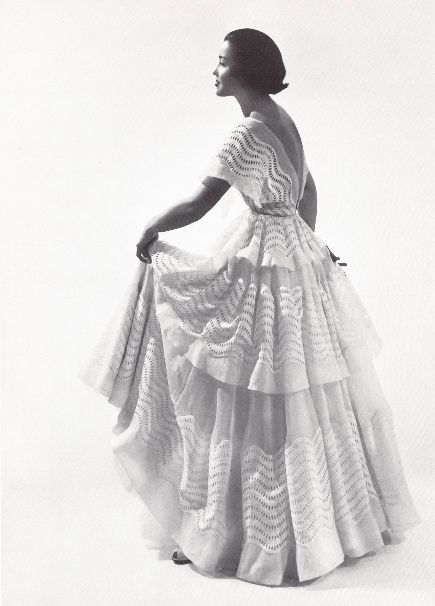
NINA RICCI J. G. Nef & Cie, Hérisau M. GUITRY, PARIS