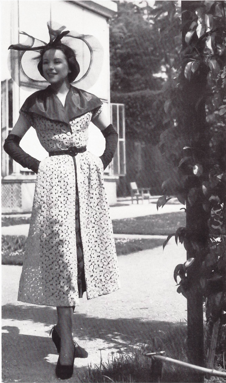
MARCEL ROCHAS Walter Schrank & Cie, St-Gall THIEBAUT-ADAM, PARIS