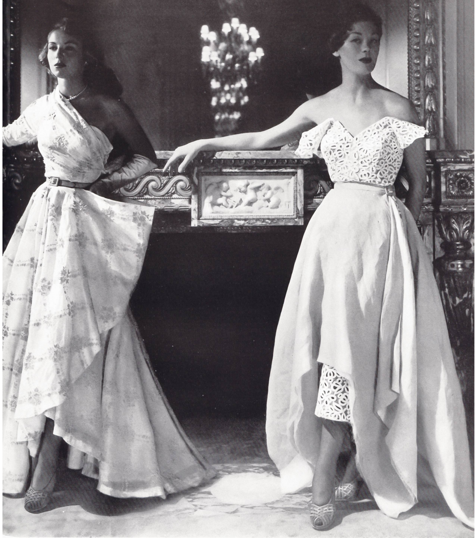
JEAN DESSÈS Walter Stark, St-Gall THIEBAUT-ADAM, PARIS