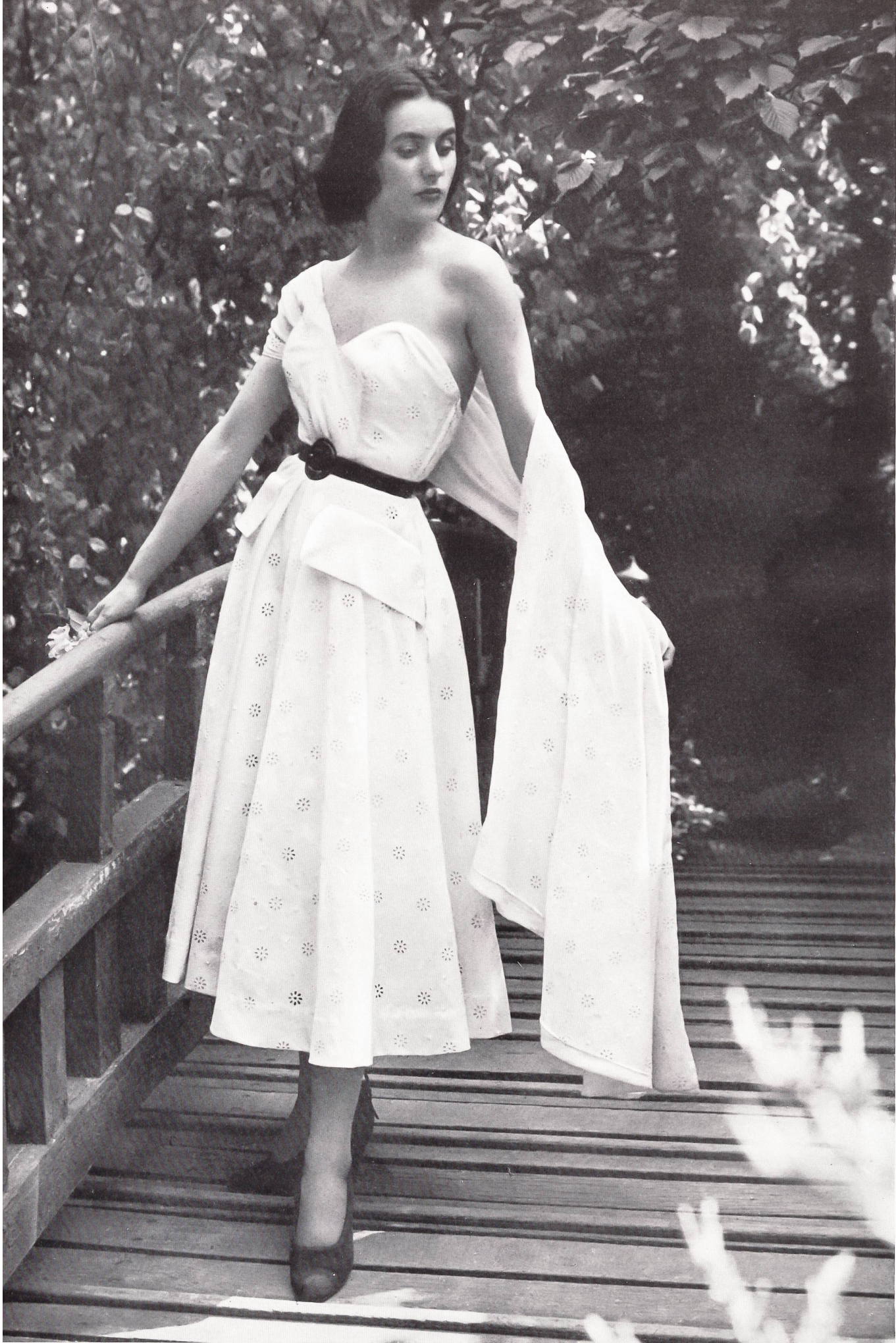
MARCEL ROCHAS Union S. A., St-Gall THIEBAUT-ADAM, PARIS