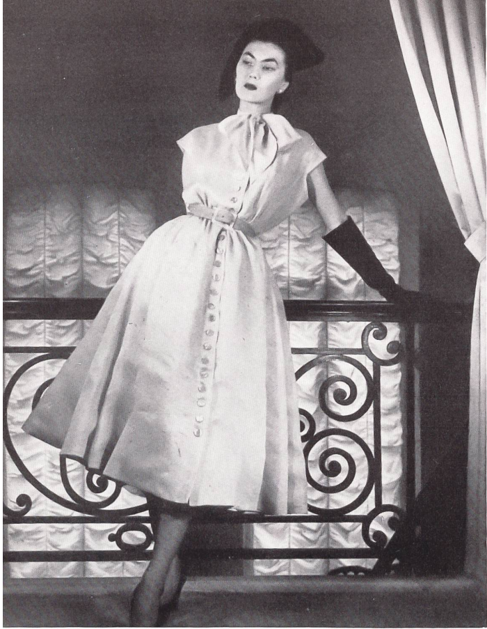
CHRISTIAN DIOR Heer & Cie S. A., Thalwil INAMO, ZURICH