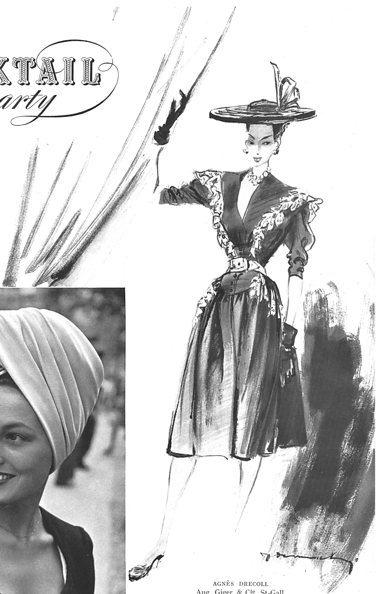
AGNÈS DRECOLL Aug. Giger & C ie , St-Gall Stoffel & C ie , St-Gall