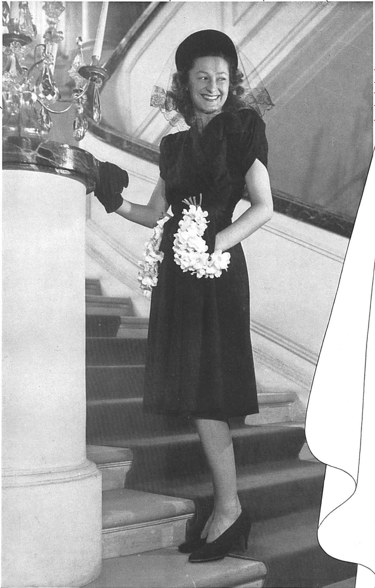
ROBERT PIGUET Strub & Cie, Zurich