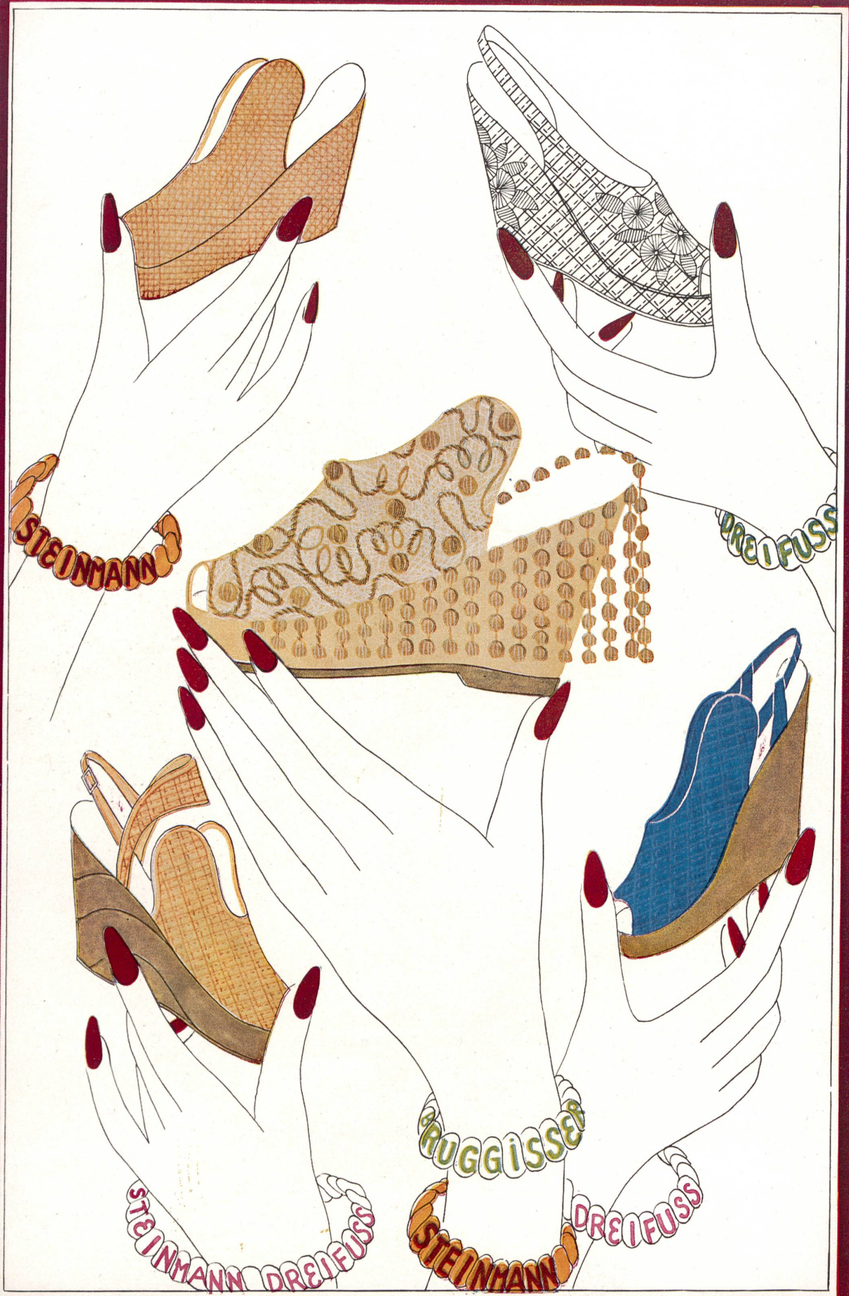
LÉANDRE Pailles de Wohlen