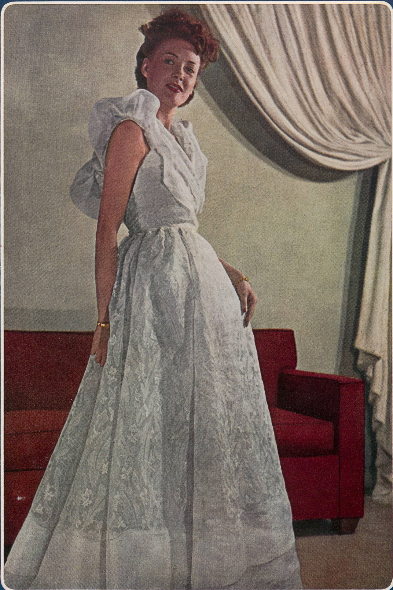
LUCIEN LELONG Union S.A., St-Gall