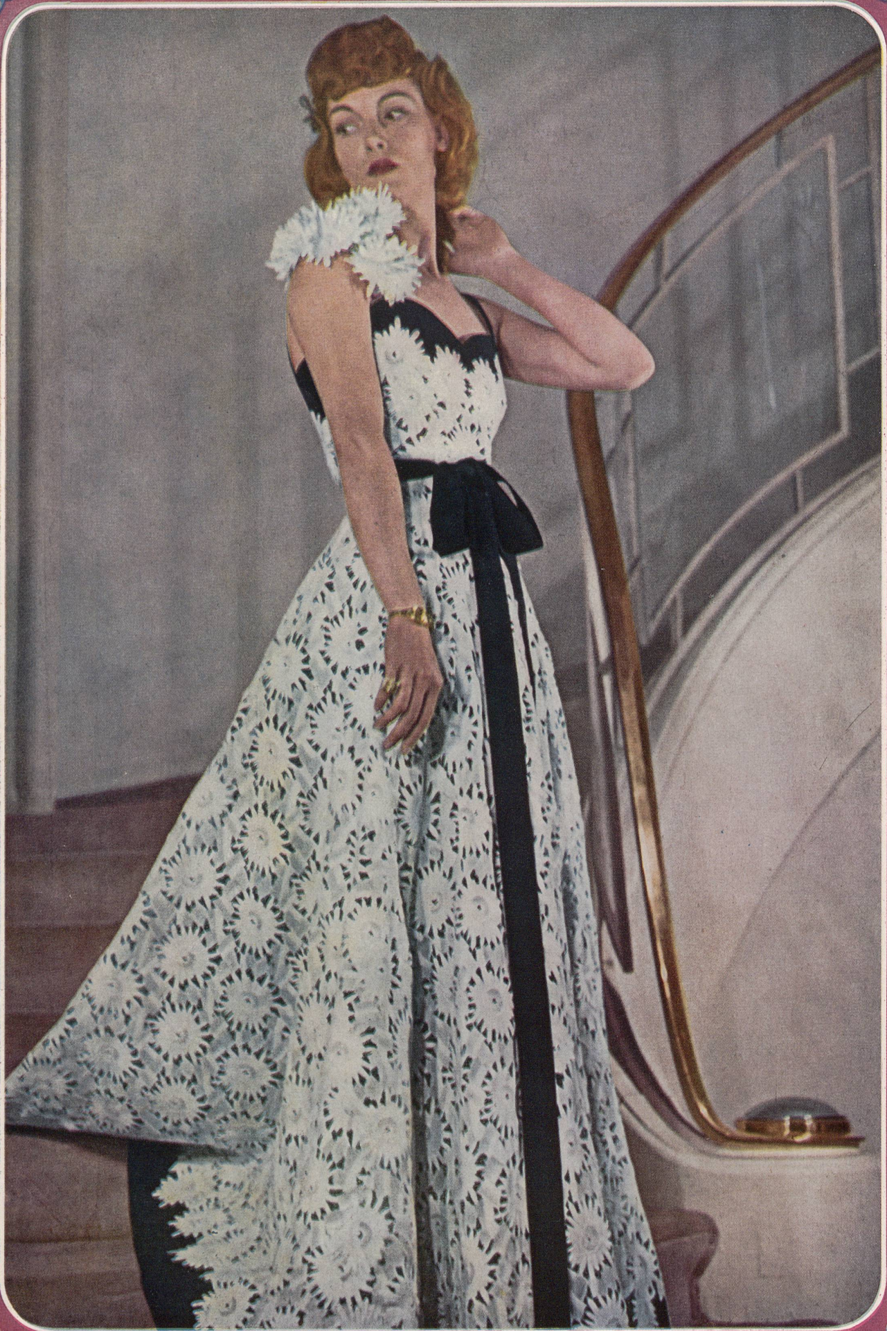
PAQUIN Union S.A., St-Gall