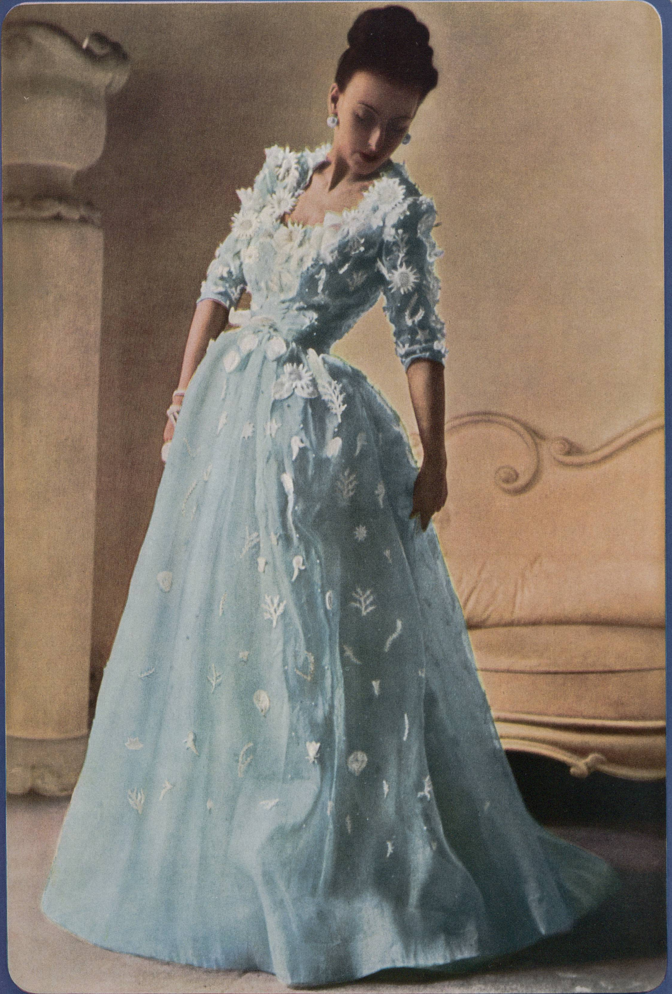
BALENCIAGA Aug. Giger & Cie, St-Gall