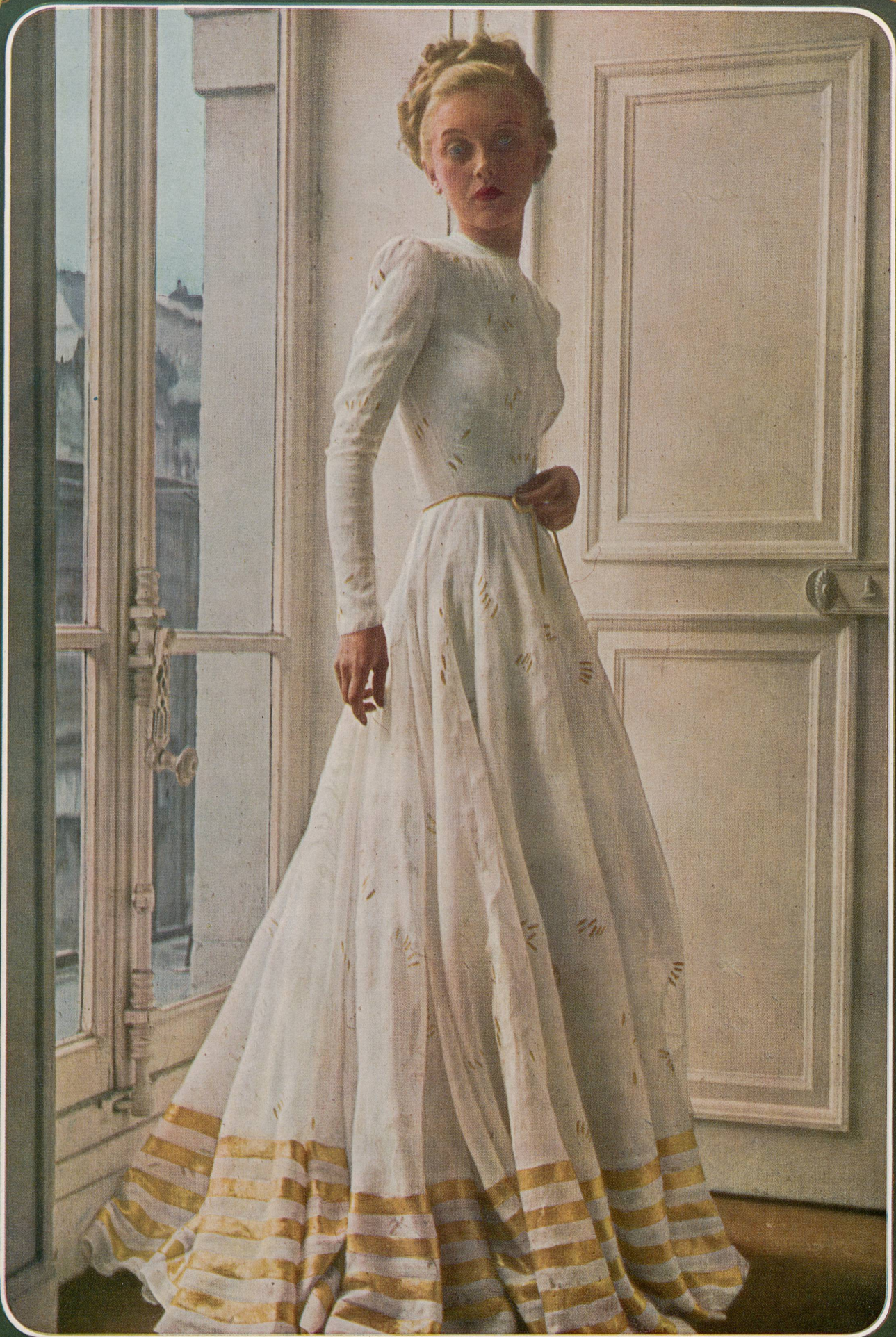
GRÈS Mettler et Cie S.A., St-Gall