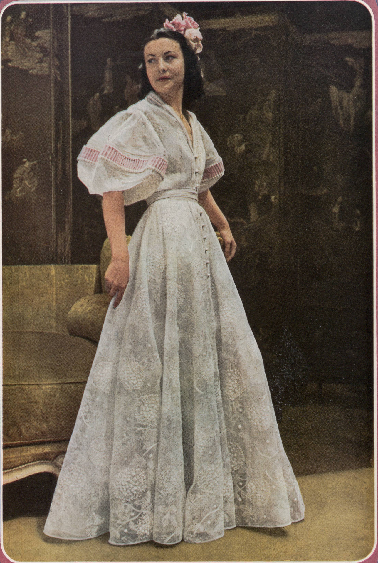
BRUYÈRE Reichenbach & Cie, St-Gall