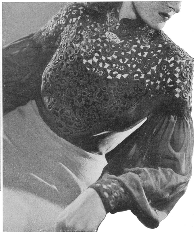
Blouse in lace manufactured by Bischoff & Muller, St. Gall. Model by Rey, Geneva. Blusa : Bischoff & Muller, San Gall : encaje. Modelo Rey, Cinebra. Blusa : Bischoff & Muller, St. Gall : renda. Modèlo Rey, Genebra.