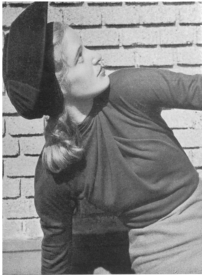
Blouse in "Alpinit" wool jersey manufactured by Ruepp, Sarmenstorf. Model by Scheidegger-Mosimann, Berne.