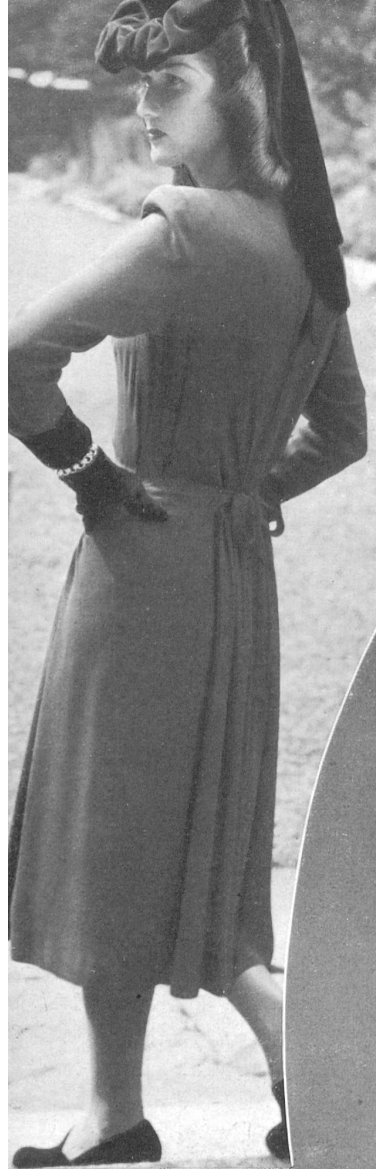
The gown is in silk crêpe satin romain by Stunzi Sons, Horgen. Model by Sauvage Couture, Basle. Vestido : Stunzi Fils, Horgen : crepe satén romano, seda. Modelo Sauvage Couture, Basilea. Vestido : Stünzi Fils, Horgen : Crepe setim romano, seda. Modelo Sauvage Couture, Basilea.