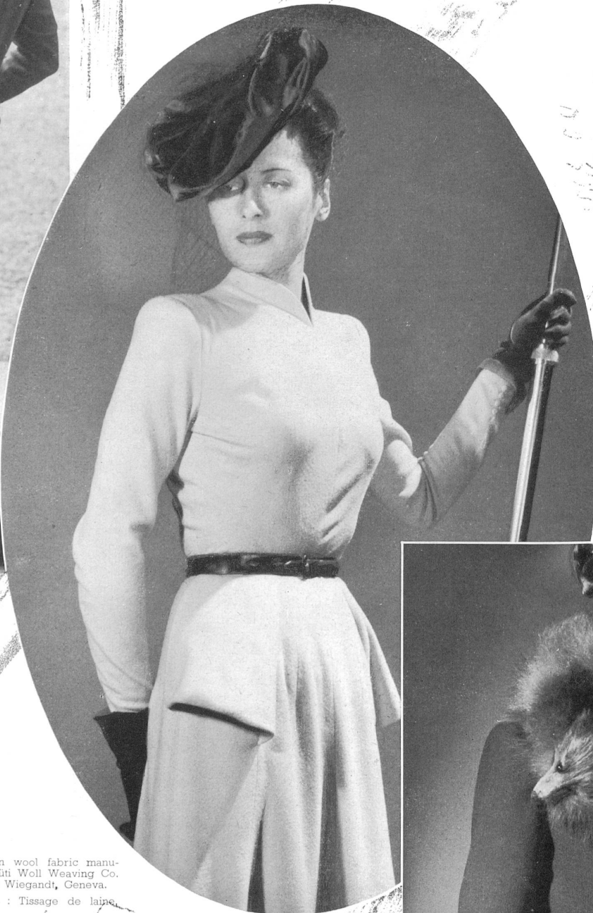
Coat and frock in wool fabric manu- factured by the Rütli Woll Weaving Co. Model by Andrée Wiegandt, Geneva. Abrigo y vestido : Tissage de laine, Rütli : lana. Modelo Andrée Wiegandt, Ginebra. Casaco e vestido : Tissage de laine, Rütli : lã. Modelo Andrée Wiegandt, Genebra.