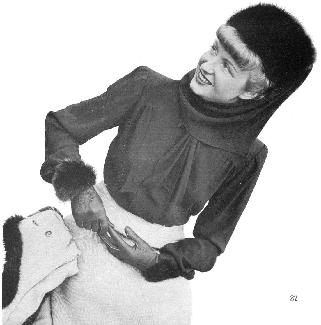
Blouse in "Southwind Crêpe" from Stünzi Sons, Horgen : rayon.