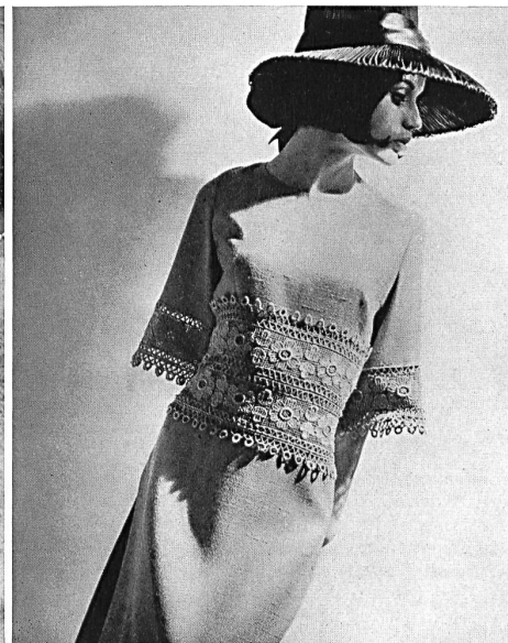
4 Cette demoiselle dirige la vente dans un grand secteur d'outre-mer, où elle présente la collection de broderies à la clientèle