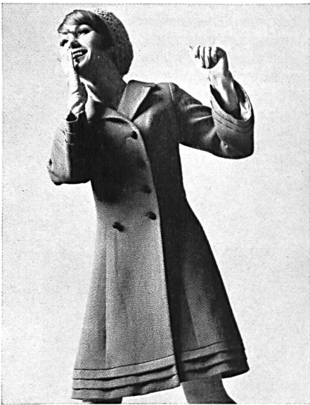
▲ « Vestan » Tissu peigné grosse côte en Vestan et 45 % de pure laine de tonte Tissu Heer & Cie S.A., Thalwil (Zurich) Modèle J. Freimann, Zurich