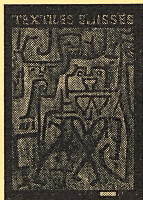
NOTRE COUVERTURE Voir page 117