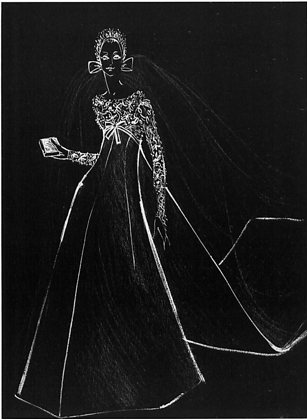
Magnifique robe de mariée; haut et manches avec applications de broderies de: Superb wedding gown; top and sleeves with superimposed applications of lace by: FORSTER WILLI & CO., SAINT-GALL Rahvis, London

de grands tartans et de chaudes doublures de fourrure, il sait marcher avec son temps et répond à la demande de prix beaucoup plus bas par une seconde collection de couture, une série spéciale d'ensembles chics et utiles ne demandant qu'un seul essayage avant d'être livrés, une semaine après la commande. Son Petit Salon est comme d'habitude richement assorti pour l'automne en costumes aux teintes vives, défiant la pluie, et en élégantes petites robes de cocktail et de dîner.