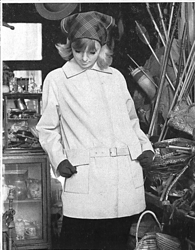
3 STOFFEL LTD., SAINT-GALL Tissu Aquaperl à finissage hydrofuge et antitaches Scotchgard Aquaperl fabric with Scotchgard rain and stain repeller finish Modèles: (à gauche / left) Heptex Ltd., Leeds (à droite / right) Cotsmoor Ltd., London