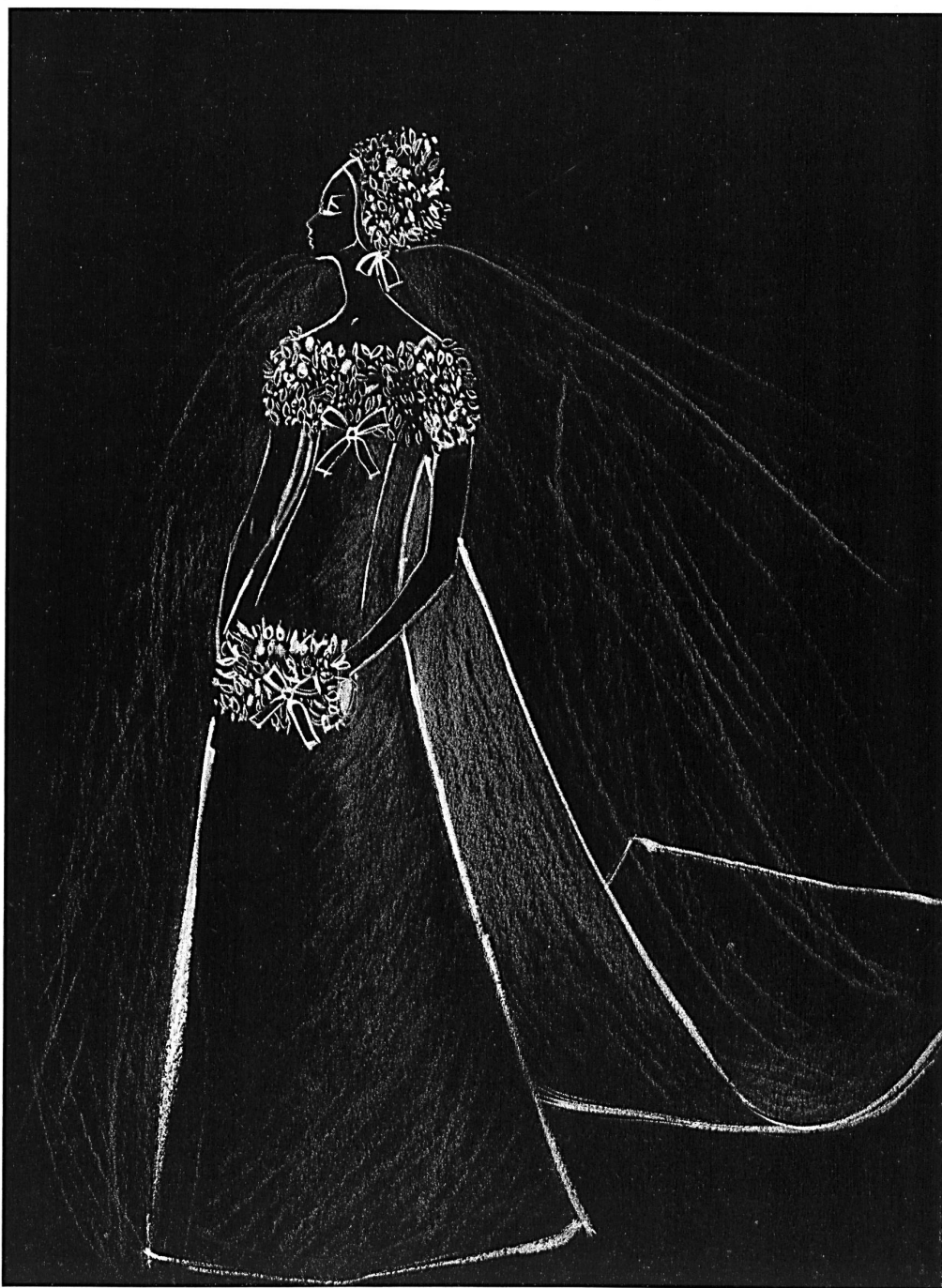
Robe de mariée en organza ivoire, avec guipure de: Bridal gown in ivory organza with guipure lace by: