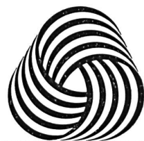
PURE LAINE VIERGE

L'IWS (International Wool Secretariat) ou Secrétariat international de la laine est un organisme de propagande, soutenu par deux cent mille producteurs de laine d'Australie, de Nouvelle-Zélande et d'Afrique du Sud. Il s'attache, non pas à répandre l'usage de la laine, puisque la production de cette fibre ne peut pas être indéfiniment augmentée, mais à améliorer les qualités d'usage de celle-ci et à les faire connaître. Conjointement, il s'efforce de protéger la réputation de la laine de tonte contre le tort que peut lui faire l'usage d'une laine de basse qualité (aujourd'hui, plus spécialement, laine de récupération) dont les caractéristiques ne correspondent plus à ce qu'on est en droit d'en attendre aujourd'hui. C'est à cet aspect-là de l'activité de l'IWS qu'était consacrée une récente conférence de presse, au cours de laquelle les principaux collaborateurs du bureau de Zurich de l'IWS présentèrent aux représentants de la presse suisse la nouvelle marque internationale (voir ci-dessus) protégeant les produits de pure laine vierge. Cette marque a déjà été enregistrée dans plus de quatre-vingt-dix pays et s'applique sur-