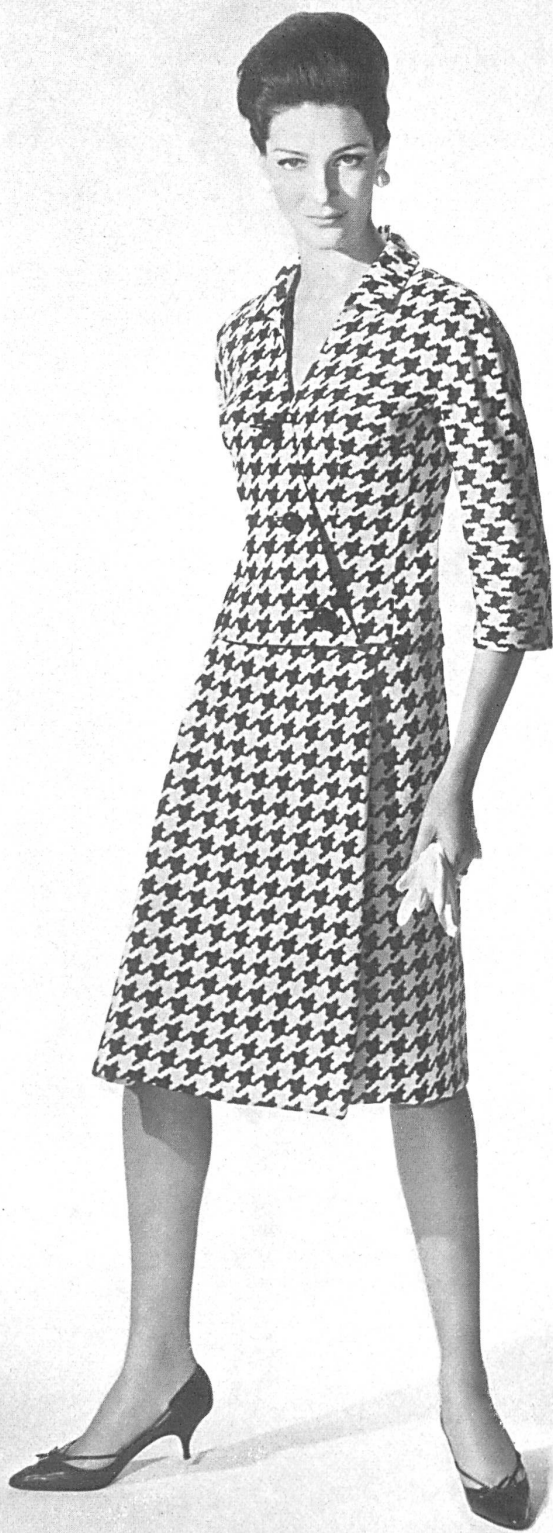
METTLER & CIE S.A., SAINT-GALL Tissu fibranne imitation lin imprimé Printed linen imitation staple fibre fabric Modèle Helga, Los Angeles

la façon « beatnik » de mettre en œuvre une élégante broderie chenille de Forster Willi.