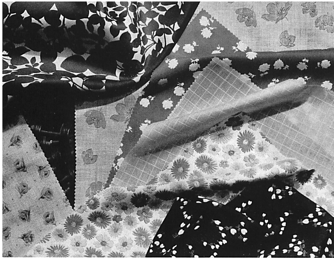
« BERCO », BAERLOCHER & CO., RHEINECK (SAINT-GALL)

Un bel assortiment de tissus fins pour lingerie de dames et blouses : batiste tissée fantaisie et tissus imprimés tels que batiste pur coton, batiste coton/Hélanca, crêpe de laine, crêpe écorce, popeline et satin de coton