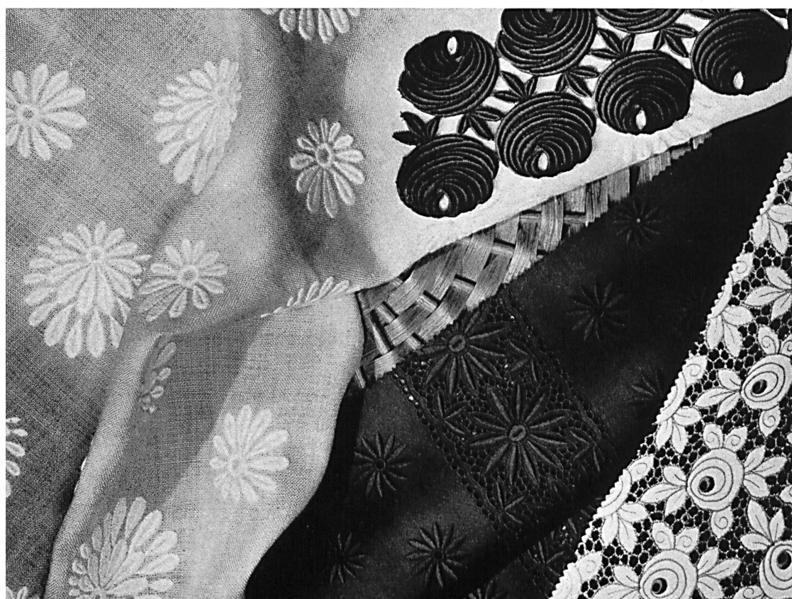
JACOB ROHNER S.A., REBSTEIN (SAINT-GALL)

Bestickte Allovers auf Leinen-Imitat und Minicare Satin ; Satin-Bordüre Minicare ; Galon, Guipure-Imitat