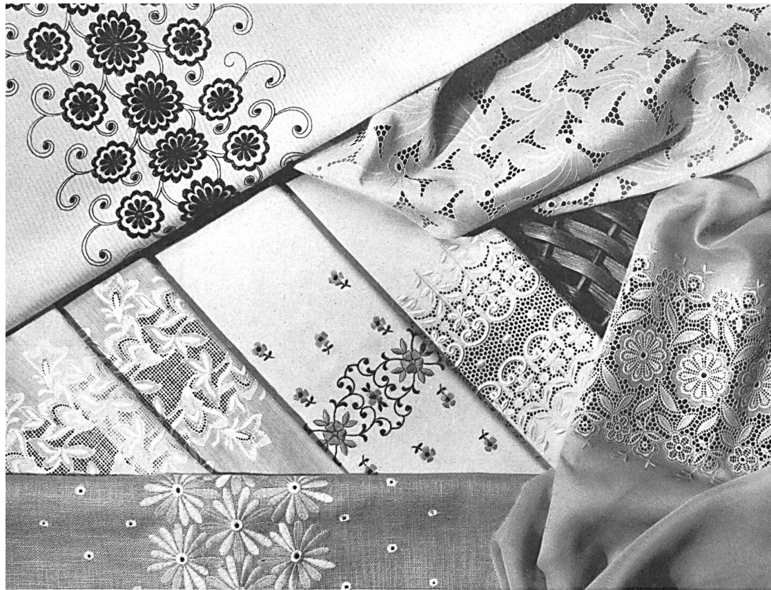
« ERHUCO », EUGSTER & HUBER S.A., SAINT-GALL

Laize brodée sur batiste Minicare, bordures brodées et devants de blouses en diverses exécutions sur piqué, georgette de Térylène, imitation lin, satin de coton, popeline et « Sedusa » schappe quality