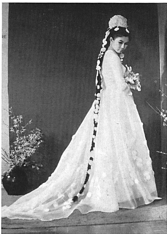
Robe de mariée, 1 er prix, Ecole de Mode de Kingston (Surrey); tresse ornée d'applications de broderie