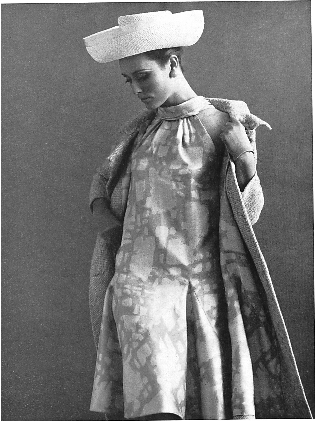
PIERRE CARDIN Twill de soie imprimé des Tissages de Soieries Naef Frères S.A., Zurich