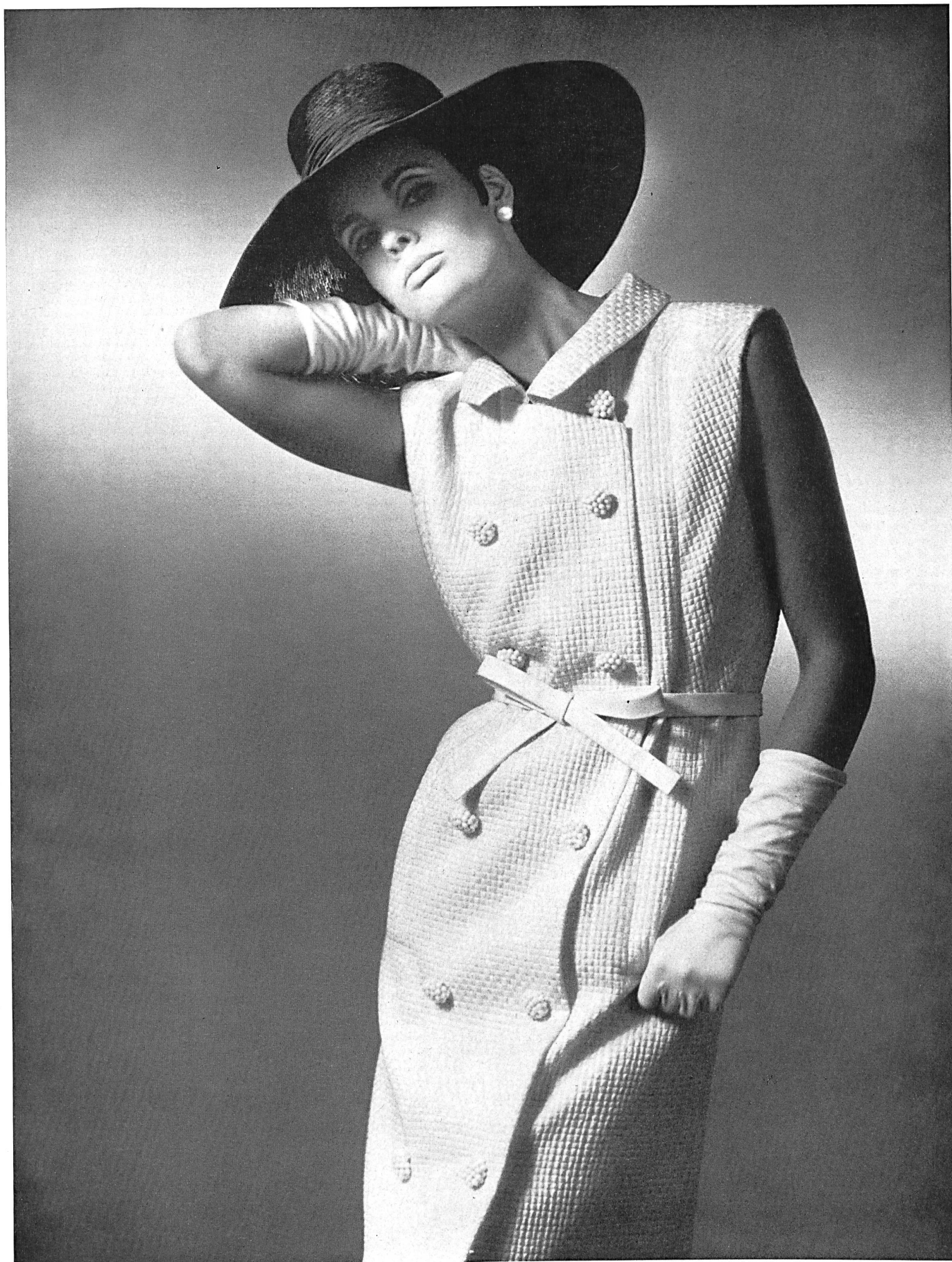
CHRISTIAN DIOR Façonné «Tanea» blanc, de L. Abraham & Cie, Soieries S.A., Zurich