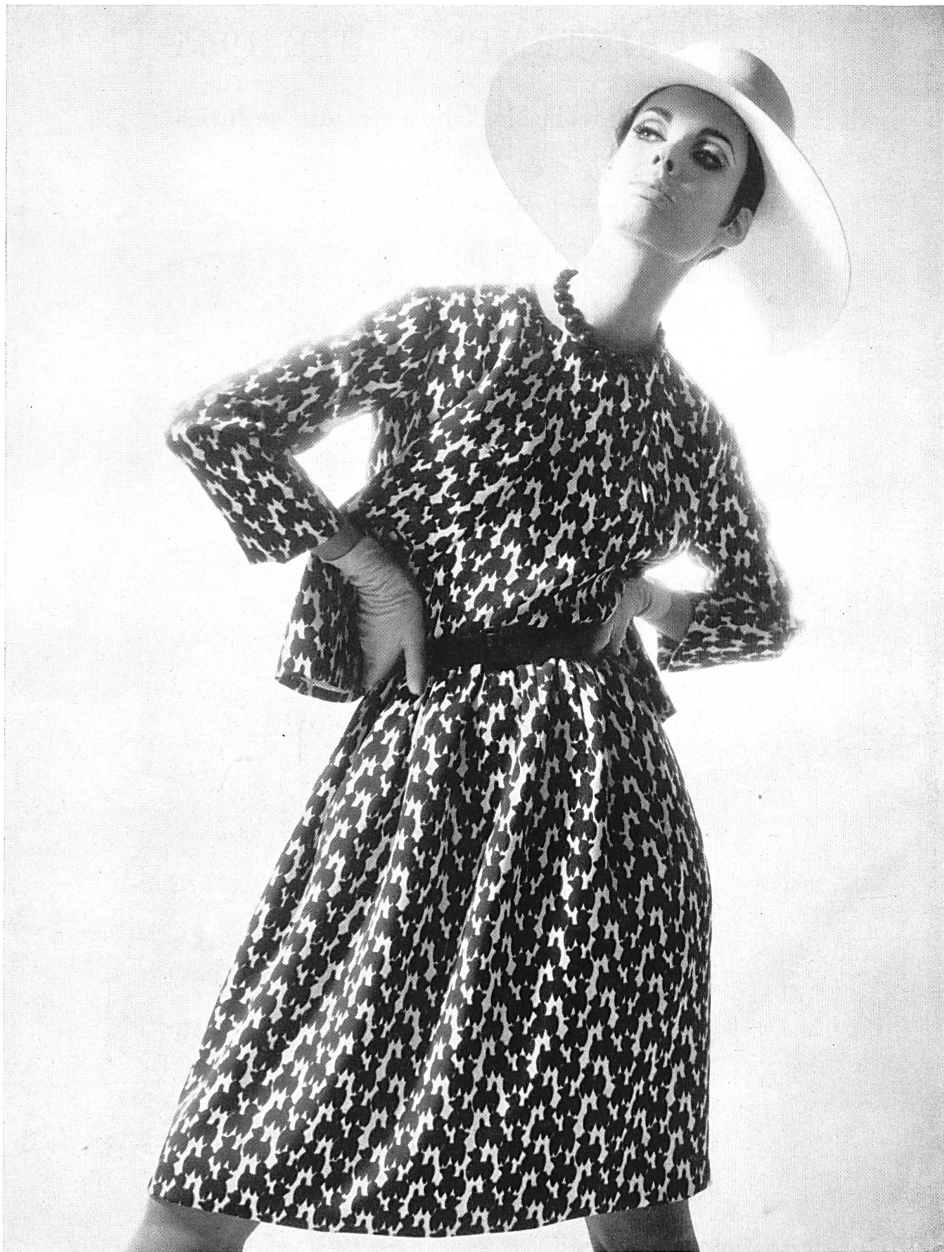
CHRISTIAN DIOR Crêpe «Charade» imprimé marine et blanc, de L. Abraham & Cie, Soieries S.A., Zurich