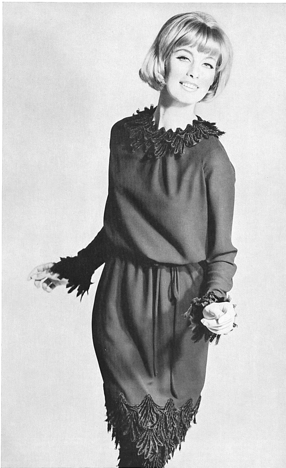
A. NAEF & CIE S.A., FLAWIL Broderie chenille noire Schwarze Chenillestickerei Modèle Toni Schiesser, Frankfort s. I. Main