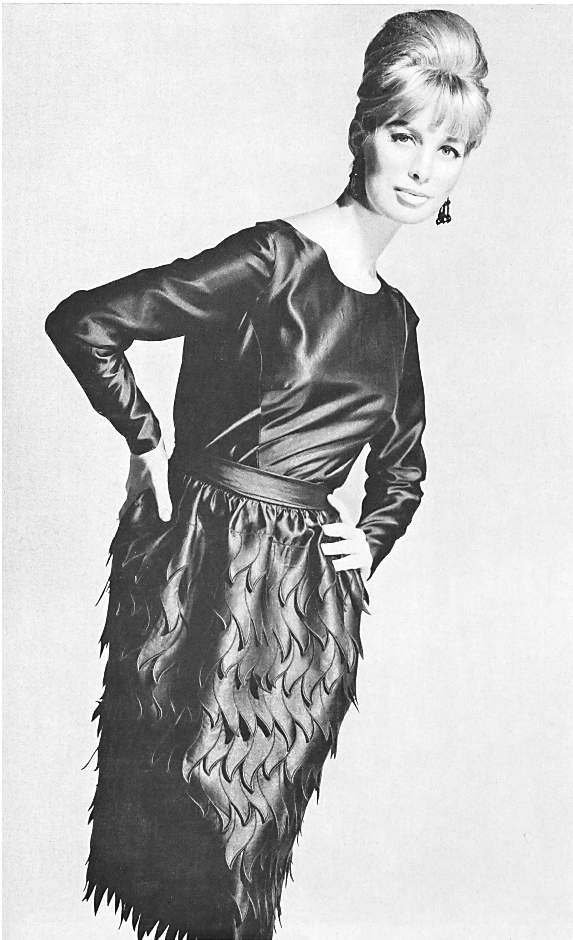
A NAEF & CIE S.A., FLAWIL Broderie / Stickerei Modèle Toni Schiesser, Frankfurt s. l. Main