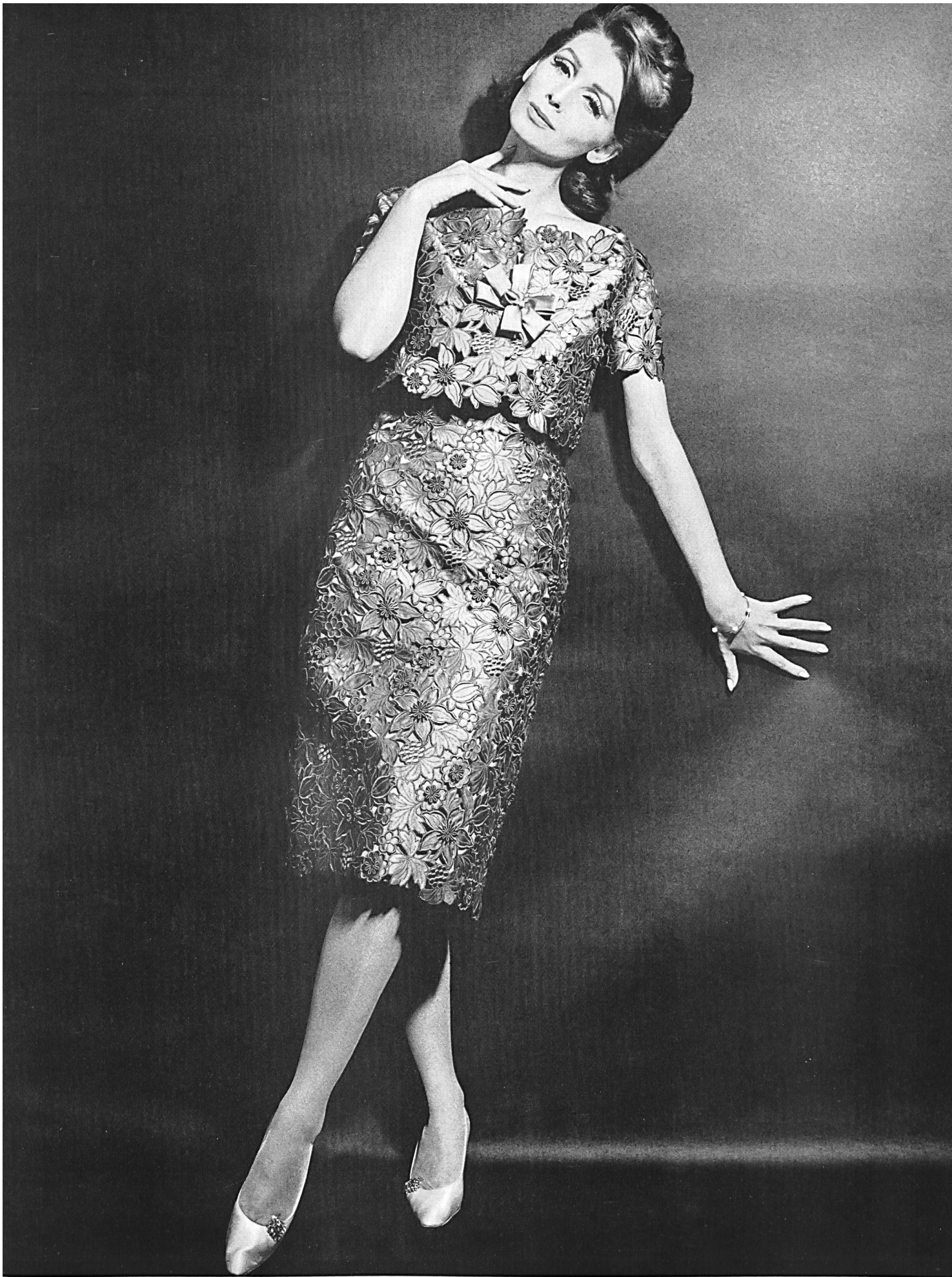
UNION S.A., SAINT-GALL Broderie découpée sur soie Seiden-Spachtelspitze Modèle Toni Schiesser, Francfort s. l. Main