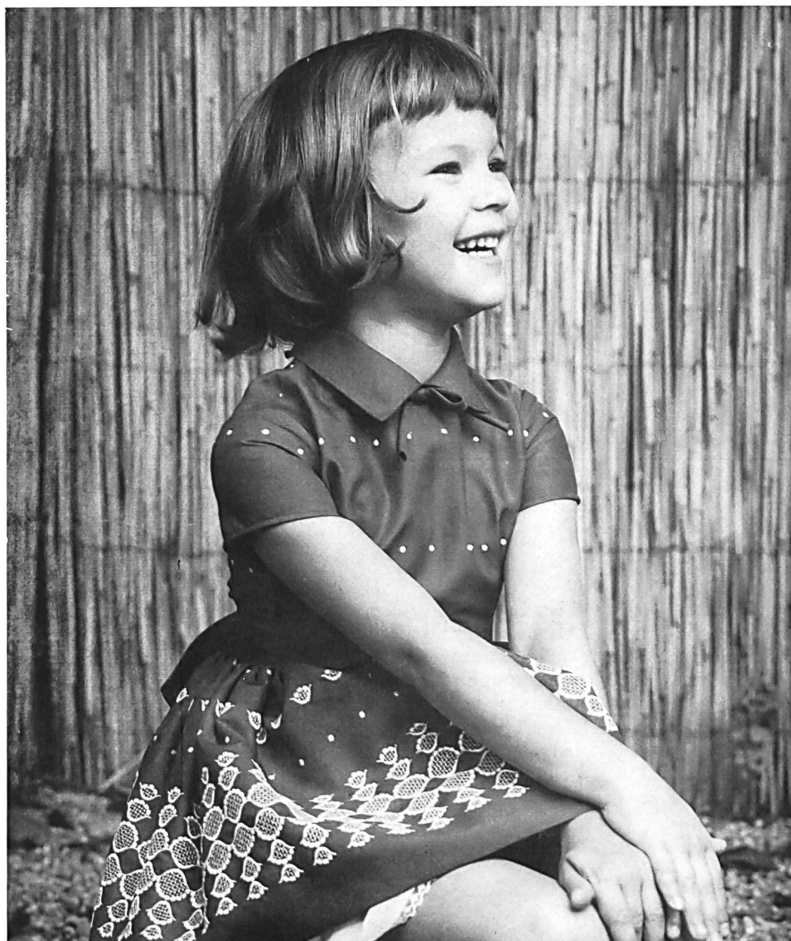
« RECO », REICHENBACH & CO. S.A., SAINT-GALL

Tissu avec effets de côtes Gewebe mit Côtelé-Effekt Modèle Wollenschläger & Co. GmbH., Baden-Baden