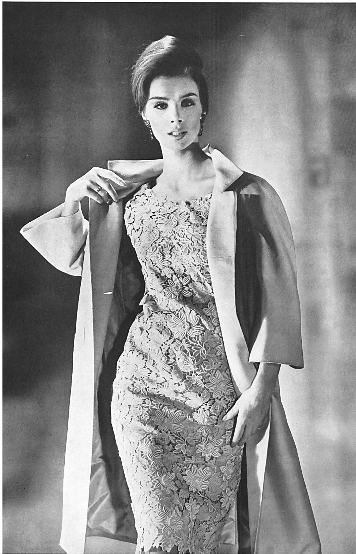
UNION S.A., SAINT-GALL Guipure lourde avec appli- cations Reiche Ätztickerei mit Applikationen Modèle Detlev Albers. Berlin