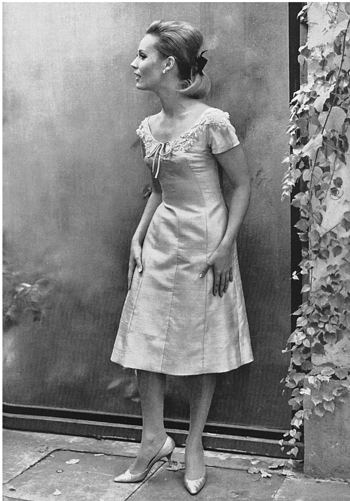
RUDOLF BRAUCHBAR & CIE S.A., ZURICH Zanzibar, pure soie / pure silk / seda pura / reine Seide Modèle Schwichtenberg & Co., Berlin

tiques. La quantité des fibres produites par la chimie et des combinaisons que l'on peut pratiquer entre elles ou avec des fibres naturelles, sous plus de cent noms différents, a fait de ce domaine un maquis dans lequel les spécialistes même ne se retrouvent plus.