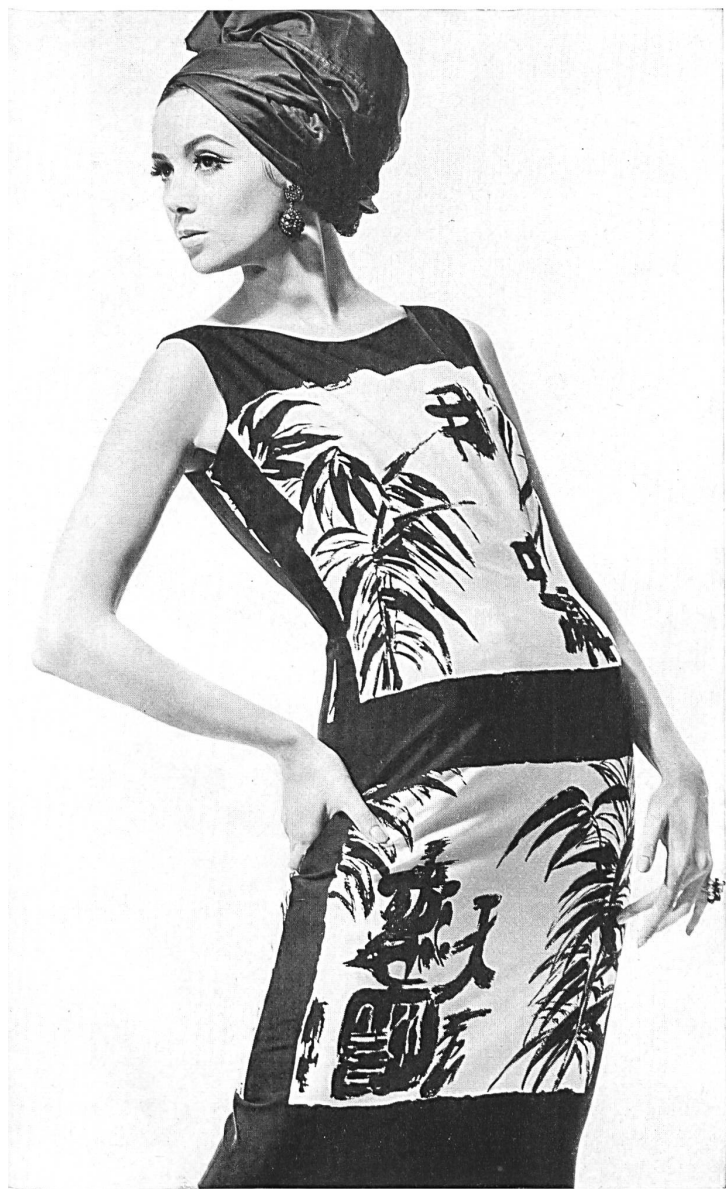
HEER & CIE S.A., THALWIL Panama de coton imprimé Baumwoll-Panama, bedruckt Modèle Lürman & Co., Rottach am Tegernsee