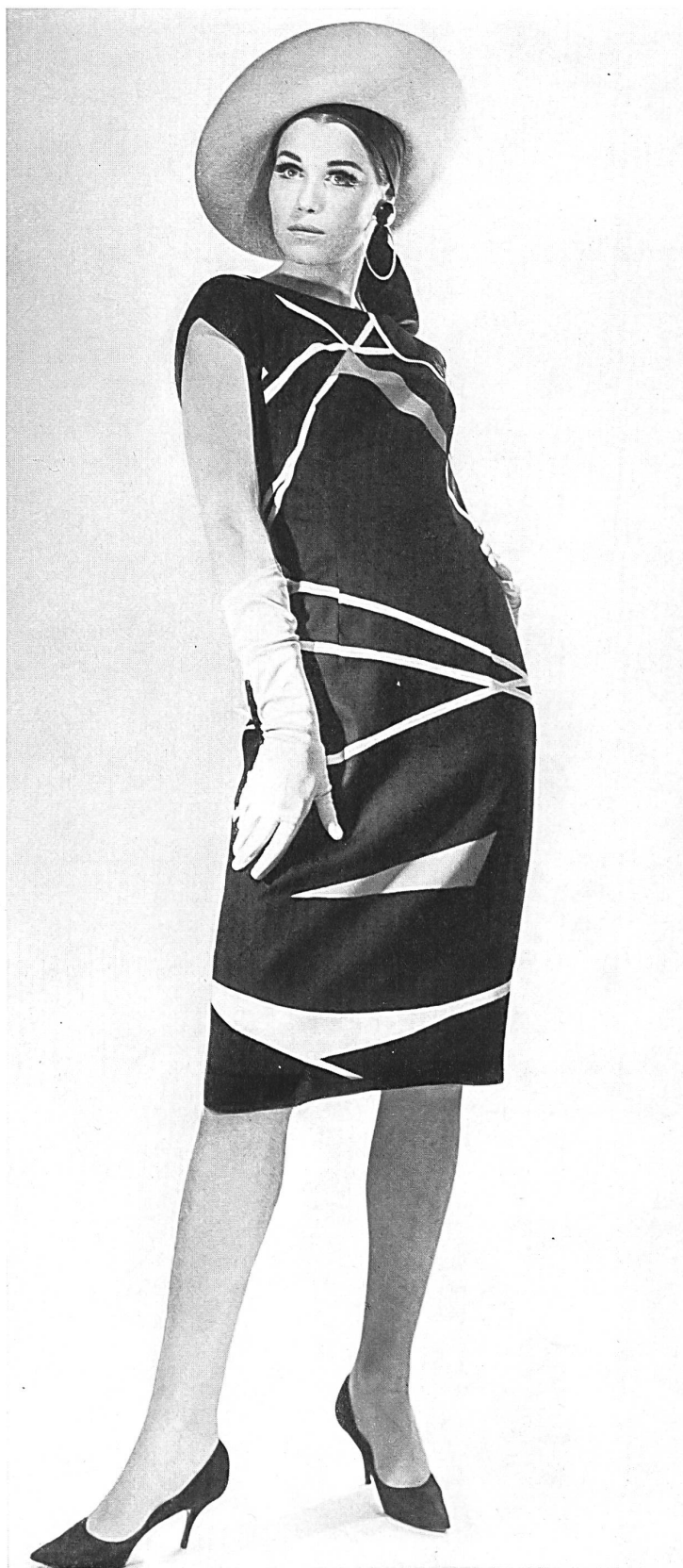
HEER & CIE S.A., THALWIL Panama de coton imprimé Baumwoll-Panama, bedruckt Modèle Lürman & Co., Rottach am Tegernsee