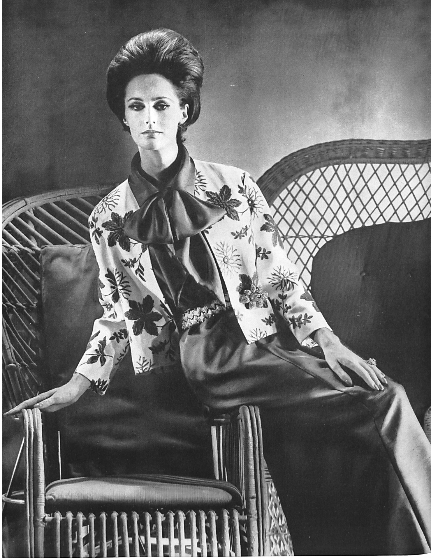
FORSTER WILLI & CO., SAINT-GALL Piqué de coton brodé (jaquette) Bestickter Baumwollpiquee (Jacke) Modèle Uli Richter, Berlin