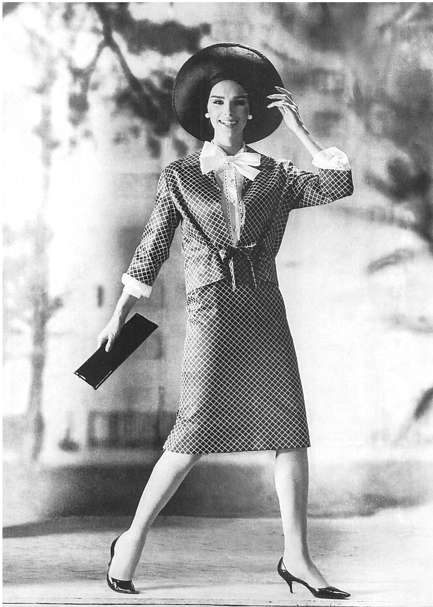
METTLER & CIE S.A., SAINT-GALL Satin de coton Baumwollsatin Modèle Lindenstaedt & Brettschneider, Berlin