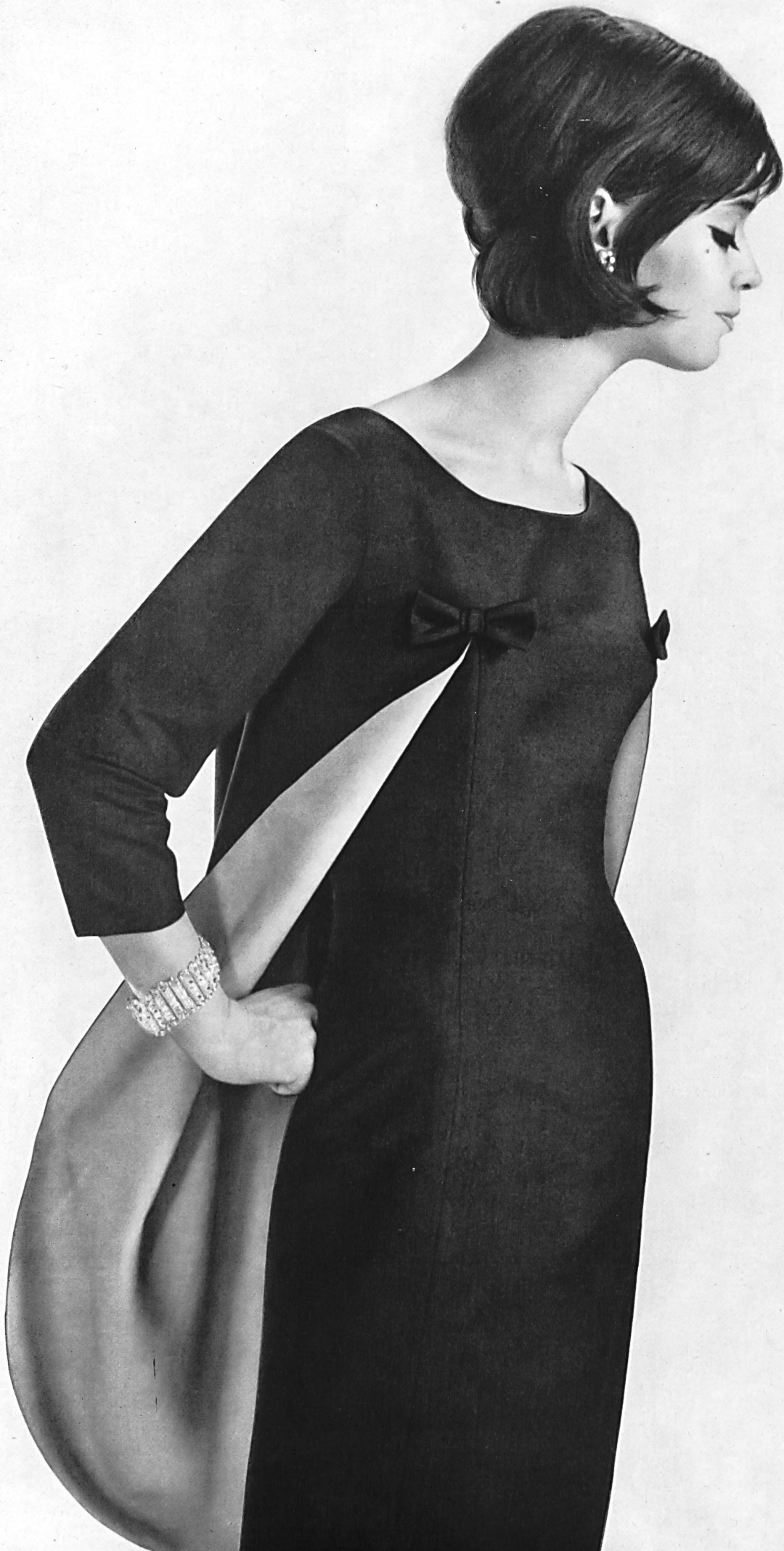
EUGEN BRAUNSCHWEIG A.G., ZURICH Modèle en pure soie Pure silk model Modelo de seda pura Reinscidenes Modellkleid