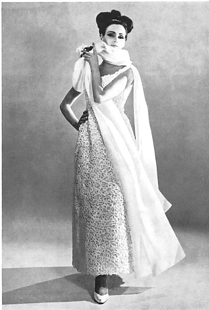
Guipure blanche de Saint-Gall St. Gall white etched lace Encaje guipur blanco de San Gato Weisse St. Galler Guipure Modèle Macola S. A., Zurich

donc voir, d'un seul coup d'œil, les prises de vues de la TV dans un studio aménagé sur la scène et leur retransmission directe en couleurs sur l'écran placé au-dessus. Ajoutons que l'emploi de l'Eidophore avait ceci d'intéressant qu'il permettait de présenter à volonté en tout gros plan, à la salle entière, le détail des tissus et broderies utilisés.