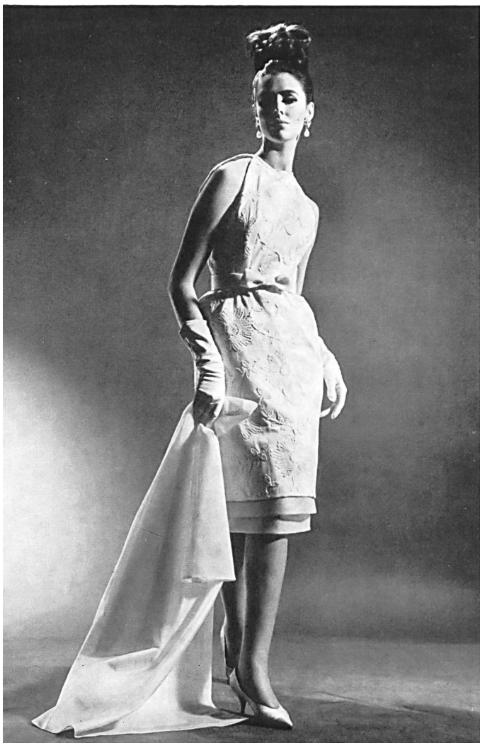
Shantung de coton brodé suisse Embroidered Swiss cotton Shantung Shantung de algodón bordado suizo Bestickter Schweizer Baumwoll-Shantung Modèle Jeanpalmério, Zurich