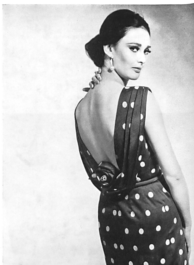
STOFFEL S. A., SAINT-GALL Shantung de coton à dessin plumetis Cotton shantung with dotted Swiss sample Shantung de algodón con dibujos de plumetis Baumwollshantung mit Plumetis-Dessin Modèle Couture Marianne, Saint-Gall

donc voir, d'un seul coup d'œil, les prises de vues de la TV dans un studio aménagé sur la scène et leur retransmission directe en couleurs sur l'écran placé au-dessus. Ajoutons que l'emploi de l'Eidophore avait ceci d'intéressant qu'il permettait de présenter à volonté en tout gros plan, à la salle entière, le détail des tissus et broderies utilisés.