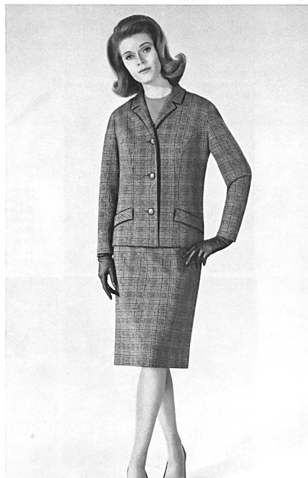
Modèle « BELFA », OUMANSKY & CO., GENÈVE Trois pièces de genre sportif en laine et rayonne. Jupe à plis nervurés