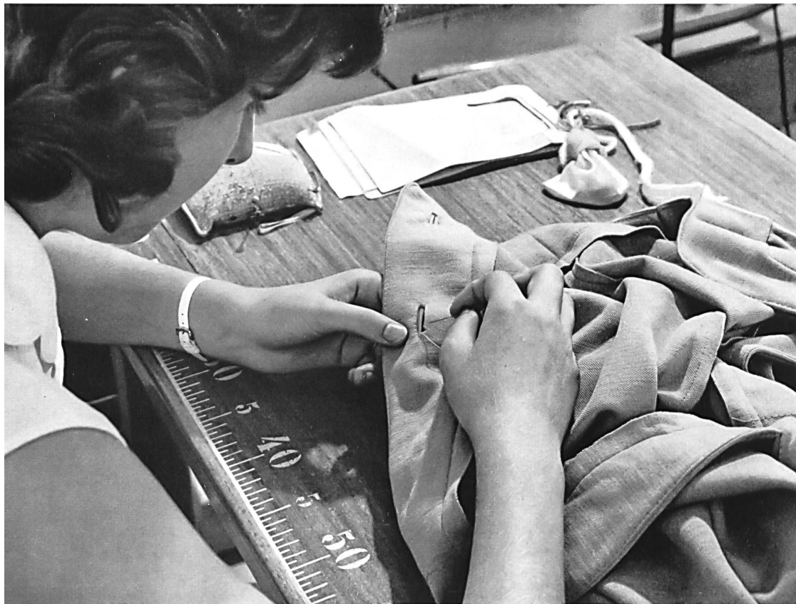
La formation professionnelle des jeunes générations est suivie de très près par l'industrie suisse de la maille