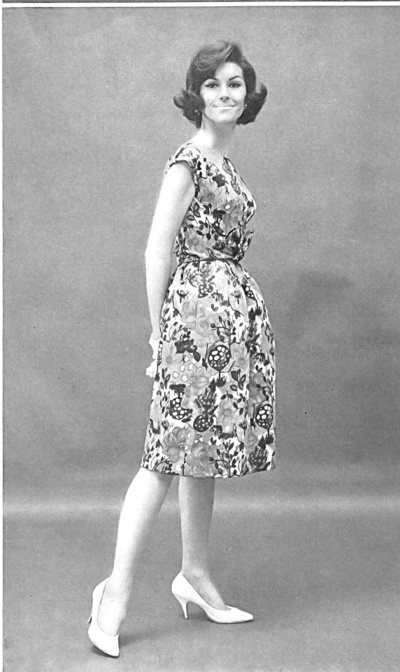
3 METTLER & CIE S. A., SAINT-GALL Impression multicolore sur coton à côtes Multicolored print on ribbed cotton fabric Modèle Adele Simpson, Inc., New York