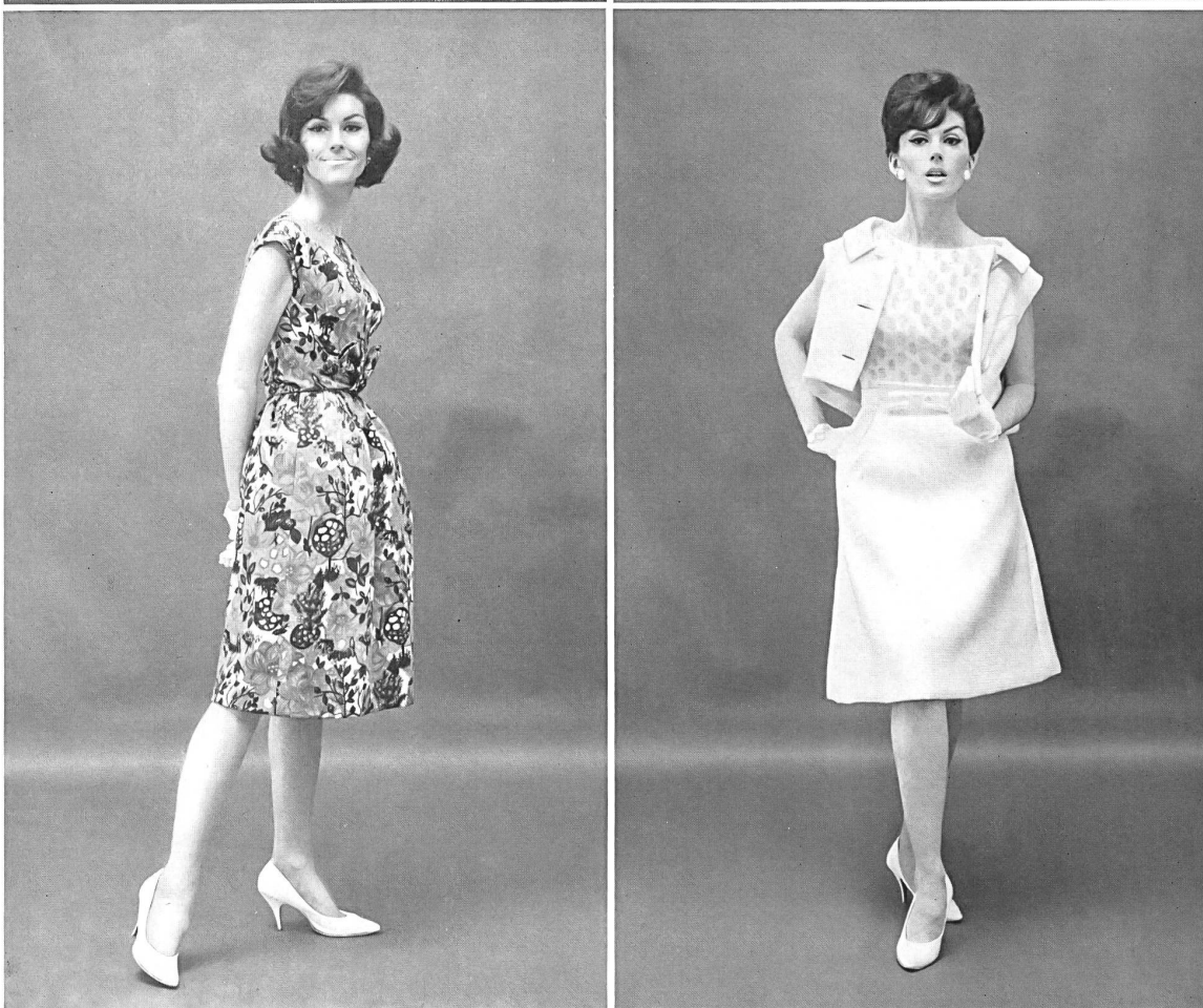
4 « Nelo », J.G. NEF & CO. S. A., HERISAU Ottoman de coton Cotton ottoman Modèle de Mollie Parnis, Parnis-Livingston Inc., New York

Swiss Fabric and Embroidery Center, New York