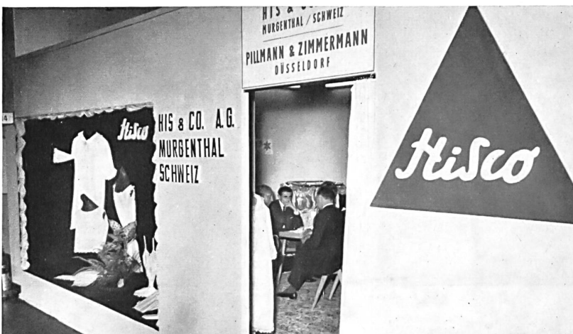
Vue du stand de la maison The stand of El vista del « stand » de la casa Der Stand der Firma HIS & CIE S. A., MURGENTHAL